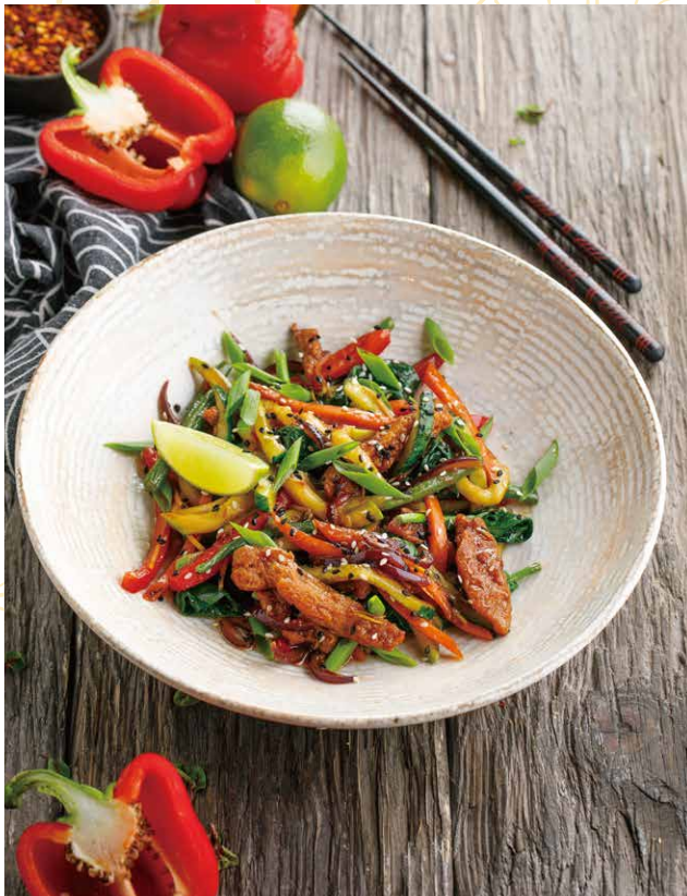
ТЕПЛЫЙ АЗИАТСКИЙ САЛАТ