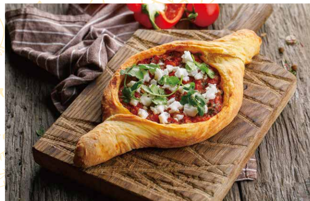
ЛОДОЧКА ИЗ СЛОЕНОГО ТЕСТА С ОВОЩАМИ ГРИЛЬ 590 Р 320 гр.