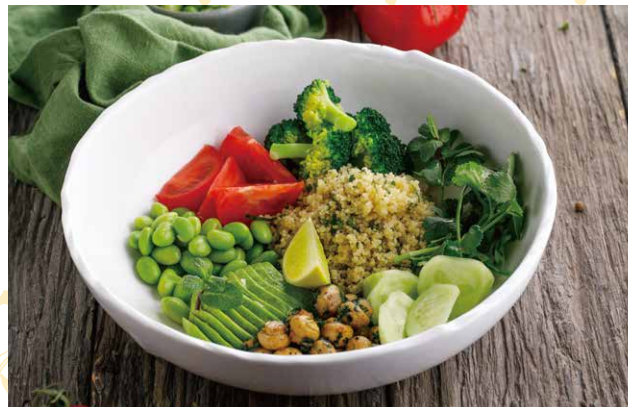
ОВОЩНОЙ БОУЛ С ГРИБАМИ И АВОКАДО 460 Р 210 / 100 гр.