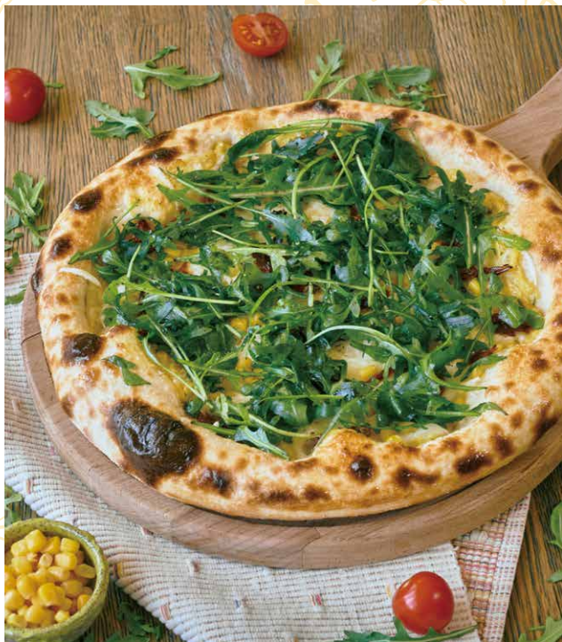
ПИЦЦА С РУККОЛОЙ И ОВОЩАМИ 550 Р 300 гр.