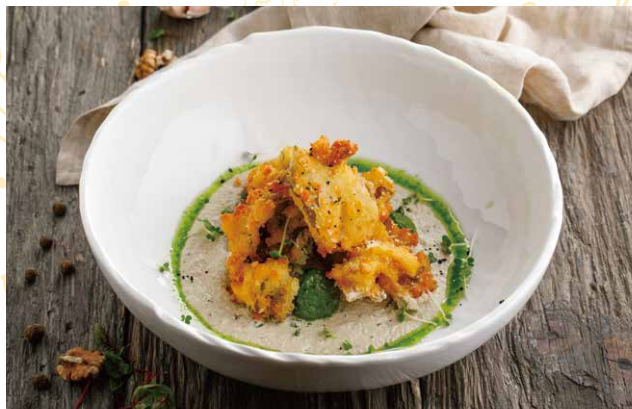
ХРУСТЯЩИЕ ВЕШЕНКИ 390 Р 150 / 70 / 15 гр.