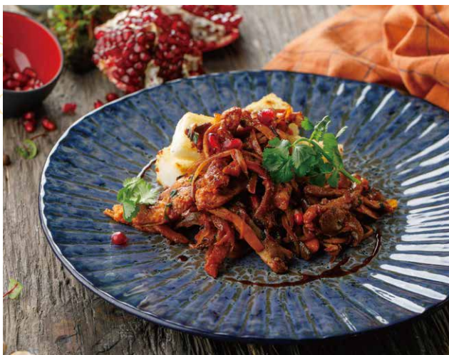
КУЧ-МАЧИ С ЖАРЕНОЙ МАМАЛЫГой 490 Р 200 / 100 / 10 гр.