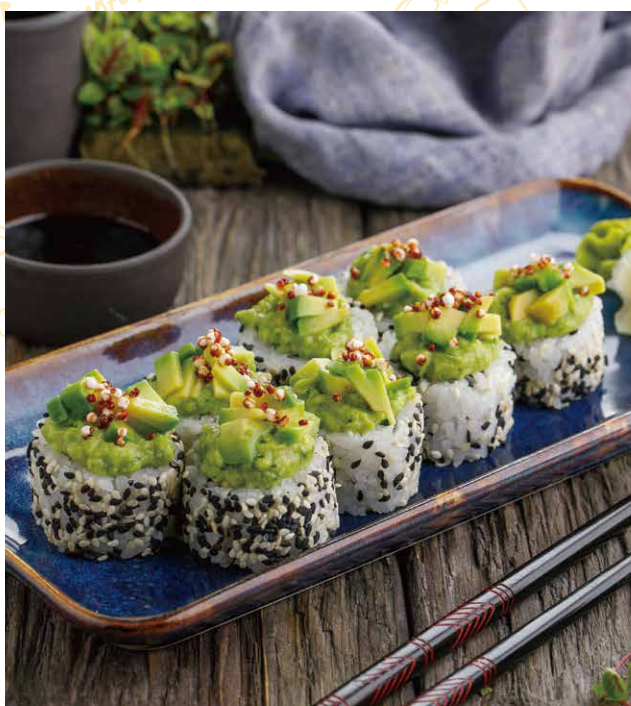
РОЛЛ С ГУАКАМОЛЕ 390 Р 160 гр.