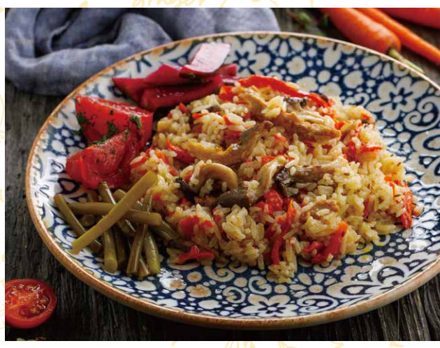
ПЛОВ С СОЛЕЩЬЯМИ 420 Р 300 / 90 гр.