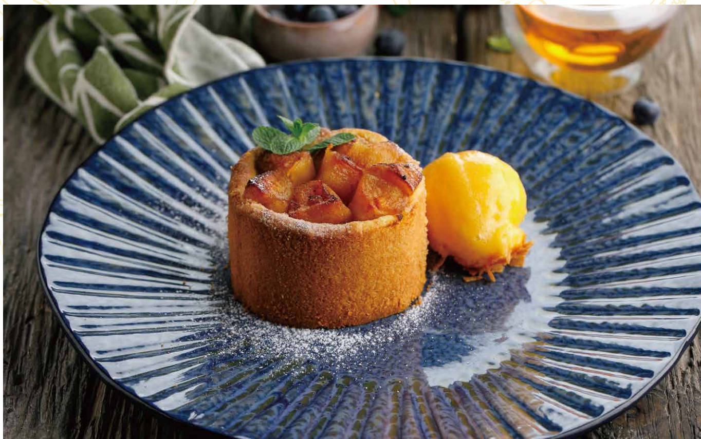
ТЁПЛЫЙ ЯБЛОЧНЫЙ ПИРОГ