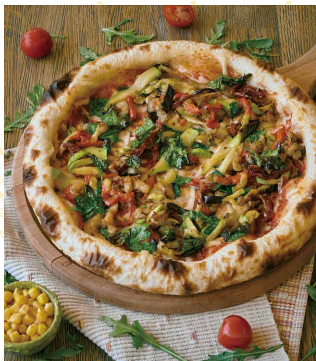
ПИЦЦА С ЦУКИНИ И БАКЛАЖАНОМ 590 Р 500 гр.