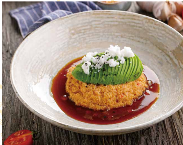
КИШОА С АВОКАДО И ОВОЩНЫМ ДЕМИГЛЯСОМ 550 Р 250 гр.