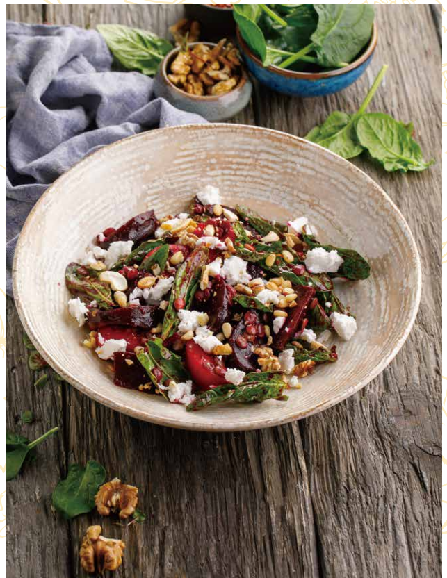
САЛАТ СО СВЕКЛОЙ И БРЫНЗОЙ