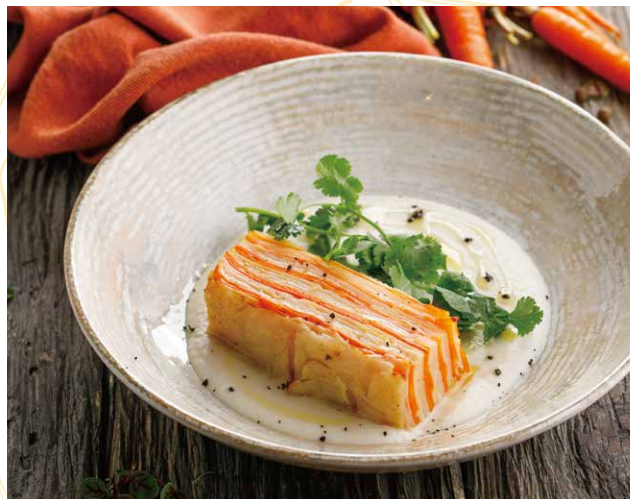
ОВОЩНОЙ ГРАТЕН С КРЕМОМ ИЗ КОРНЯ СЕЛЬДЕРЕЯ 350 Р 140 / 70 гр.