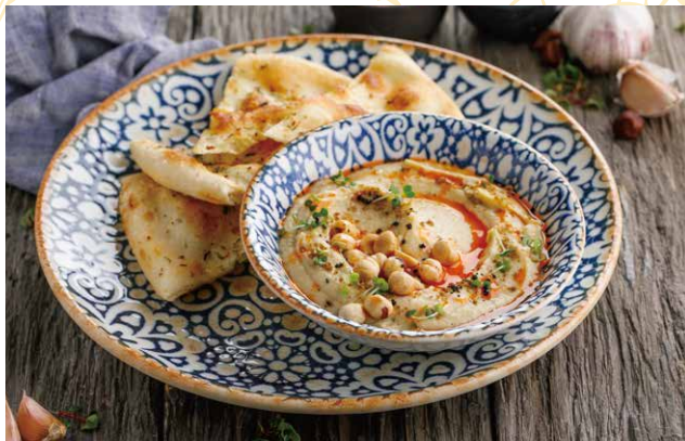
ХУМУС С ТРЯНОЙ ЛЕПЕШКОЙ 390 Р 125 / 60 гр.