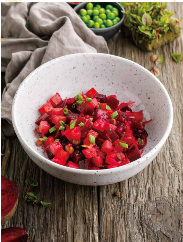
ВИНЕГРЕТ С АРОМАТНЫМ МАСЛОМ