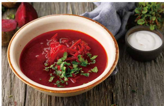
БОРЩ С ФАСОЛЬЮ