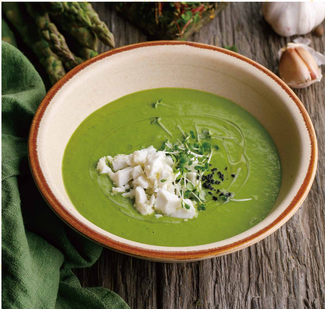
СУП ИЗ СПАРЖИ С БРЫНЗОЙ