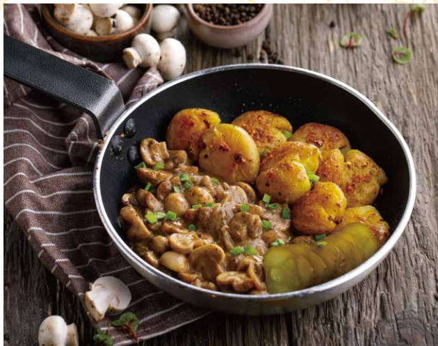
ГРИБЫ ПО-СТРОГАНОВСКИ С МЯТМ КАРТОФЕЛЕМ 520 Р 190 / 120 / 30 гр.