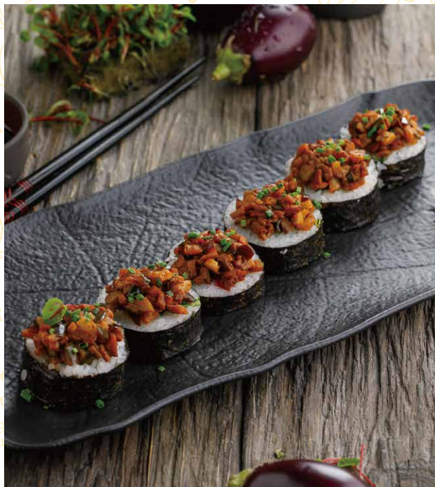
РОЛЛ С БАКЛАЖАНОМ 390 Р 180 гр.