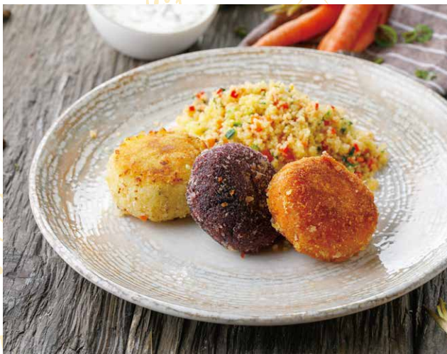
ОВОЩНЫЕ КОТЛЕТЫ С КУС-КУСОМ И СОУСОМ ТАР-ТАР 390 Р 210 / 120 гр.