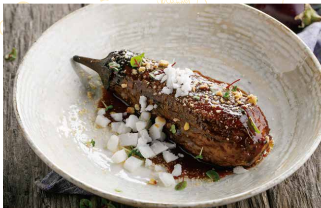
ПЕЧЕННЫЙ БАКЛАЖАН С ОВОЩНЫМ ДЕМИГЛЯСОМ 590 Р 240 / 60 / 20 гр.