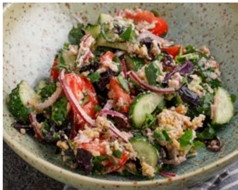
ОВОЩНОЙ САЛАТ ПО-ГРУЗИНСКИ С ОРЕХАМИ 469 ₺ VEGETABLE SALAD A LA GEORGIA WITH NUTS 格鲁吉亚蔬菜坚果沙拉