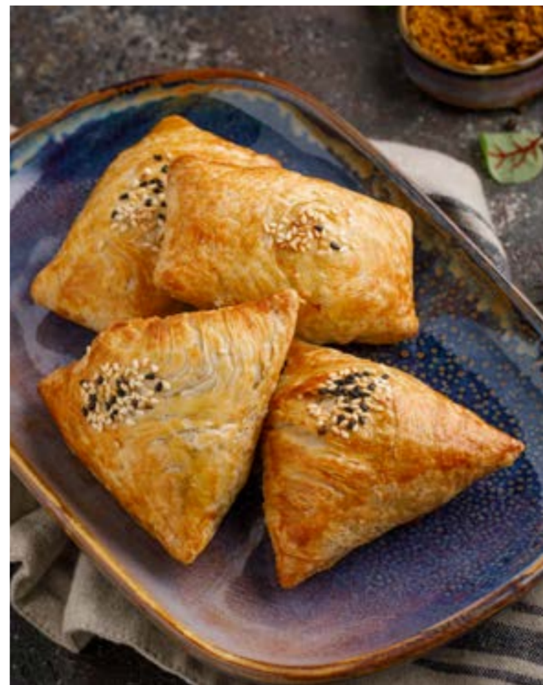
САМСА (2 ШТ.) С КУРИЦЕЙ / БАРАНИНОЙ 319/359 ₺ SAMOSA (2 PCS.) WITH CHICKEN / LAMB 鸡肉/羊肉烤包子 (两个)