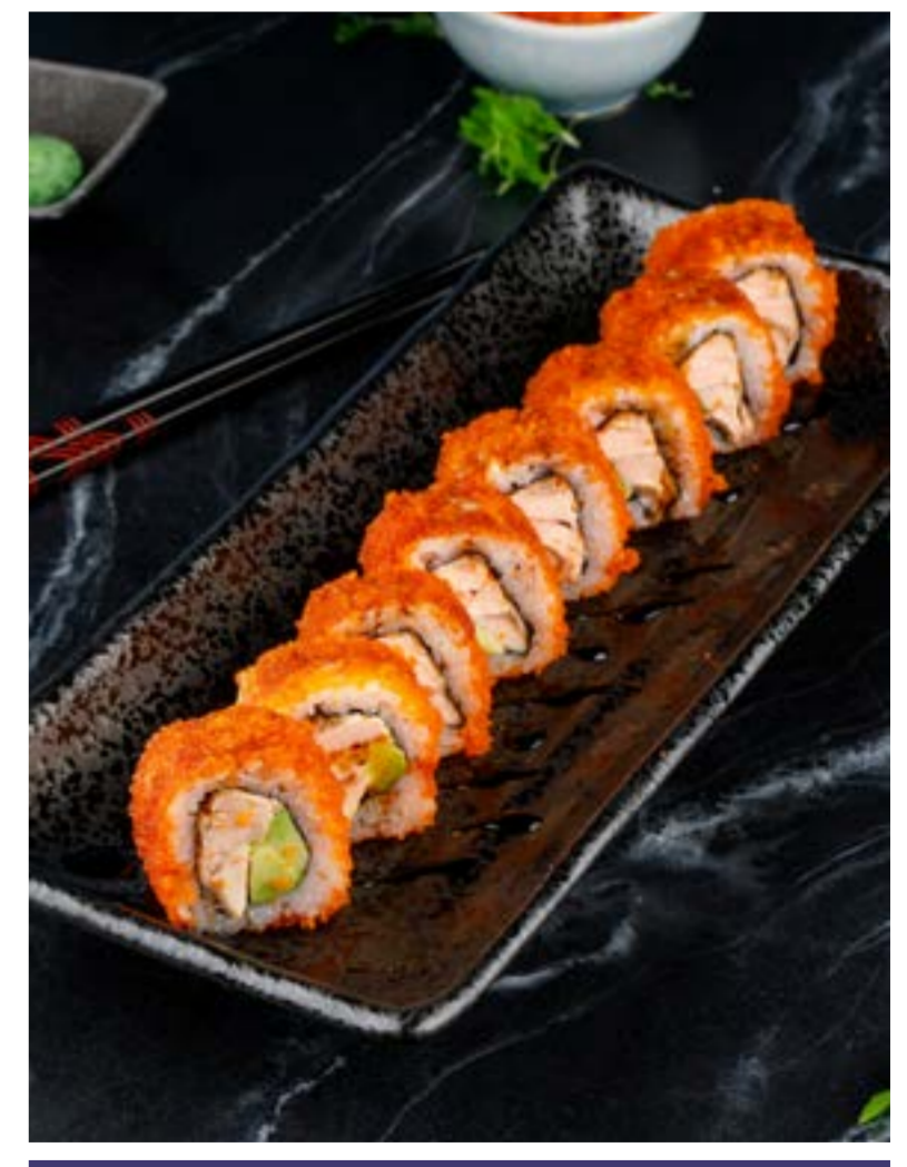
РОЛЛ С ЛОСОСЕМ ТЕРИЯКИ / С КУРИЦЕЙ ТЕРИЯКИ 539/529 ₺ SALMON / CHICKEN TERIYAKI ROLL / 三文鱼卷/照烧鸡肉

Просьба предупредить вашего официанта об имеющейся у вас аллергии на определенные продукты питания. Все цены указаны в рублях. На фото использованы элементы декора. Please, tell your waiter if you have any food allergy to certain products. All prices are in rubles. The pictures have decorative elements. 请通知您的服务员。所有价格为卢布价。