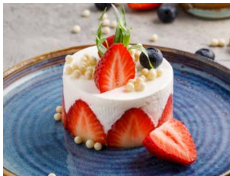
«СМЕТАНИК» С КЛУБНИКОЙ 489 ₺ SOUR CREAM CAKE WITH STRAWBERRY / 草莓酸奶蛋糕