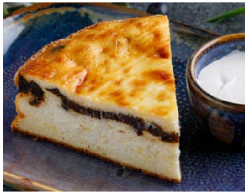
ТВОРОЖНАЯ ЗАПЕКАНКА С ЧЕРНОСЛИВОМ И СМЕТАНОЙ 429 ₺ COTTAGE CHEESE PUDDING WITH PRUNES AND SOUR CREAM / 奶渣烤布丁配黑梅干和酸奶油