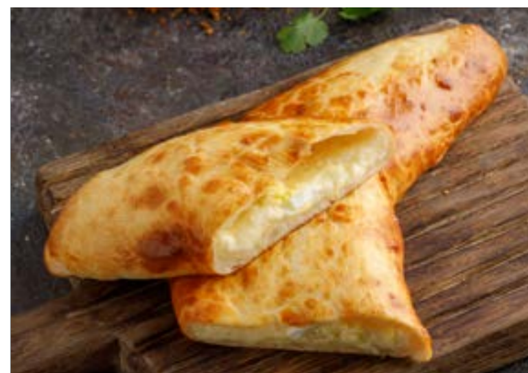
ХАЧАПУРИ ПО-ГУРИЙСКИ С РУБЛЕННЫМ ЯЙЦОМ