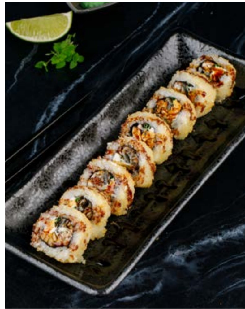
ТЕМПУРНЫЙ РОЛЛ С ЛОСОСЕМ / КРЕВЕТКОЙ / УГРЕМ / ТУНЦОМ 649/689/789/789 ₺ TEMPURA ROLL WITH SALMON / SHRIMP / EEL / TUNA 三文鱼/鳗鱼/对虾/金枪鱼卷