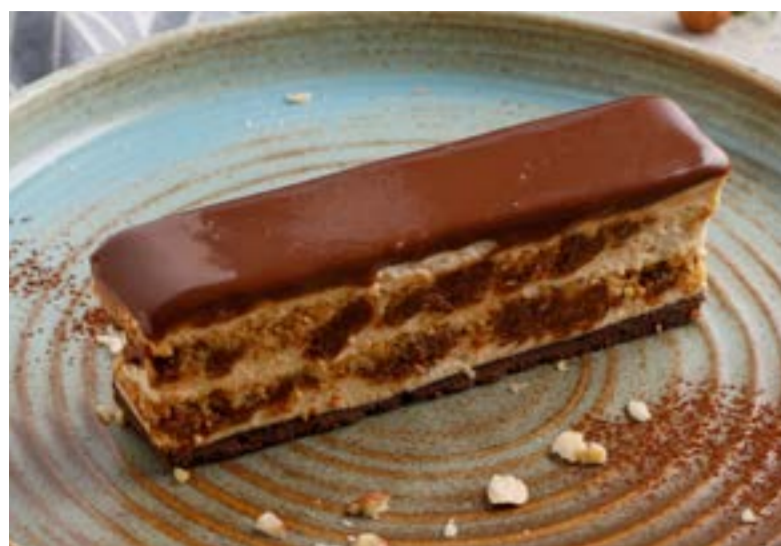
ФУНДУЧНЫЙ ТОРТ 569 ₺ HAZELNUT CAKE / 榛子蛋糕