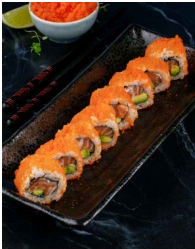
«КАЛИФОРНИЯ» С ЛОСОСЕМ / С УГРЕМ / С КРАБОМ 789 ₺ 789/889 ₺ CALIFORNIA WITH SALMON/EEL/CRAB 三文鱼/鳗鱼/螃蟹加州卷