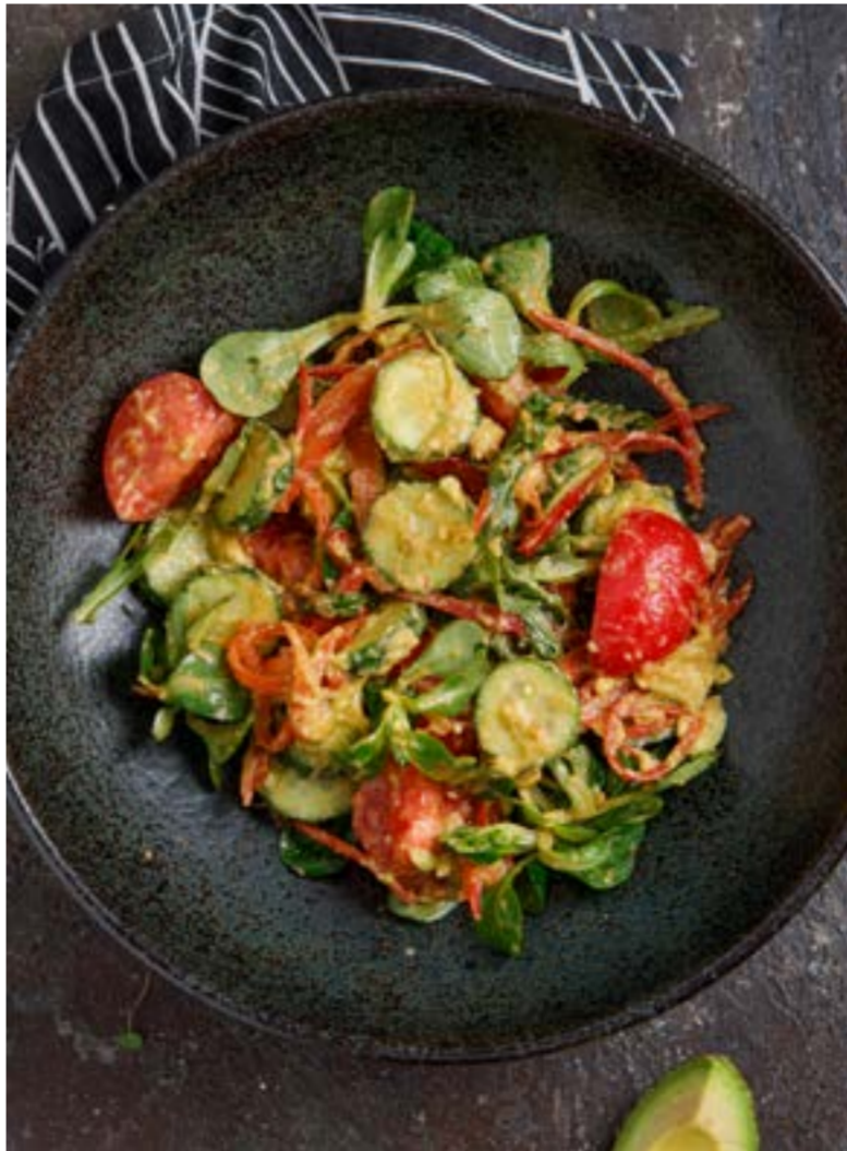
ВЕГЕТАРИАНСКИЙ САЛАТ С АВОКАДО 569 ₺ VEGETARIAN SALAD WITH AVOCADO / 素食牛油果沙拉