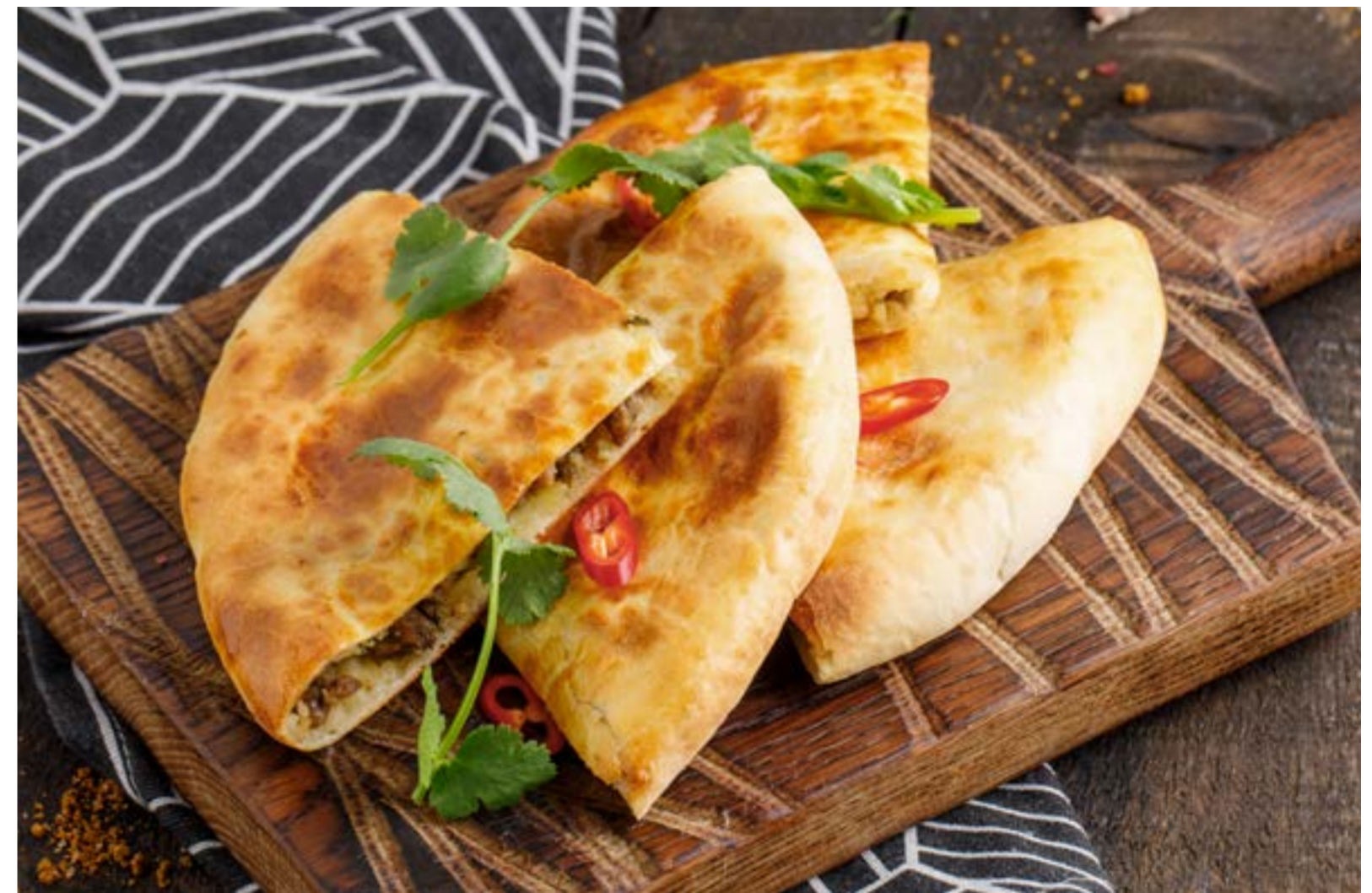
ПИРОГ С КАРТОФЕЛЕМ И МЯСОМ (НА ВЫБОР: ГОВЯДИНА ИЛИ БАРАНИНА) 649 ₺ PIE WITH POTATO AND MEAT (OPTIONAL: BEEF OR LAMB) / 土豆和肉大馅饼 (牛肉或羊肉馅)