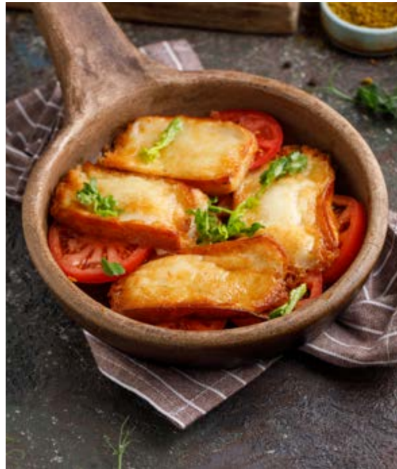
ЗОЛОТИСТЫЕ МЧАДИ С КОНВЕРТИКАМИ 489 ₹ ИЗ СУГУЛУНИ С НАДУГИ GOLDEN MCHADI WITH SULGUNI AND NADUGI TURNOVERS 玉米面包配苏尔古尼和格鲁吉亚奶酪