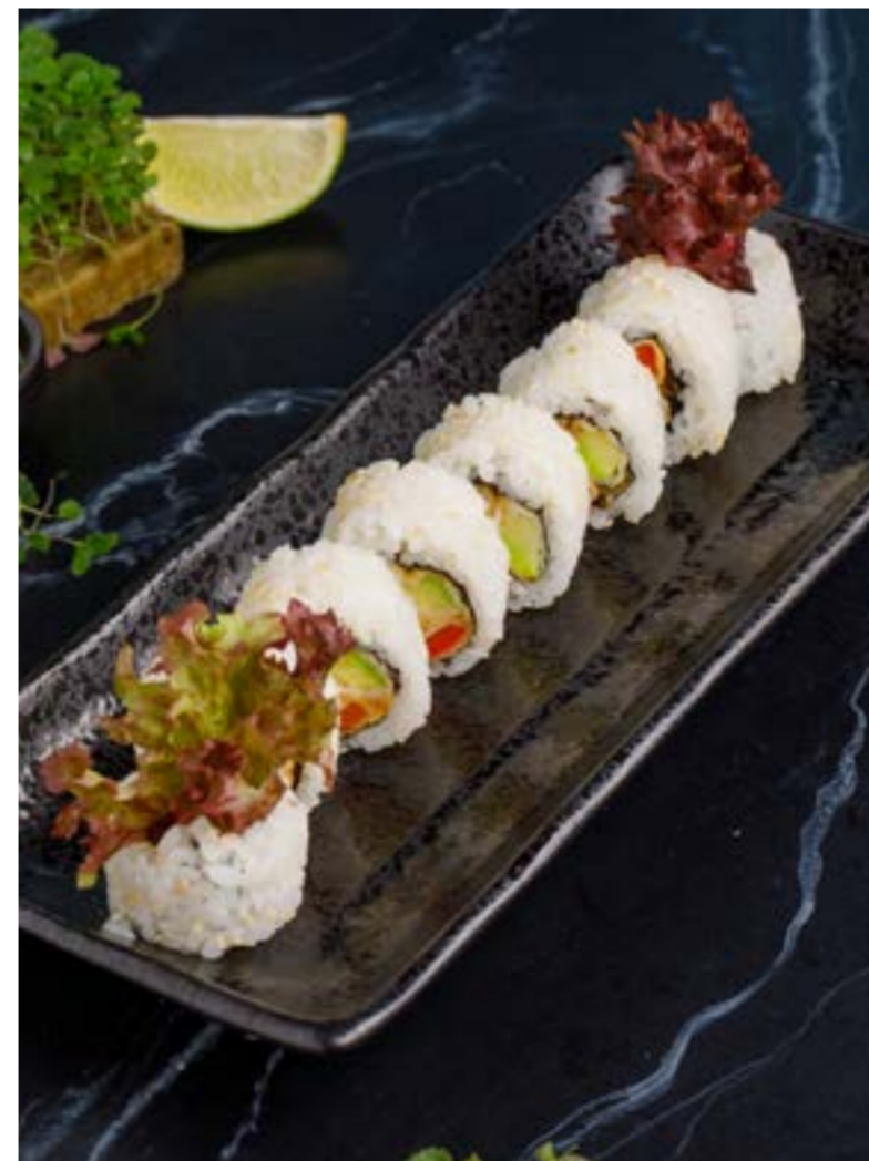
ВЕГЕТАРИАНСКИЙ РОЛЛ 369 ₺ VEGETARIAN ROLL / 素食卷