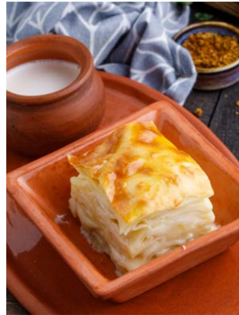
АЧМА 549 ₹ подаётся с соусом мацони ACHMA WITH MATSONI SAUCE / 卡查普里配酸牛奶酱