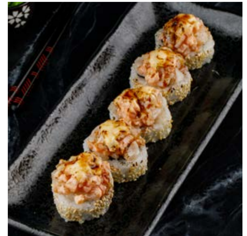
РОЛЛ С ОПАЛЕННЫМ ГРЕБЕШКОМ И СОУСОМ BBQ 589 ₺ ROLL WITH SEARED SCALLOP AND BBQ SAUCE 半烤扇贝卷配烧烤酱

ROLL WITH CUCUMBER / AVOCADO / SALMON / TUNA / EEL | 黄瓜/牛油果/三文鱼/金枪鱼/鳗鱼卷