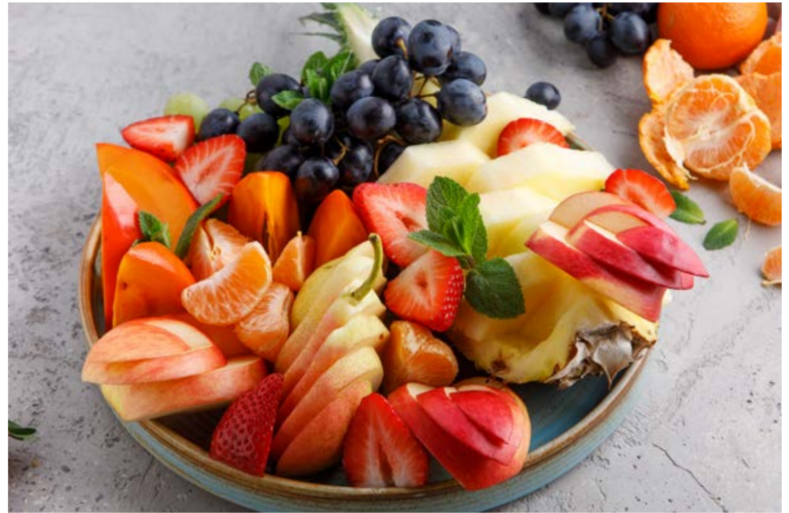
ФРУКТОВАЯ ТАРЕЛКА 1389 ₺ FRUIT PLATE / 水果盘