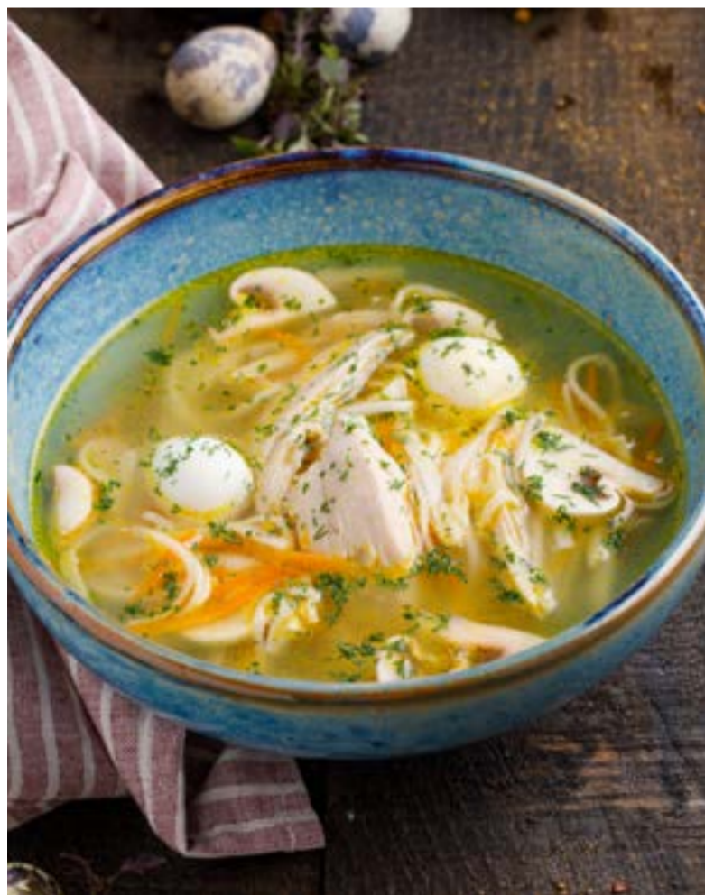
ДОМАШНИЙ СУП-ЛАПША С КУРОЙ / КУРОЙ И ГРИБАМИ