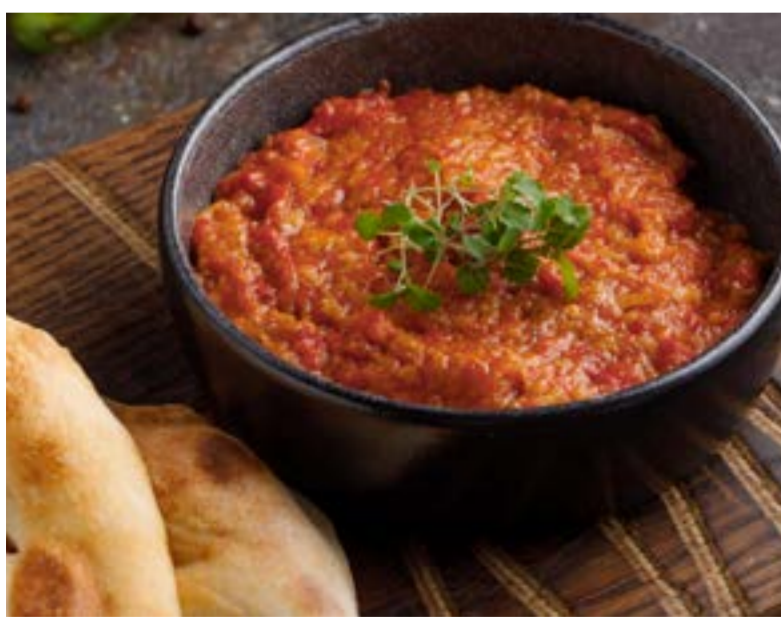
БАКЛАЖАННАЯ ИКРА 389 ₺ EGGPLANT CAVIAR / 茄子酱