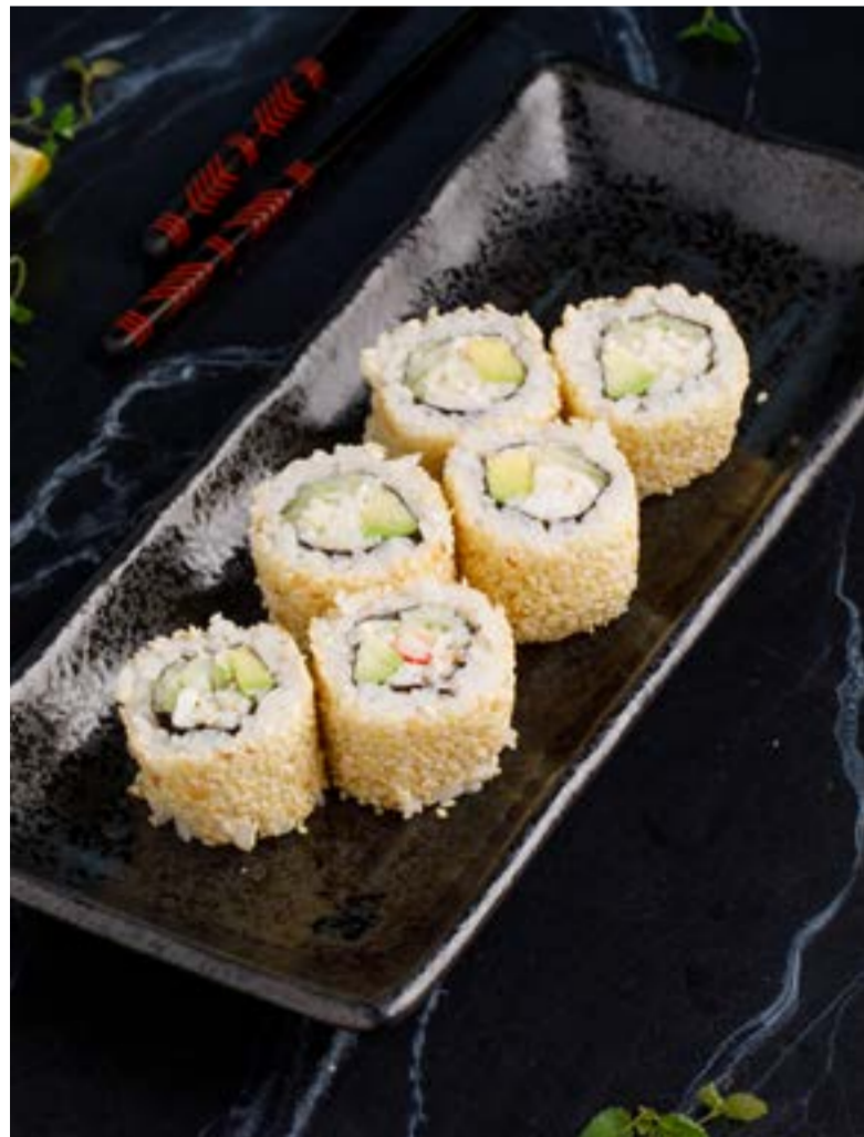
«КАЛИФОРНИЯ» В КУНЖУТЕ С КРАБОМ 789 ₺ CALIFORNIA IN SESAME WITH CRAB 芝麻螃蟹加州卷