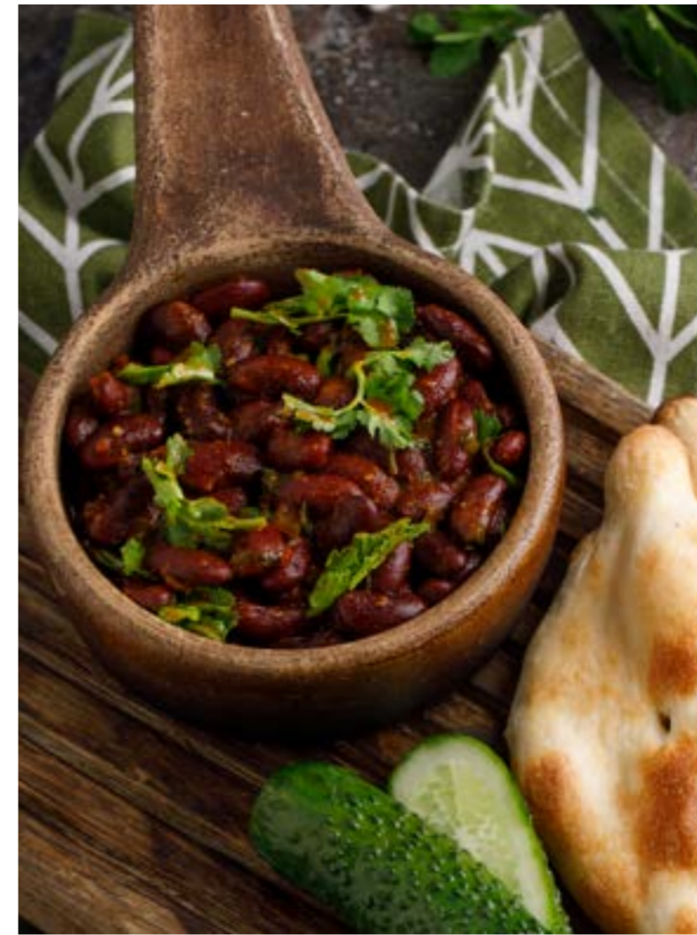
ЛОБИО «ХАРКАЛИЯ» 529 ₹ LOBIO KHARKALIA / 培育豆炖汤