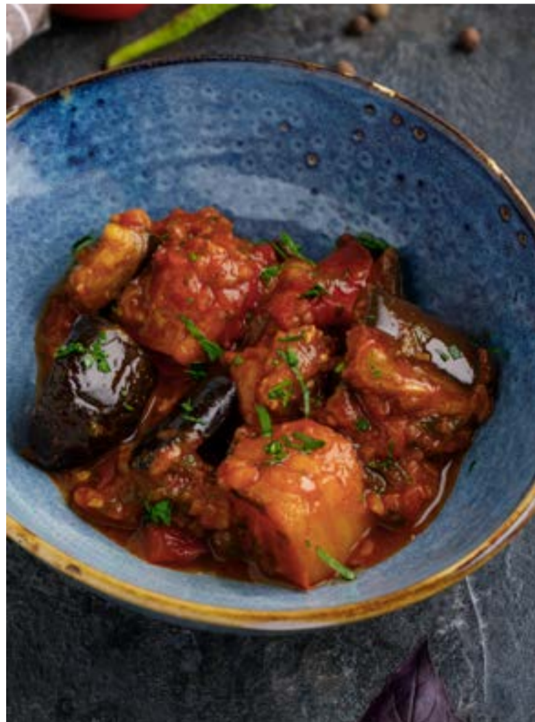
АДЖАПСАНДАЛ 489 ₹ AJAPSANDAL / 茄子炖