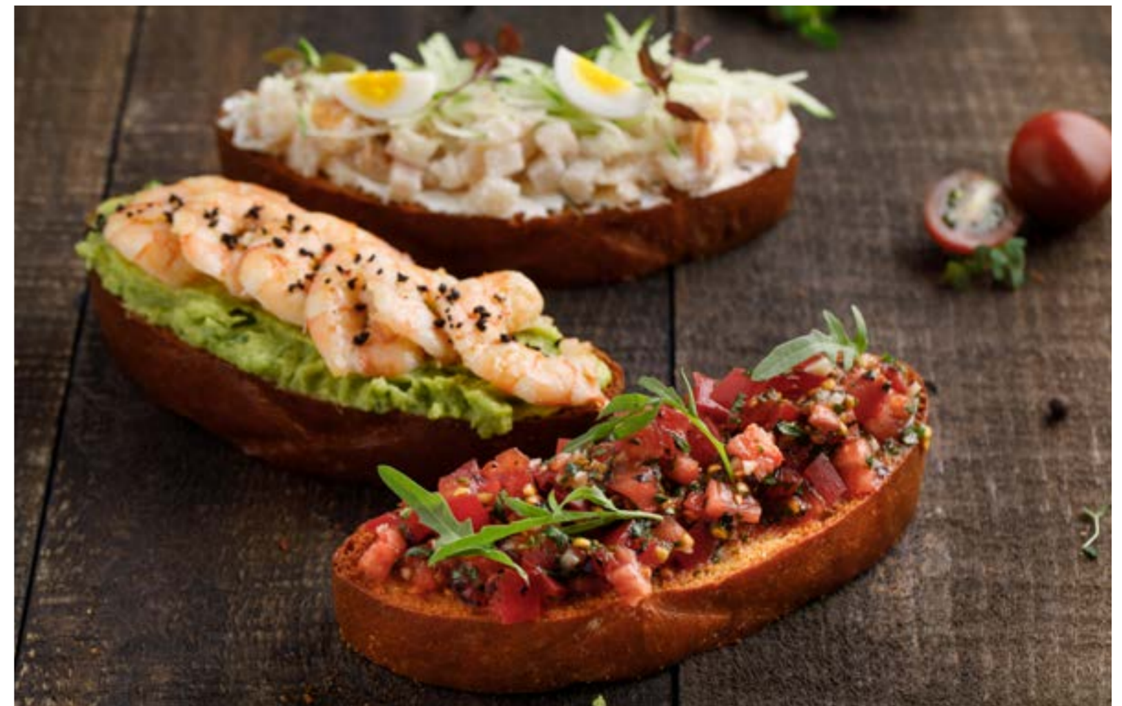
БРИОШЬ С ТОМАТАМИ / С КРЕВЕТКАМИ И АВОКАДО / С ТРЕСКОЙ 219/379/319 ₺ BRIOCHE WITH TOMATOES / WITH SHRIMPS AND AVOCADO / WITH COD 布里欧修加番茄 / 加鲜虾牛油果 / 加油鱼