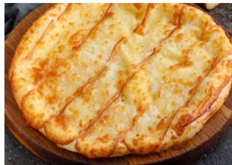
ХАЧАПУРИ С КОПЧЕНЫМ СЫРОМ СУЛУГУНИ