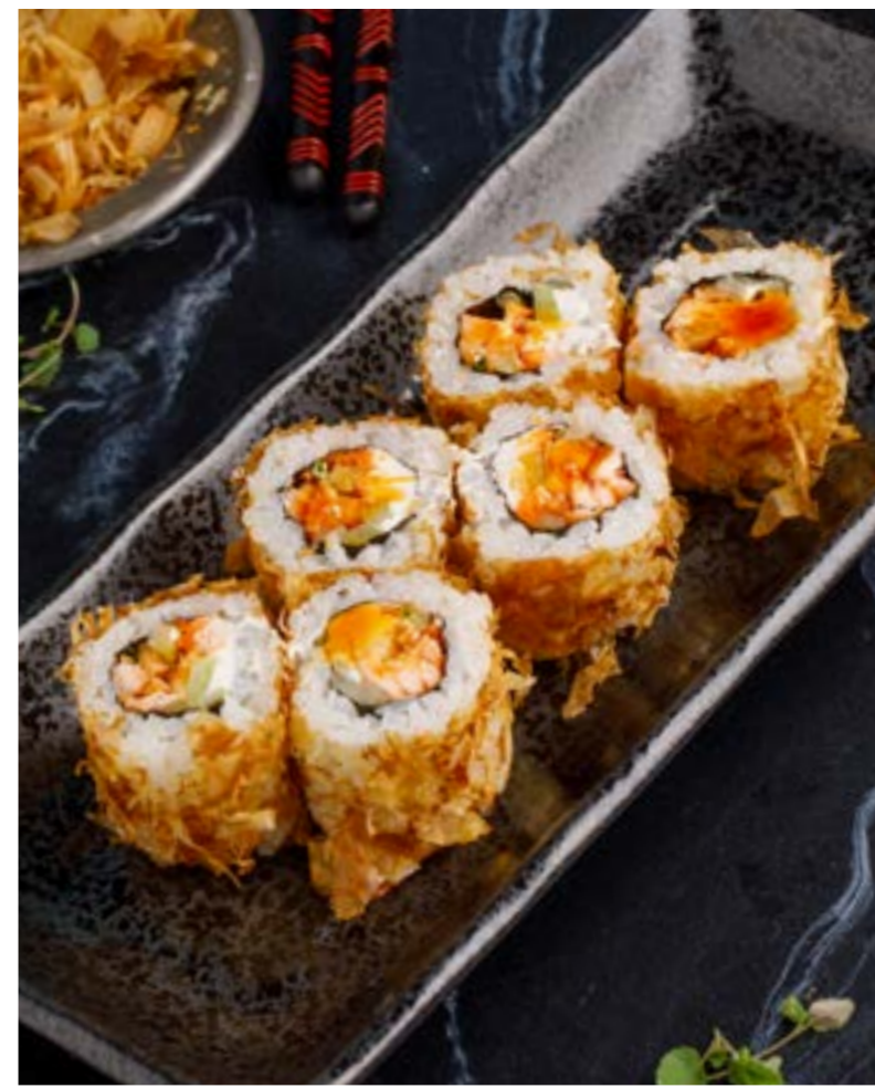
РОЛЛ «БОНИТО» С ЛОСОСЕМ / С УГРЕМ / С ТУНЦОМ 749 ₺ 749/749 ₺ BONITO ROLL WITH SALMON/EEL/TUNA 三文鱼/鳗鱼/金枪鱼刨花金枪鱼卷