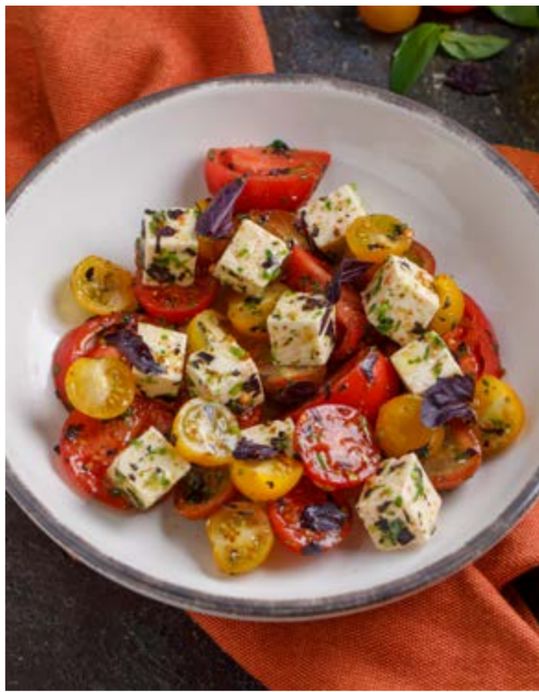
САЛАТ С ИМЕРЕТИНСКИМ СЫРОМ И ТОМАТАМИ 529 ₺ SALAD WITH IMERETIAN CHEESE AND TOMATOES 伊梅列希奶酪西红柿沙拉