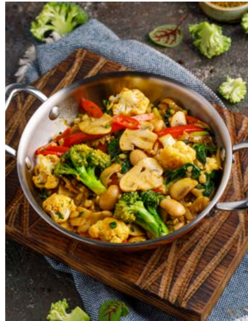
ПРЯНЫЕ ОВОЩИ С ГРИБАМИ 579 ₺ SPICY VEGETABLES WITH MUSHROOMS 香辣蘑菇蔬菜