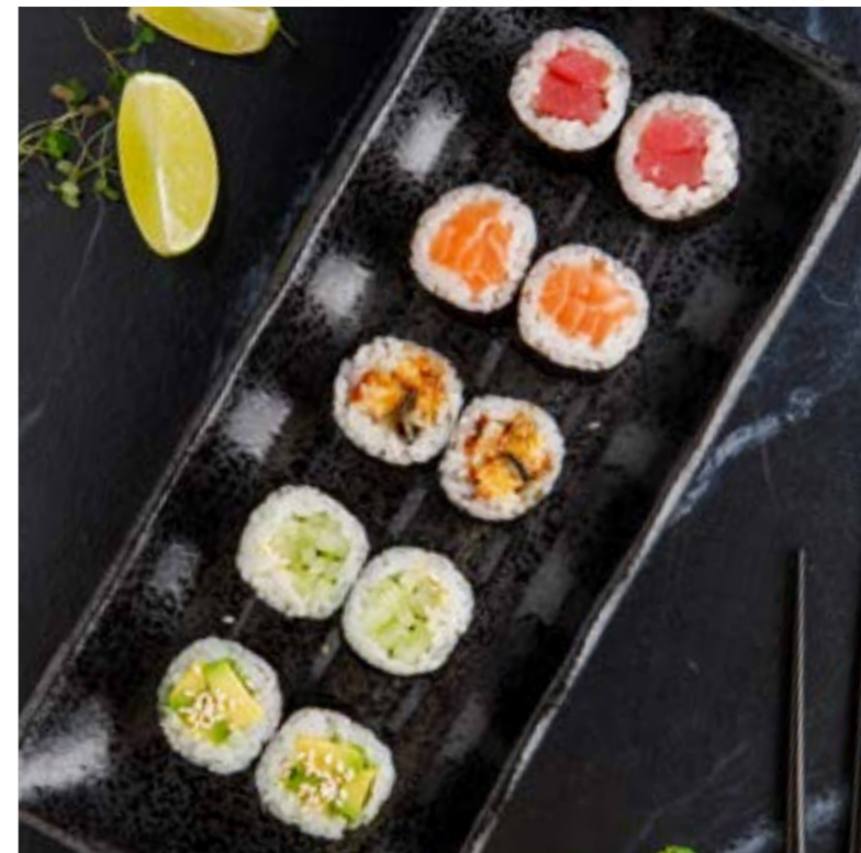
РОЛЛ С ОГУРЦОМ / С АВОКАДО / 249/319 ₺ С ЛОСОСЕМ / С ТУНЦОМ / С УГРЕМ 469/459/559 ₺

ROLL WITH CUCUMBER / AVOCADO / SALMON / TUNA / EEL | 黄瓜/牛油果/三文鱼/金枪鱼/鳗鱼卷