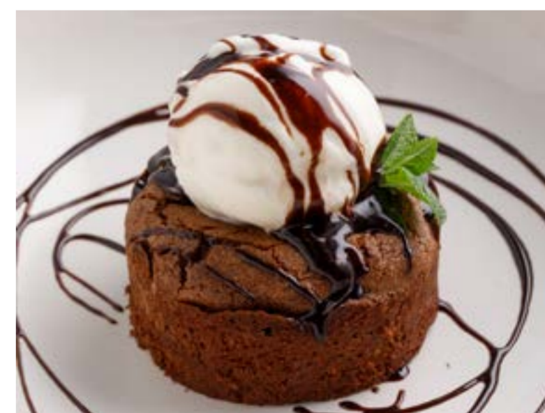
«ШОКОЛАДНАЯ ШКАТУЛКА» С ВАНИЛЬНЫМ МОРОЖЕНЫМ 569 ₺

PISTACHIO ROLL WITH RASPBERRY / 开心果复盆子甜馅卷