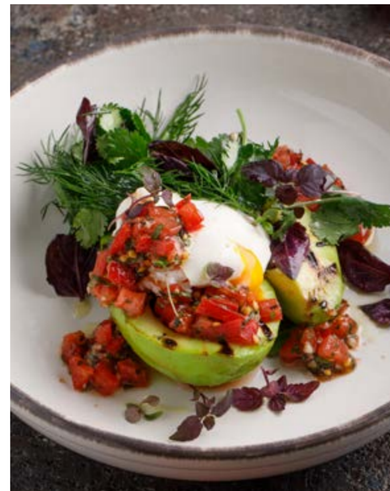
ПЕЧЕНОЕ АВОКАДО С ТОМАТНОЙ САЛЬСОЙ И ЯЙЦОМ ПАШОТ 489 ₺ BAKED AVOCADO WITH TOMATO SALSA AND POACHED EGG / 烤牛油果配番茄莎莎和水煮嫩蛋