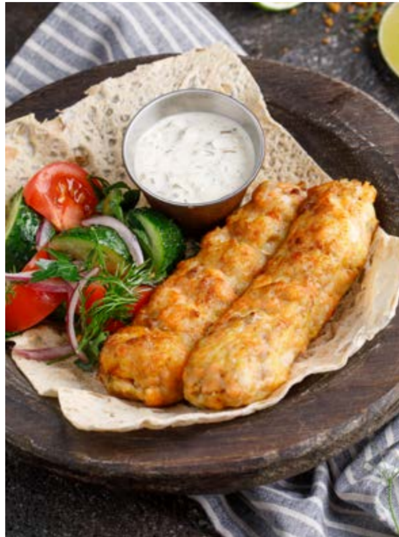
ЛЮЛЯ-КЕБАБ ИЗ РЫБЫ 739₽ FISH LULAH KEBAB / 鱼的莉莉亚·凯芭