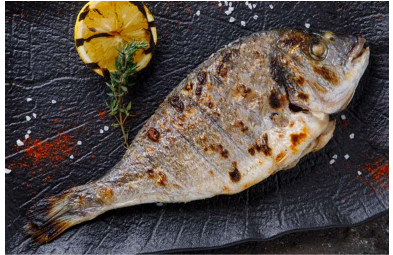
ДОРАДО НА ГРИЛЕ 1389₽ GRILLED DORADO / 烤金头鲷