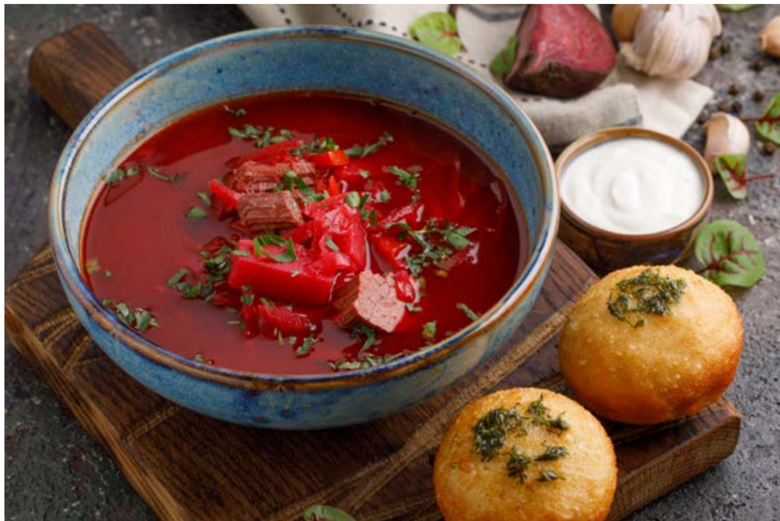
БОРЩ С ГОВЯДИНОЙ, СМЕТАНОЙ И ЧЕСНОЧНЫМИ ПАМПУШКАМИ