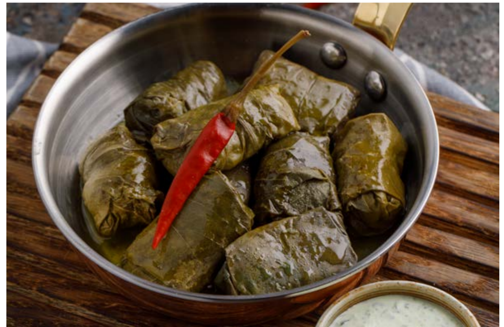
ДОЛМА СО СВИНИНОЙ И ГОВЯДИНОЙ / С БАРАНИНОЙ 519/619 ₺ DOLMA WITH PORK AND BEEF / WITH LAMB / 猪肉和牛肉/羊肉馅葡萄叶

Просьба предупредить вашего официанта об имеющейся у вас аллергии на определенные продукты питания. Все цены указаны в рублях. На фото использованы элементы декора. Please, tell your waiter if you have any food allergy to certain products. All prices are in rubles. The pictures have decorative elements. 所有价格为卢布价。