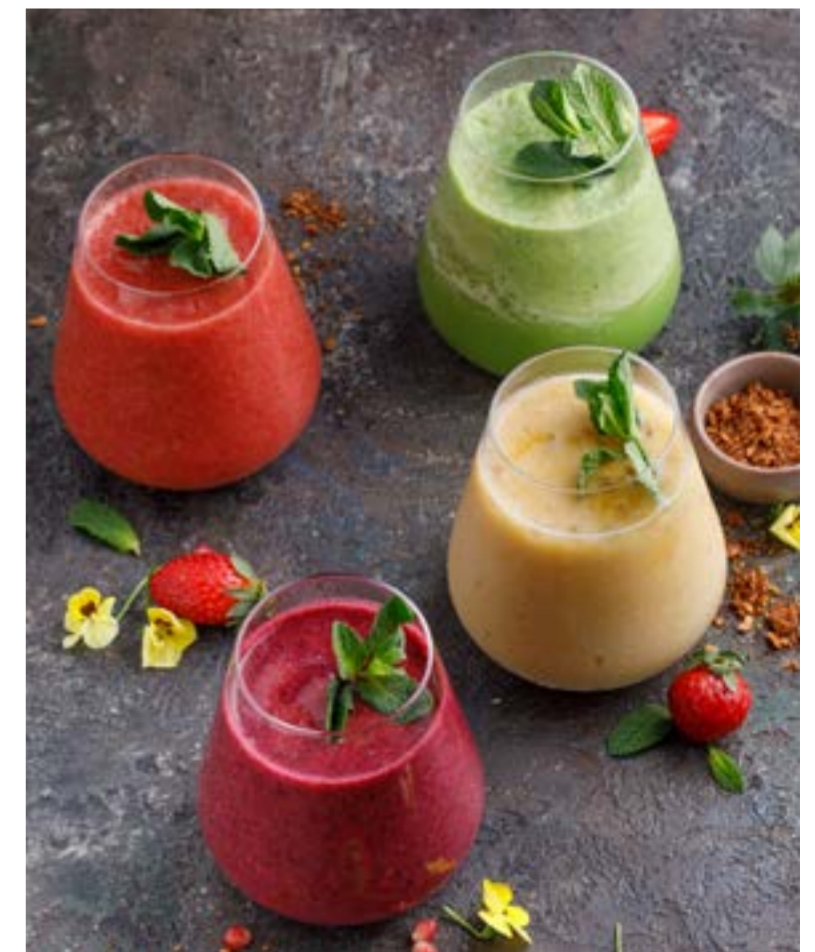
СМУЗИ КЛУБНИЧНЫЙ / С ЧЕРНОЙ СМОРОДИНОЙ / ГРУША-ШПИНАТ / ОВСЯНКА 329 ₺ STRAWBERRY SMOOTHIE / WITH BLACK CURRANT / SPINACH PEAR / OATMEAL | 草莓冰沙/加黑加仑/梨 菠菜/燕麦片

Просьба предупредить вашего официанта об имеющейся у вас аллергии на определенные продукты питания. Все цены указаны в рублях. На фото использованы элементы декора. Please, tell your waiter if you have any food allergy to certain products. All prices are in rubles. The pictures have decorative elements. 请通知您的服务员。所有价格为卢布价。