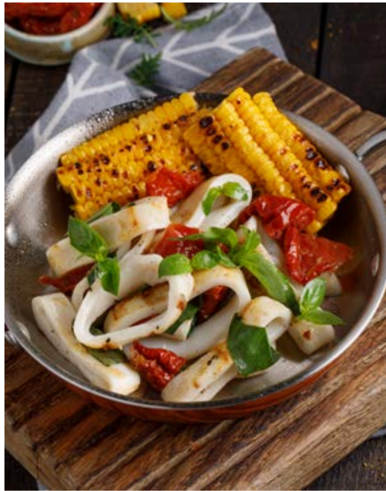
КАЛЬМАРЫ С ВЯЛЕНЫМИ ТОМАТАМИ И КУКУРУЗОЙ 749 ₺ SQUID WITH DRIED TOMATOES AND CORN 鱿鱼加晒干西红柿和玉米