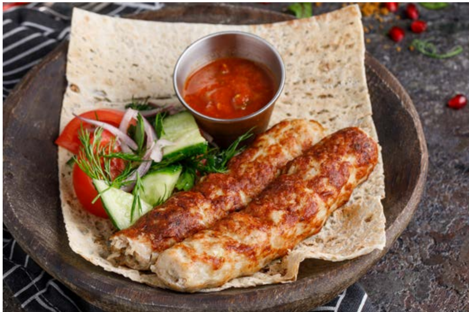
ЛЮЛЯ-КЕБАБ ИЗ КУРИЦЫ 689₽ CHICKEN LULAH KEBAB / 碎鸡肉烤串