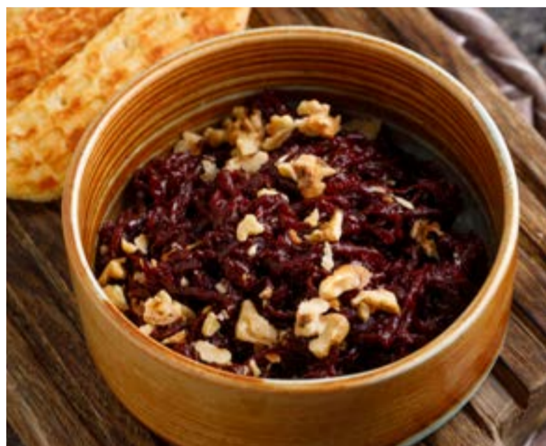
СВЕКОЛЬНАЯ ИКРА ПО БАБУШКИНОМУ РЕЦЕПТУ 329 ₺ BEET CAVIAR ACCORDING TO THE GRANDMA'S RECIPE 奶奶食谱甜菜酱