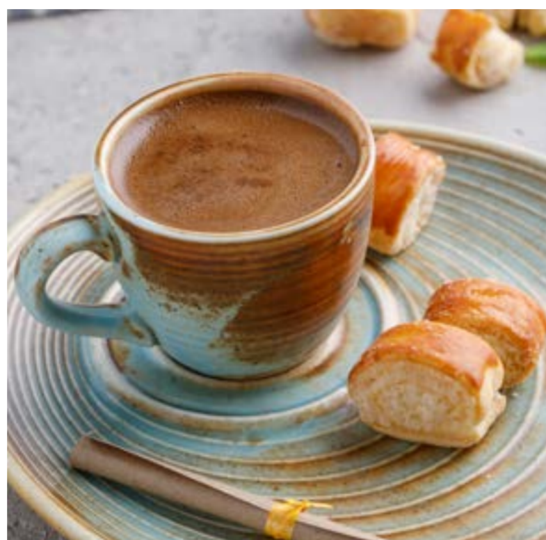
ЗАВАРНЫЕ БУЛОЧКИ «ШУ» 419 ₺

SUKHUMI-STYLE COFFEE WITH KADA COOKIES 苏呼米咖啡和核桃饼干