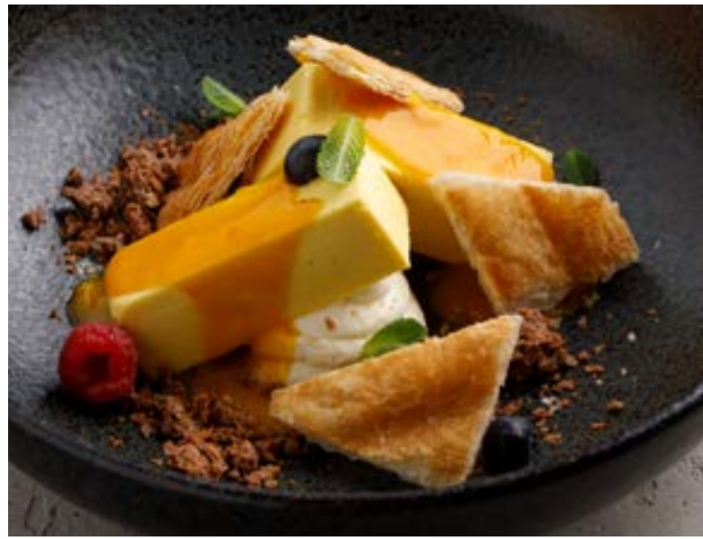
МАНГОВЫЙ МУСС 519 ₺ MANGO MOUSSE / 芒果慕斯