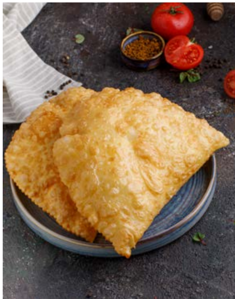
ЧЕБУРЕК С СЫРОМ / БАРАНИНОЙ / ТЕЛЯТИНОЙ 319/379/419 ₺ CHEBUREK WITH CHEESE / LAMB / VEAL 奶酪/羊肉/小牛肉馅炸饼