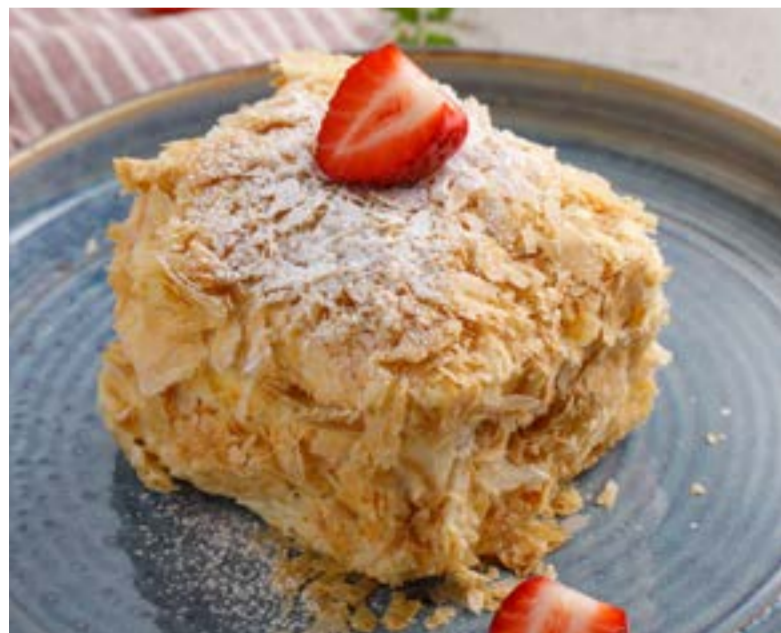
«НАПОЛЕОН» 529 ₺ MILLE-FEUILLE / 拿破仑蛋糕