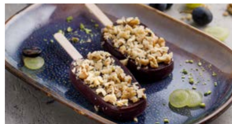
ПЕЛАМУШИ 329 ₺ PELAMUSHI / 格鲁吉亚葡萄汁玉米粉甜点