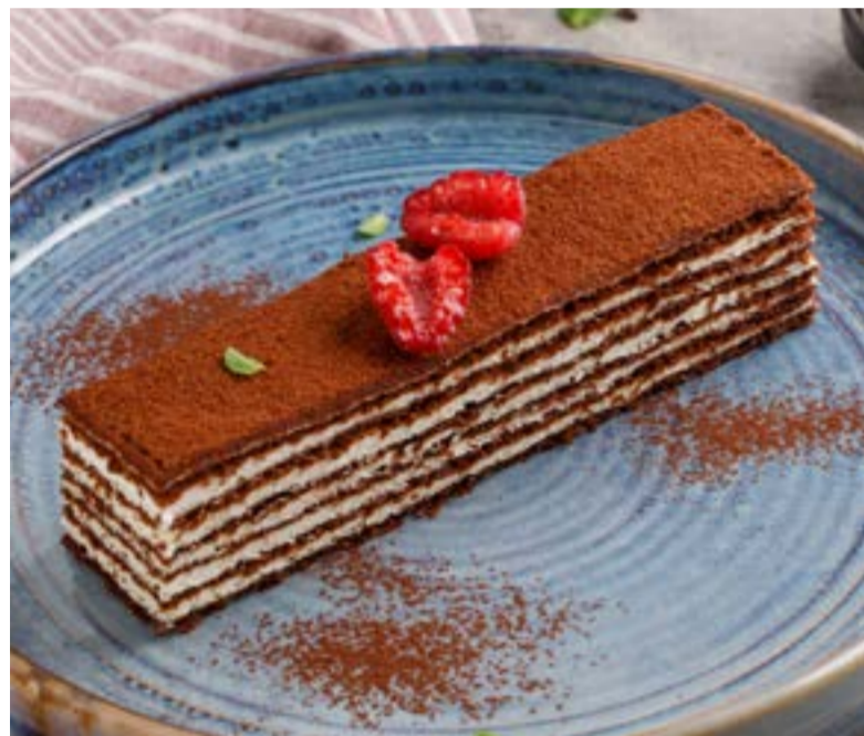
«ЗГАПАРИ» 489 ₺ ZGAPARI / 格鲁吉亚巧克力蜂蜜蛋糕