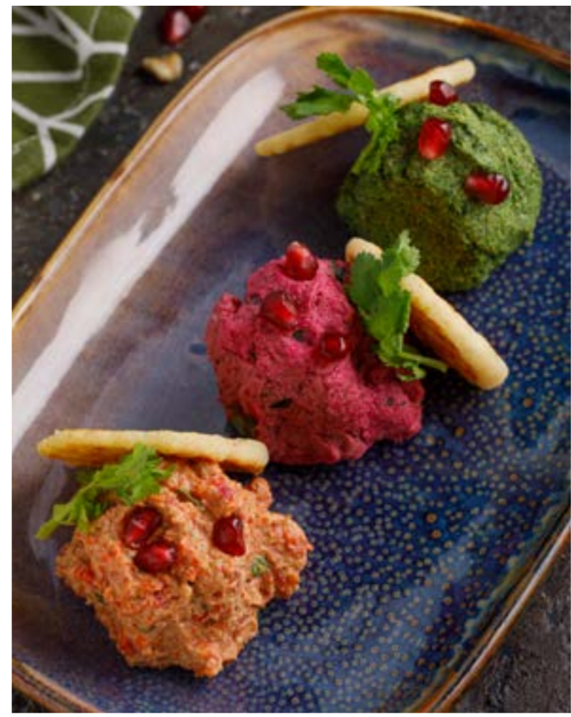
АССОРТИ ИЗ ПХАЛИ 419 ₺ шпинат / паприка / свекла ASSORTED PHALI spinach / paprika / beetroot 什锦格鲁吉亚PKHALI (蔬菜泥和着核桃酱做凉菜) 菠菜/彩椒/甜菜