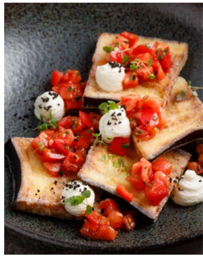
ХРУСТЯЩИЕ БАКЛАЖАНЫ С КРЕМОМ ИЗ СУЛГУНИ 489 ₺ CRISPY EGGPLANTS WITH SULGUNI CREAM 苏尔古尼香脆茄子