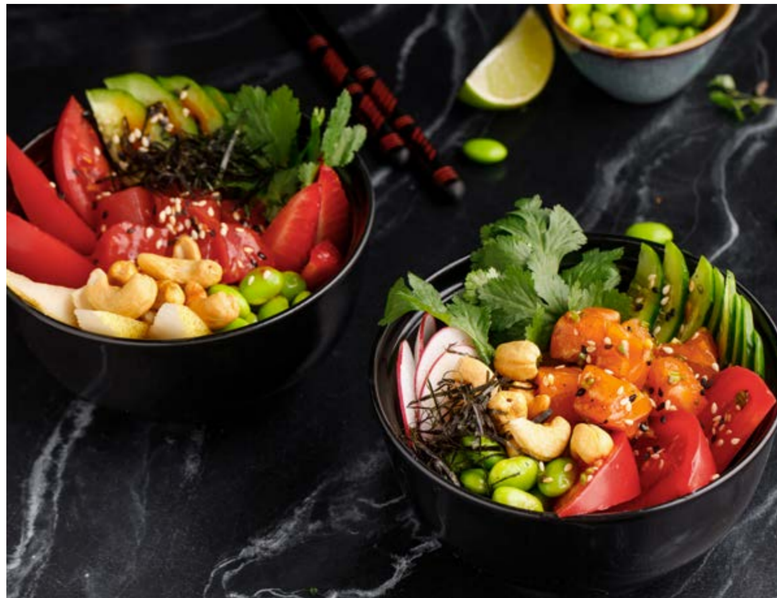
ПОКЕ С ТУНЦОМ / С ЛОСОСЕМ