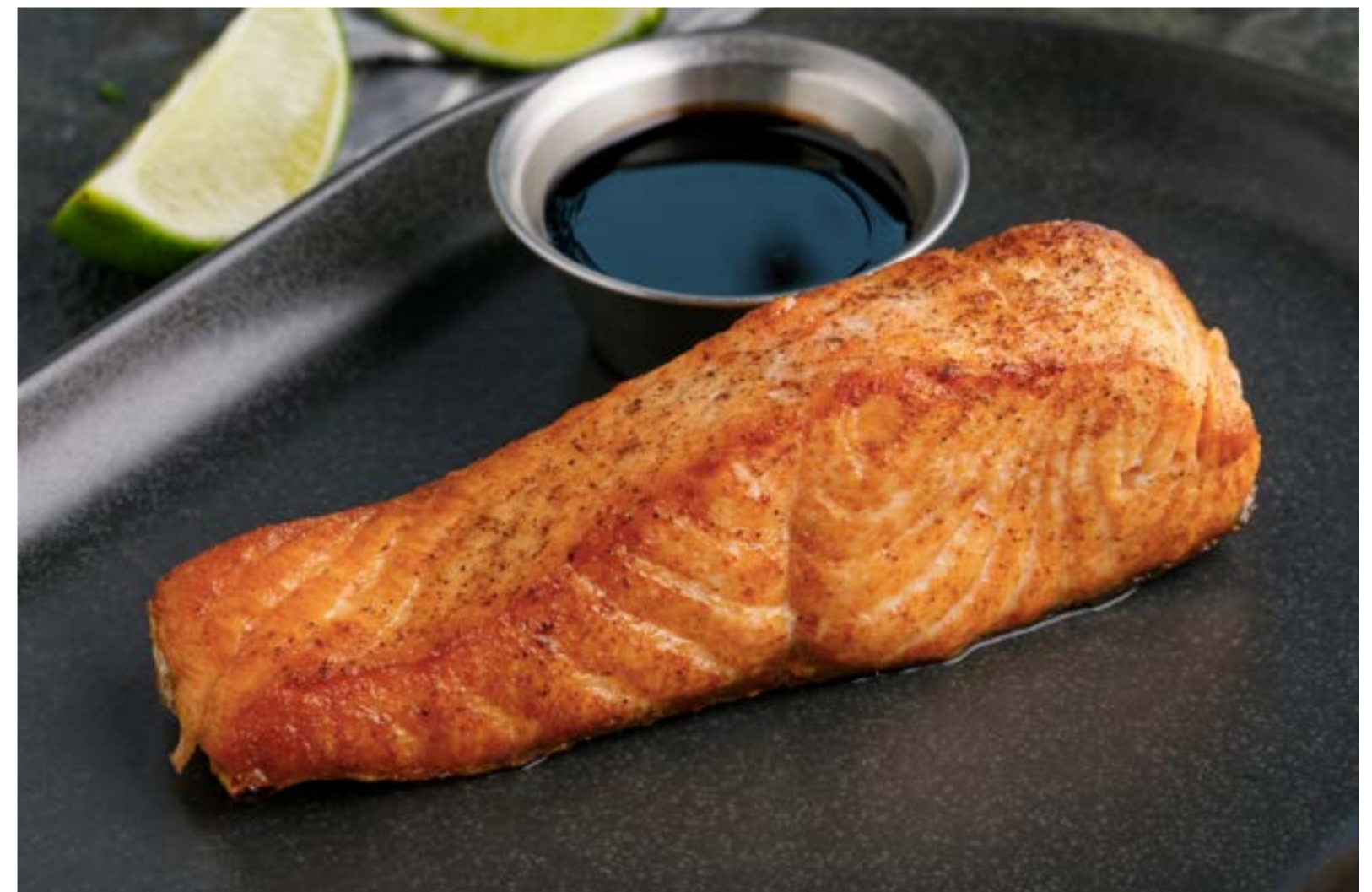
ЛОСОСЬ НА УГЛЯХ С СОУСОМ НАРШАРАБ 1489₽ SALMON WITH NARSARAB SAUCE / 三文鱼鱼块配石榴汁酱

Просьба предупредить вашего официанта об имеющейся у вас аллергии на определенные продукты питания. Все цены указаны в рублях. На фото использованы элементы декора. Please, tell your waiter if you have any food allergy to certain products. All prices are in rubles. The pictures have decorative elements. 请通知您的服务员。所有价格为卢布价。