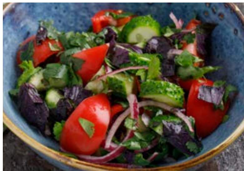
ОВОЩНОЙ САЛАТ СО СПЕЦИЯМИ ПО-ГРУЗИНСКИ 429 ₺ VEGETABLE SALAD WITH SPICES A LA GEORGIA 格鲁吉亚香料蔬菜沙拉