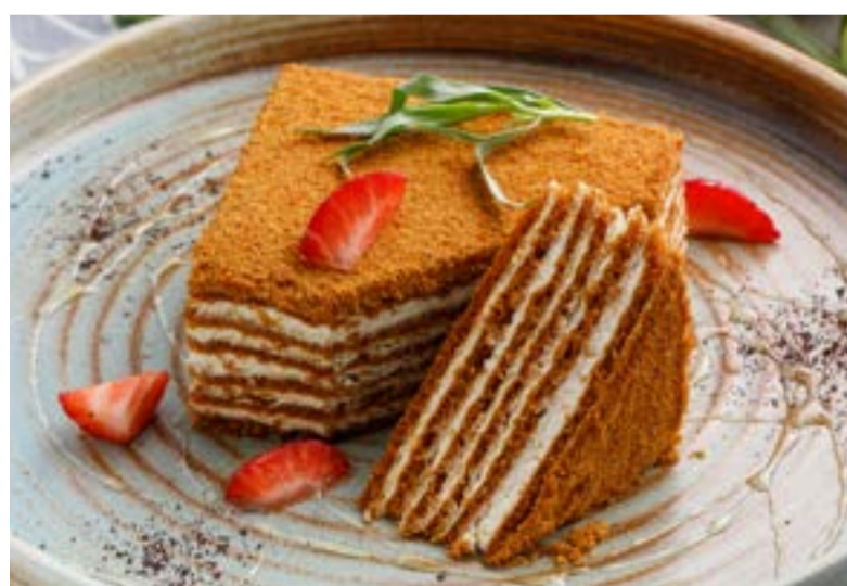
«МЕДОВИК» 489 ₺ HONEY CAKE / 蜂蜜蛋糕