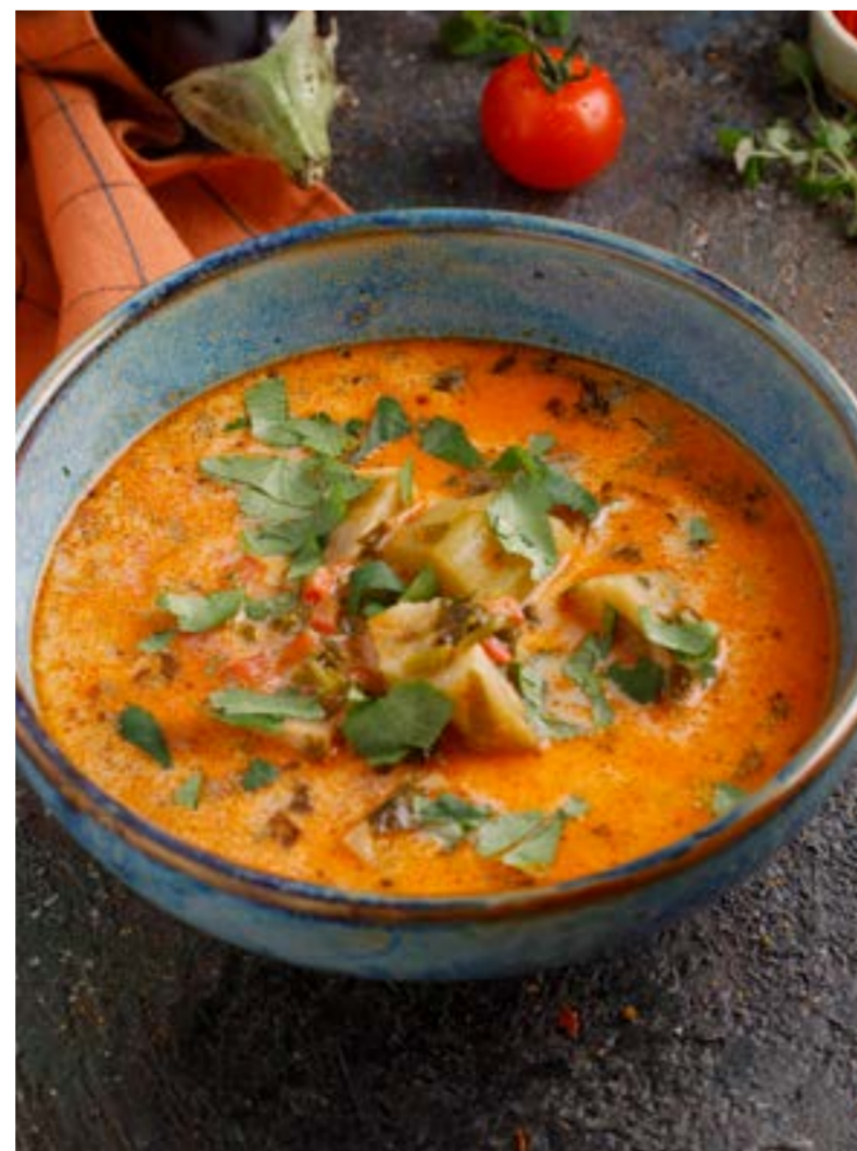
СУП ИЗ БАКЛАЖАНОВ

HOMEMADE NOODLES SOUP WITH CHICKEN / CHICKEN AND MUSHROOMS | 鸡肉/鸡肉蘑菇家常面汤