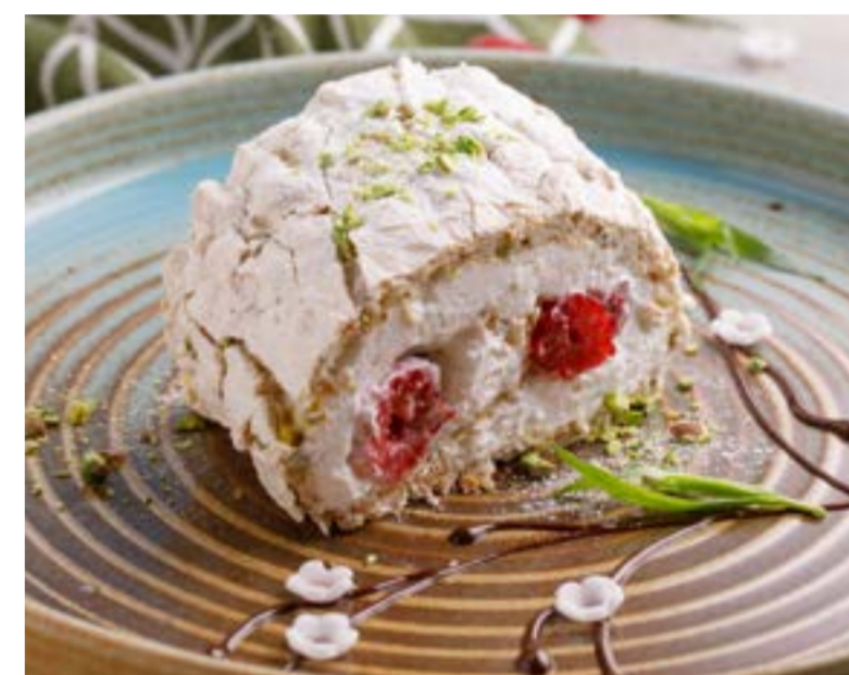
ФИСТАШКОВЫЙ РУЛЕТ С МАЛИНОЙ 589 ₺

PISTACHIO ROLL WITH RASPBERRY / 开心果复盆子甜馅卷