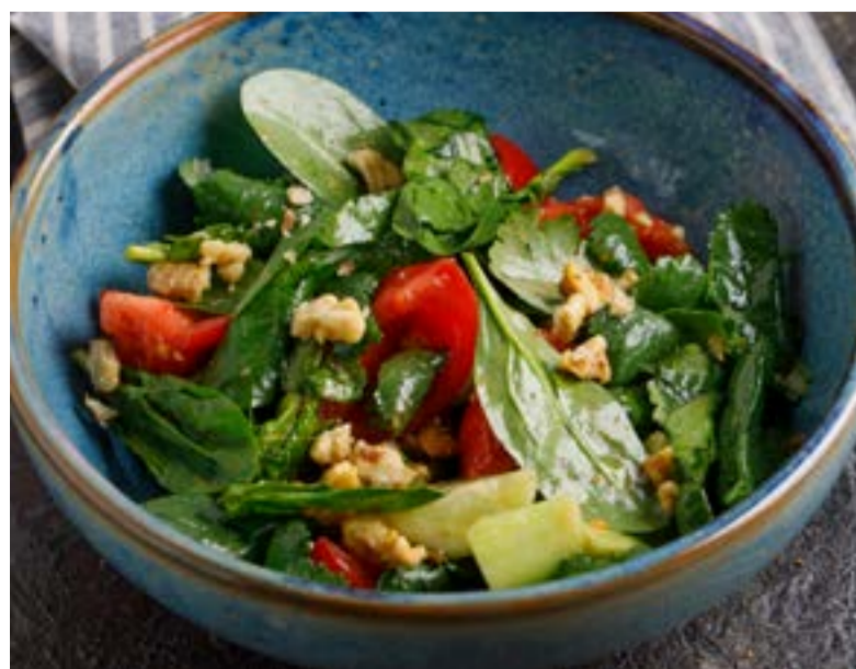
САЛАТ С КАХЕТИНСКИМ МАСЛОМ 529 ₺ SALAD WITH KAKHETI BUTTER / 卡赫季地区葵花油沙拉