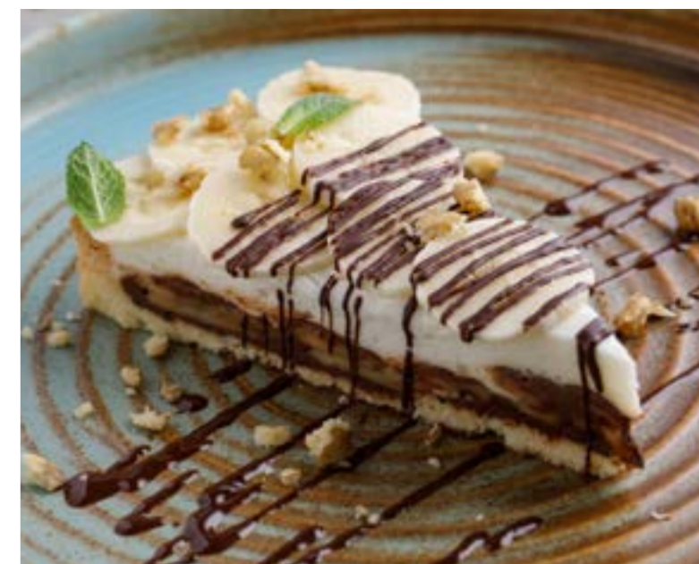
БАНАНОВЫЙ ТОРТ 449 ₺