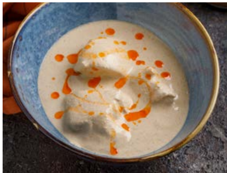
САЦИВИ ИЗ КУРИНОГО БЕДРА 489 ₺ CHICKEN THIGH SATSIVI / “萨措维” 炖鸡大腿