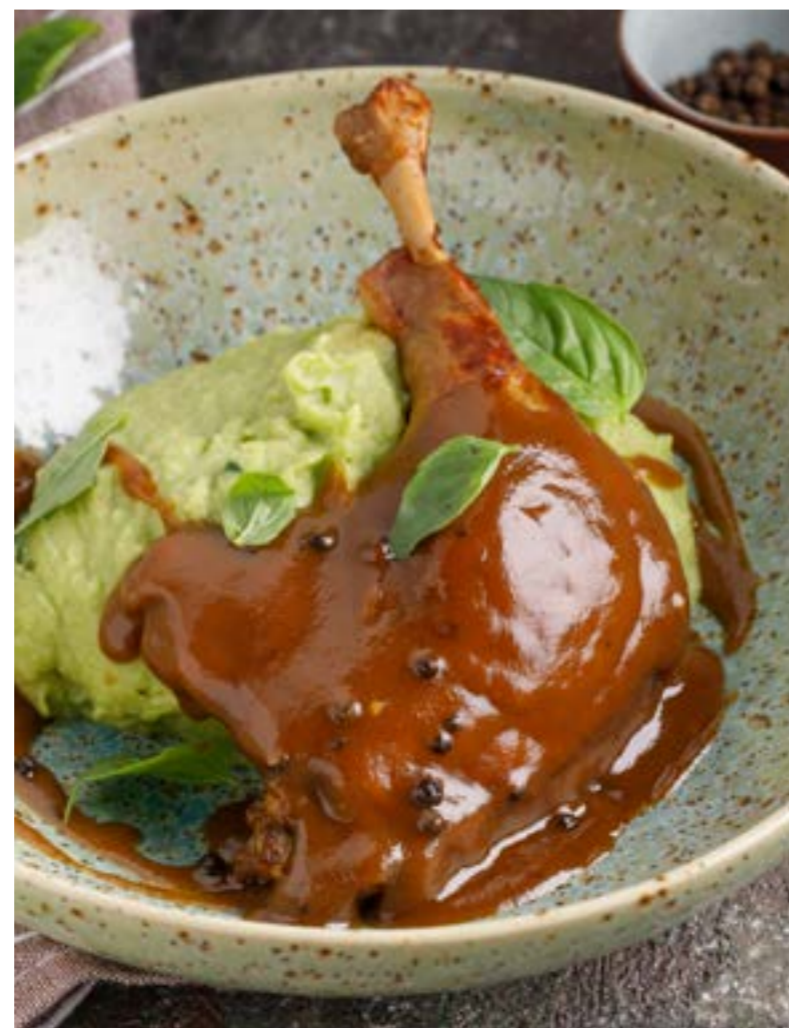
КОТЛЕТЫ ИЗ ИНДЕЙКИ С ОВОЩАМИ 739 ₺ TURKEY CUTLETS WITH VEGETABLES / 火鸡肉饼配蔬菜