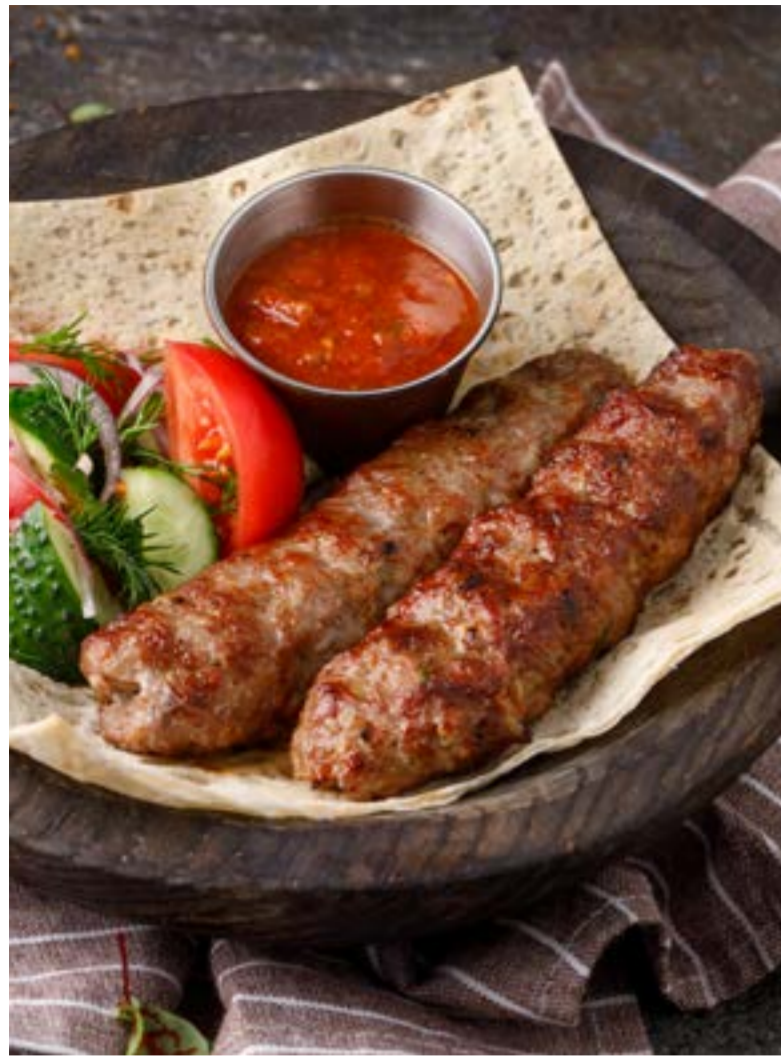
ЛЮЛЯ-КЕБАБ ИЗ ЯГНЕНКА 789₽ LAMB LULAH KEBAB / 碎羊羔肉烤串