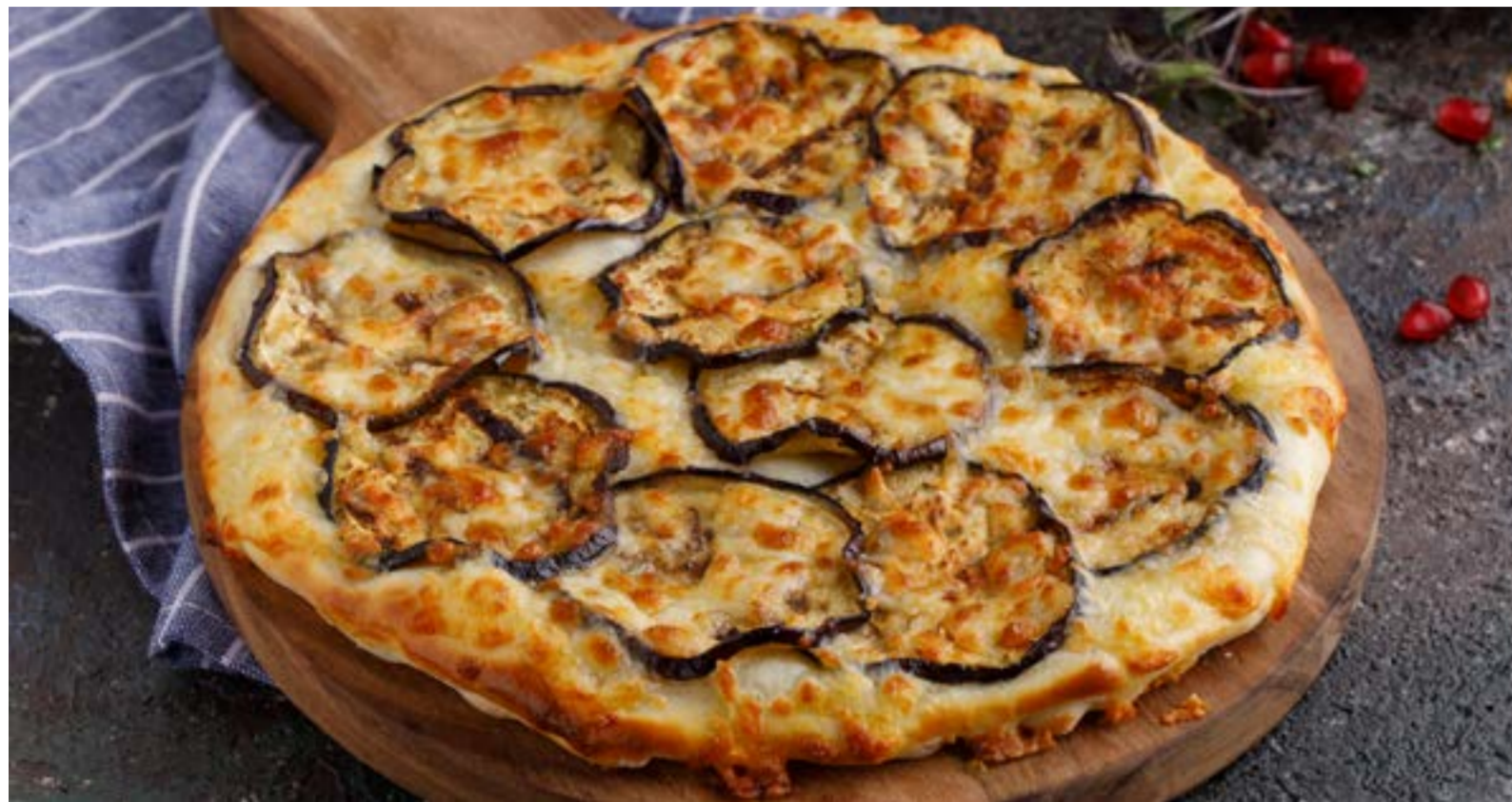
ХАЧАПУРИ С БАКЛАЖАНАМИ