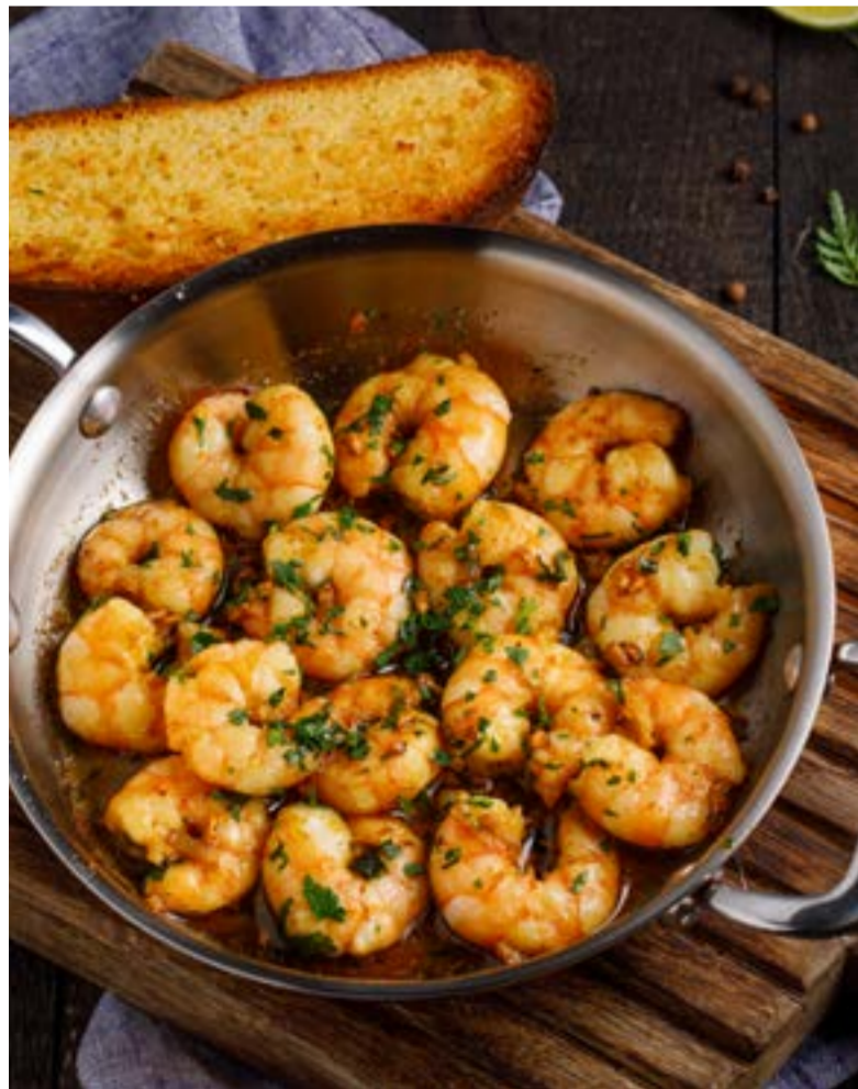
ЖАРЕННЫЕ КРЕВЕТКИ С ЧЕСНОКОМ И ГРУЗИНСКИМИ СПЕЦИЯМИ 1389 ₺ FRIED SHRIMPS WITH GARLIC AND GEORGIAN SPICES / 大蒜和格鲁吉亚香料炒虾