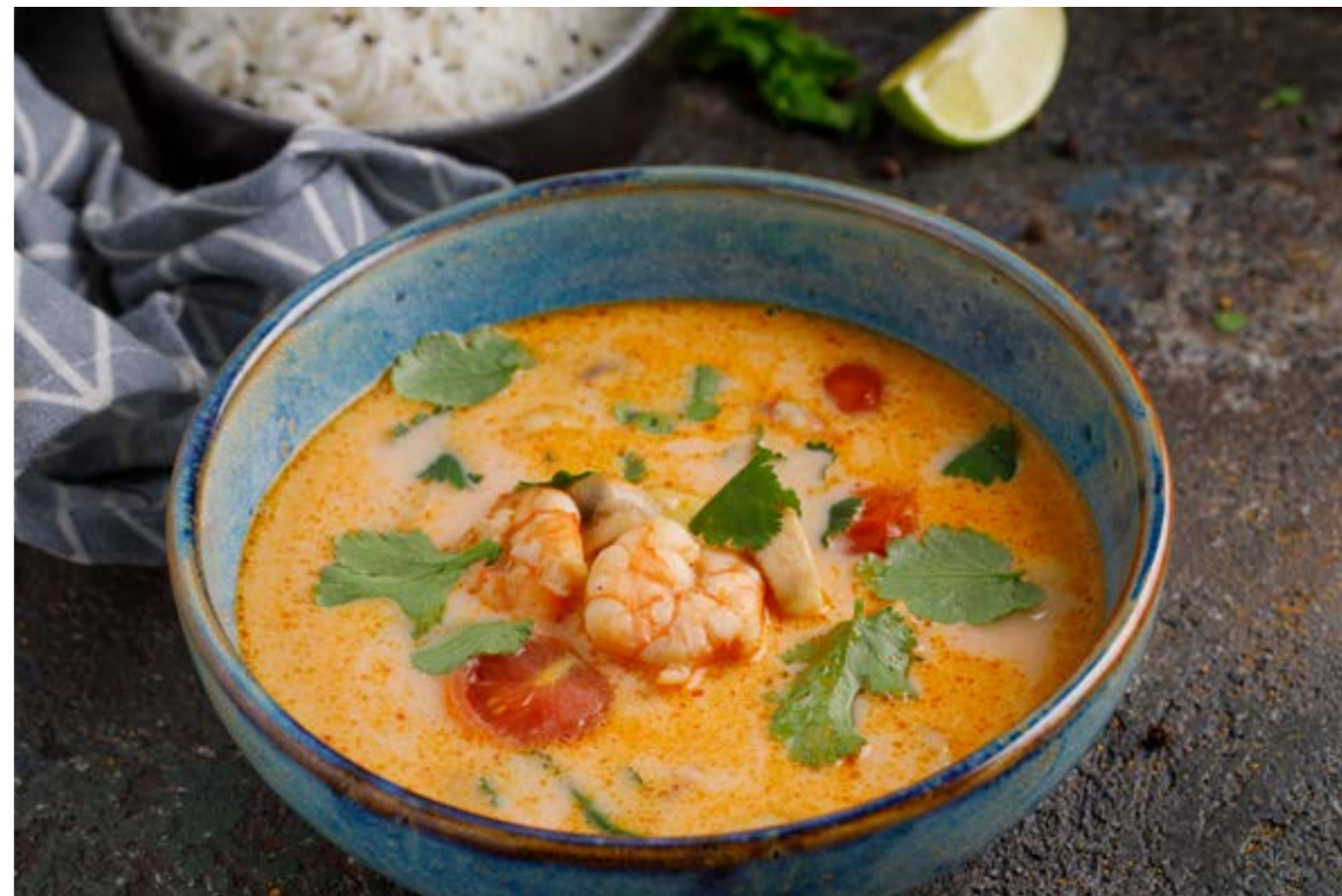
«ТОМ ЯМ» С КРЕВЕТКАМИ

BORSCH WITH BEEF, SOUR CREAM AND GARLIC PAMPUSHKAS / 牛肉罗宋汤配酸奶油和大蒜面饼