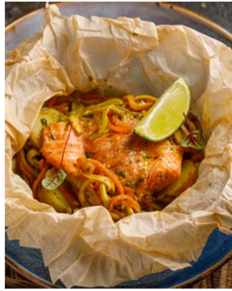
ФОРЕЛЬ С ОВОЩАМИ, ЗАПЕЧЕННАЯ В ПЕРГАМЕНТЕ 969 ₺ TROUT WITH VEGETABLES, BAKED IN PARCHMENT 吸油纸烤熟的三文鱼配蔬菜