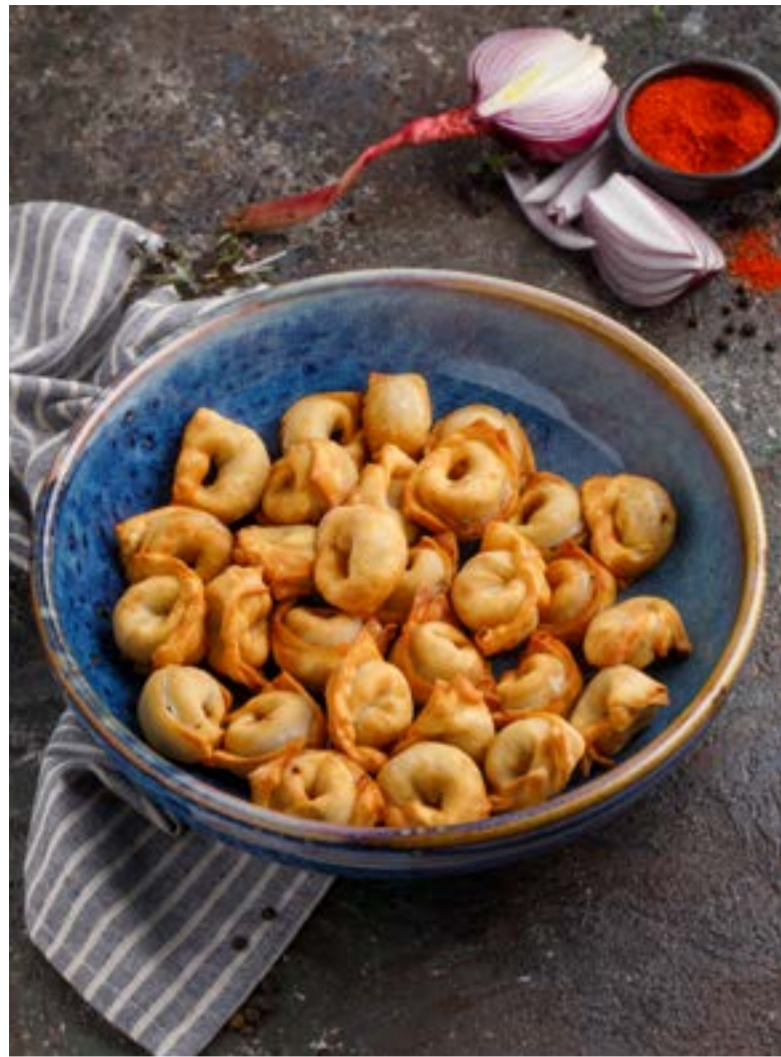
ЖАРЕНАЯ ЧУЧВАРА С МЯСОМ ЯГНЕНКА 529 ₹ FRIED CHUCHVARA WITH LAMB / 羊肉炒饺子