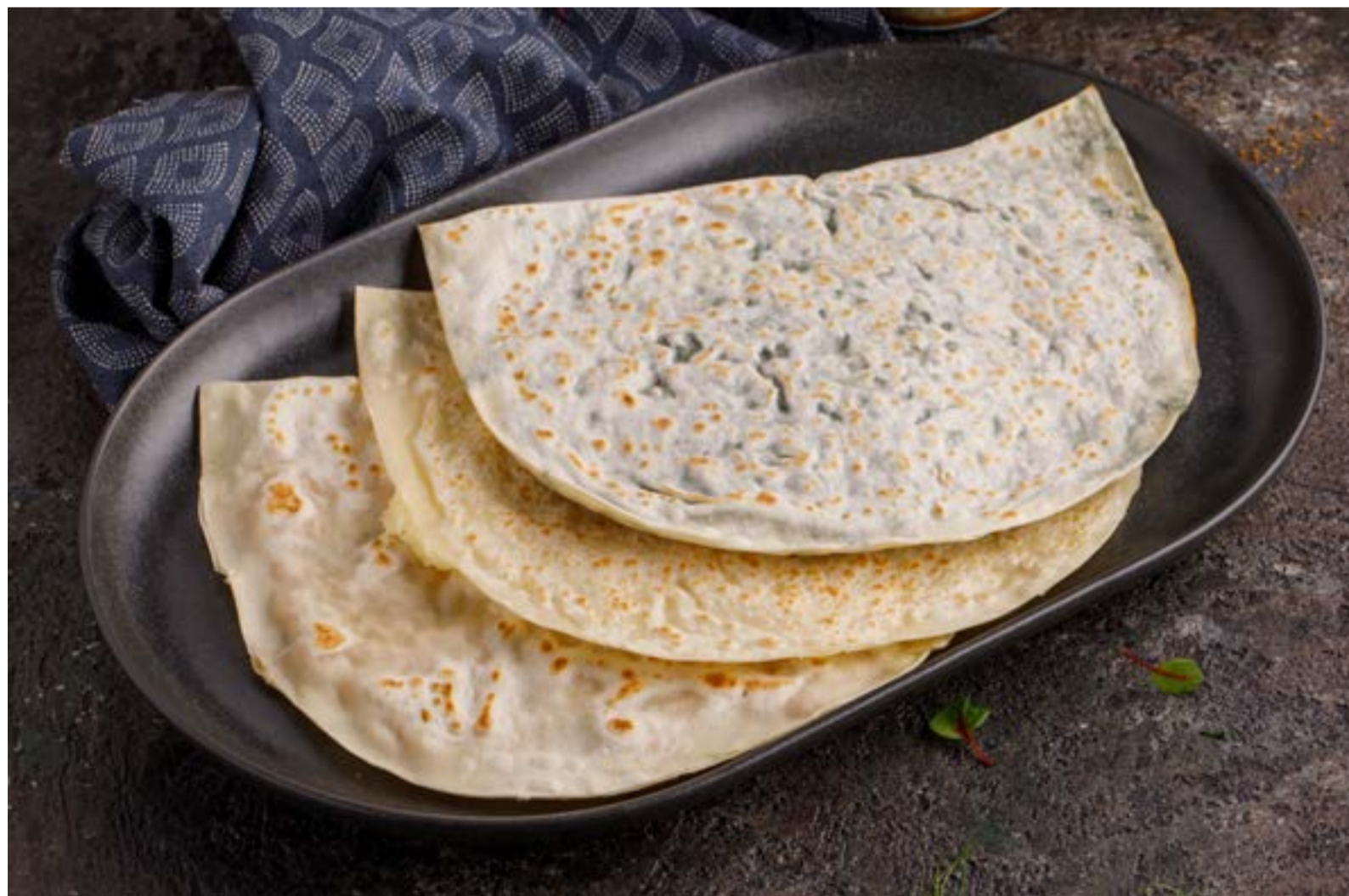
КУТАБЫ С КАРТОФЕЛЕМ / ЗЕЛЕНЬЮ / СЫРОМ / БАРАНИНОЙ 319/329/339/379 ₺ QUTABS WITH POTATOES / FRESH HERBS / CHEESE / LAMB | 土豆/草药/奶酪/羊肉/虾馅煎饼