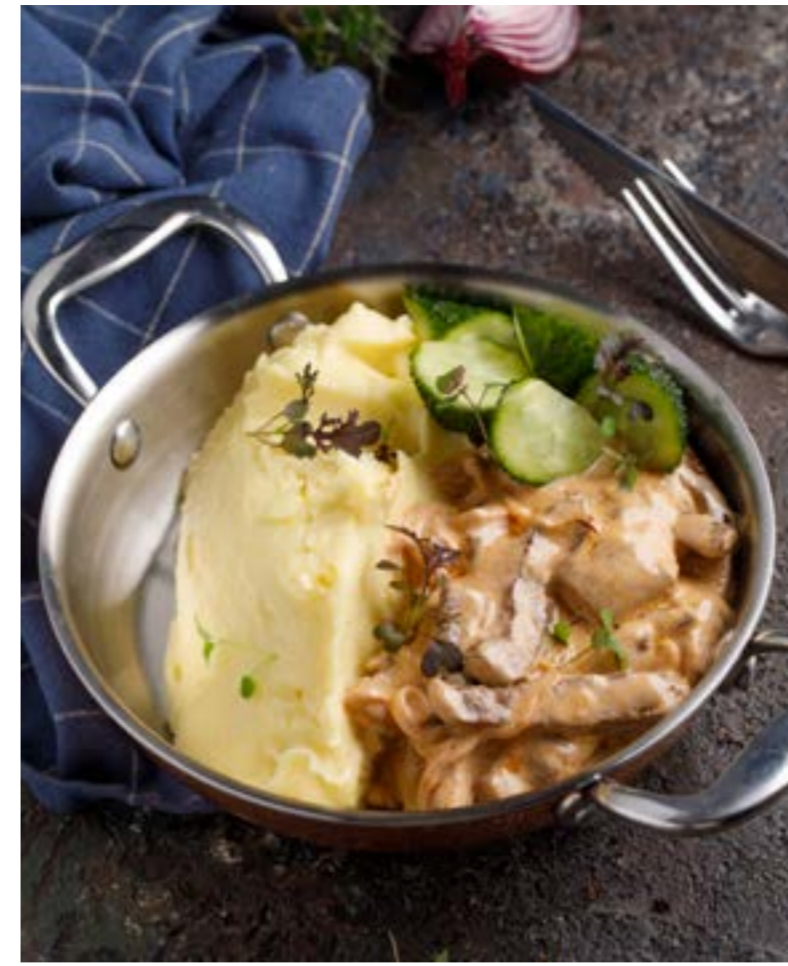
БЕФСТРОГАНОВ 829 ₺ с картофельным пюре и малосольным огурчиком BEEF STROGANOFF with mashed potatoes and half sour pickle 炒牛肉丝配土豆泥和盐渍黄瓜