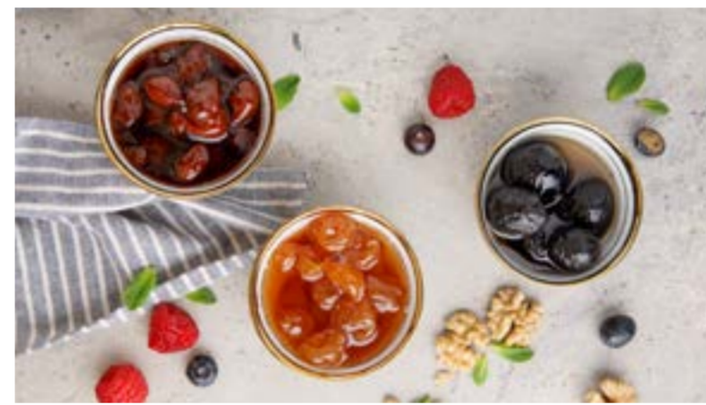
ДОМАШНЕЕ ВАРЕНЬЕ В АССОРТИМЕНТЕ 429 ₺ ASSORTED HOMEMADE JAM / 什锦家常果酱