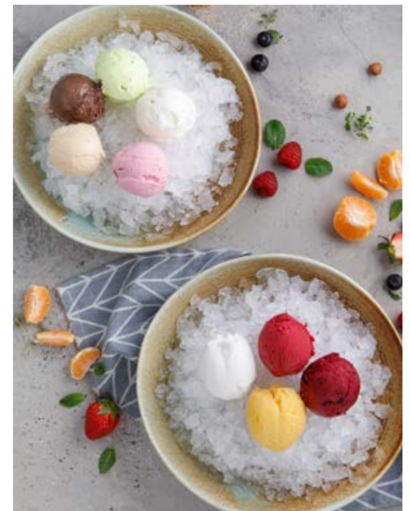
МОРОЖЕНОЕ / СОРБЕТЫ В АССОРТИМЕНТЕ 149 ₺ ICE CREAM / SORBET ASSORTMENT | 冰淇淋/果汁冰糕

Просьба предупредить вашего официанта об имеющейся у вас аллергии на определенные продукты питания. Все цены указаны в рублях. На фото использованы элементы декора. Please, tell your waiter if you have any food allergy to certain products. All prices are in rubles. The pictures have decorative elements. 所有价格为卢布价。