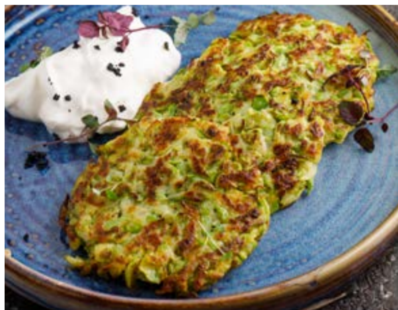
ОЛАДЫ ИЗ КАБАЧКОВ СО СМЕТАНОЙ 339 ₺ ZUCCHINI PANCAKES WITH SOUR CREAM 西葫芦煎饼配酸奶油