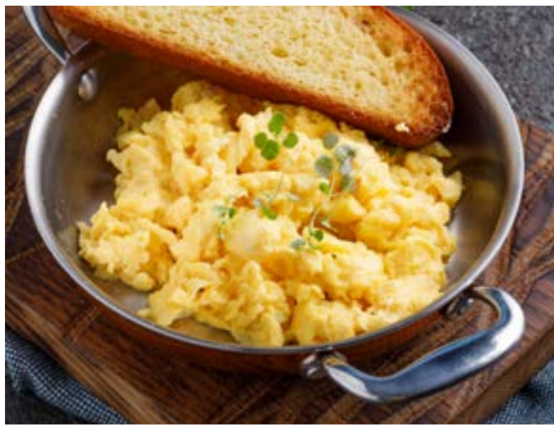
СКРЭМБЛ / ОМЛЕТ 219 ₺ SCRAMBLE / OMELET | 炒蛋/煎蛋饼