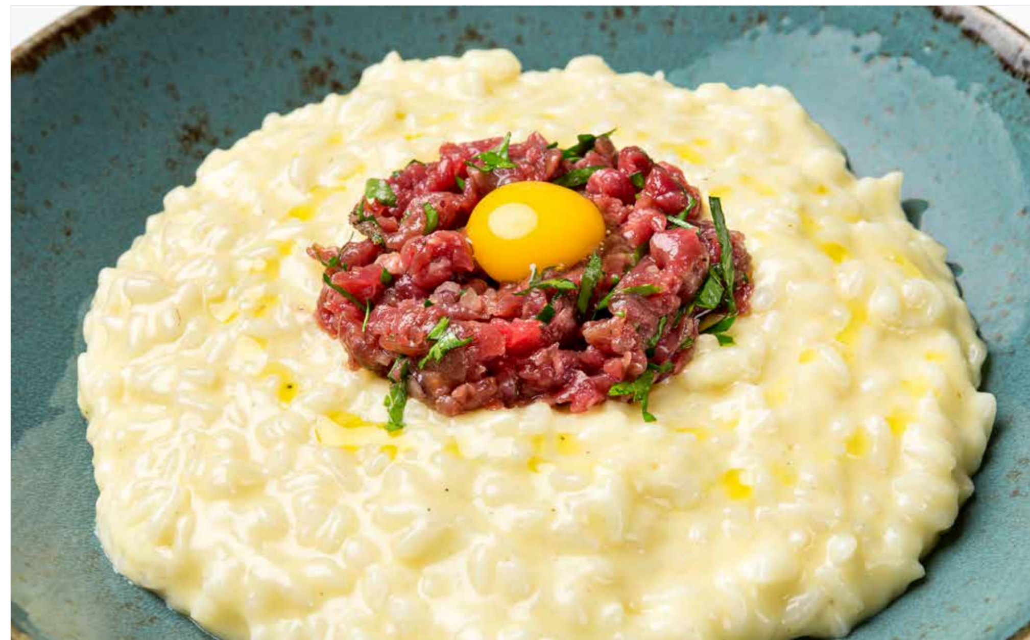
РИЗОТТО С ТАРТАРОМ ИЗ ГОВЯДИНЫ Risotto with beef tartare 牛肉塔塔意大利米饭