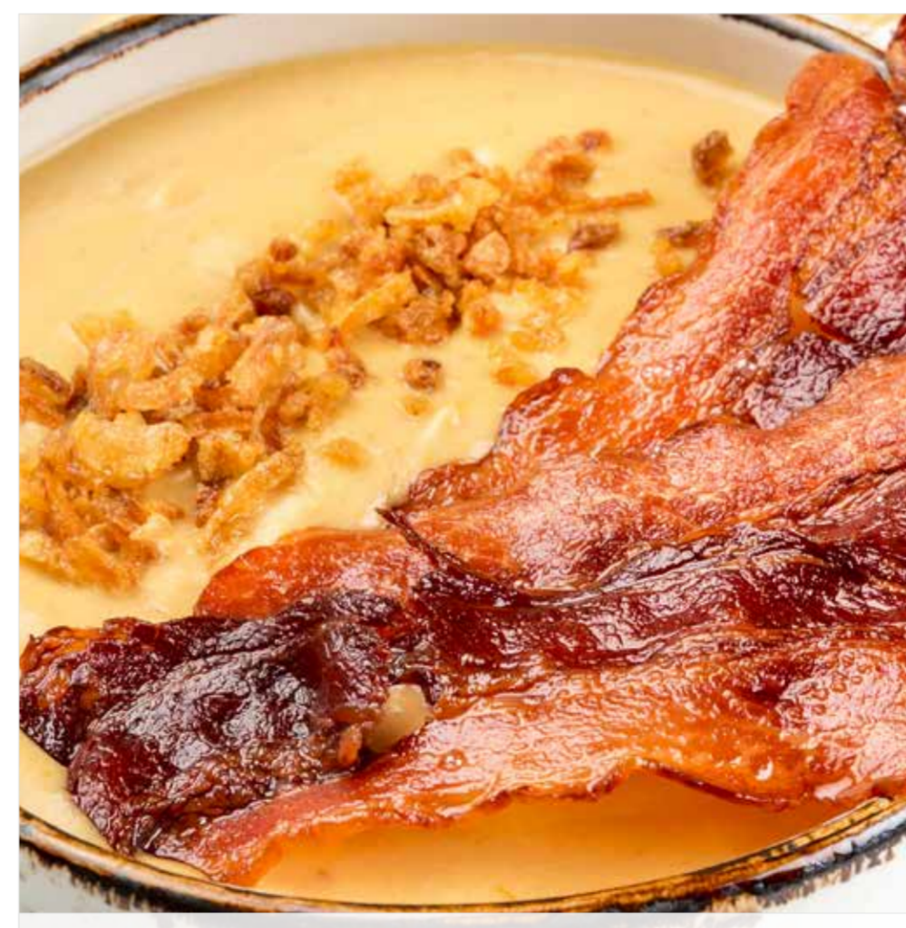
СЫРНЫЙ СУП Cheese soup 奶酪糖