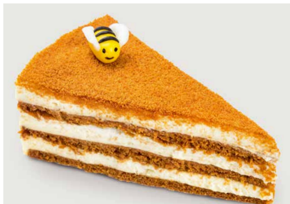
МЕДОВИК ОТ ШЕФ-ПОВАРА