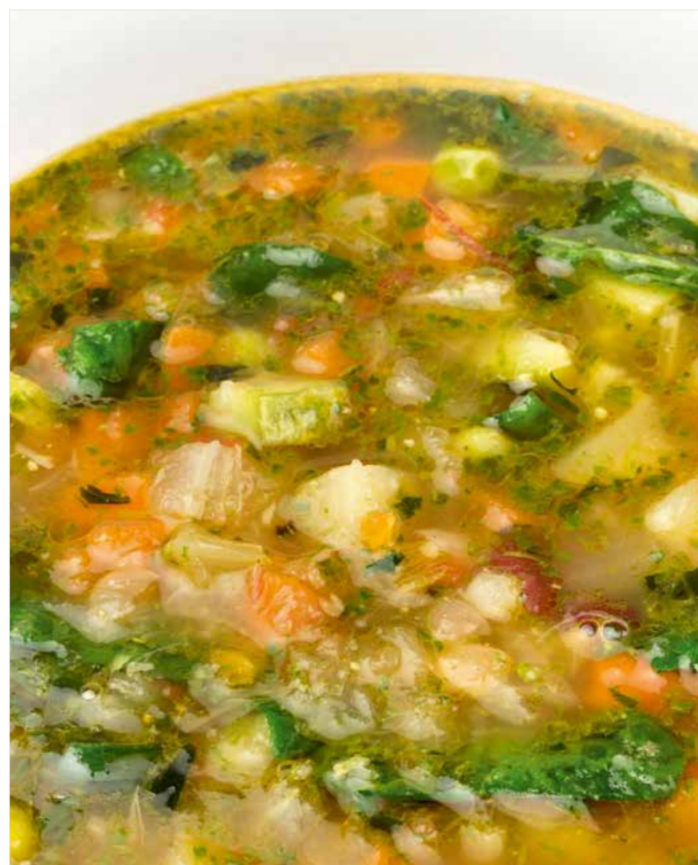
МИНЕСТРОНЕ Minestrone 意大利杂菜汤