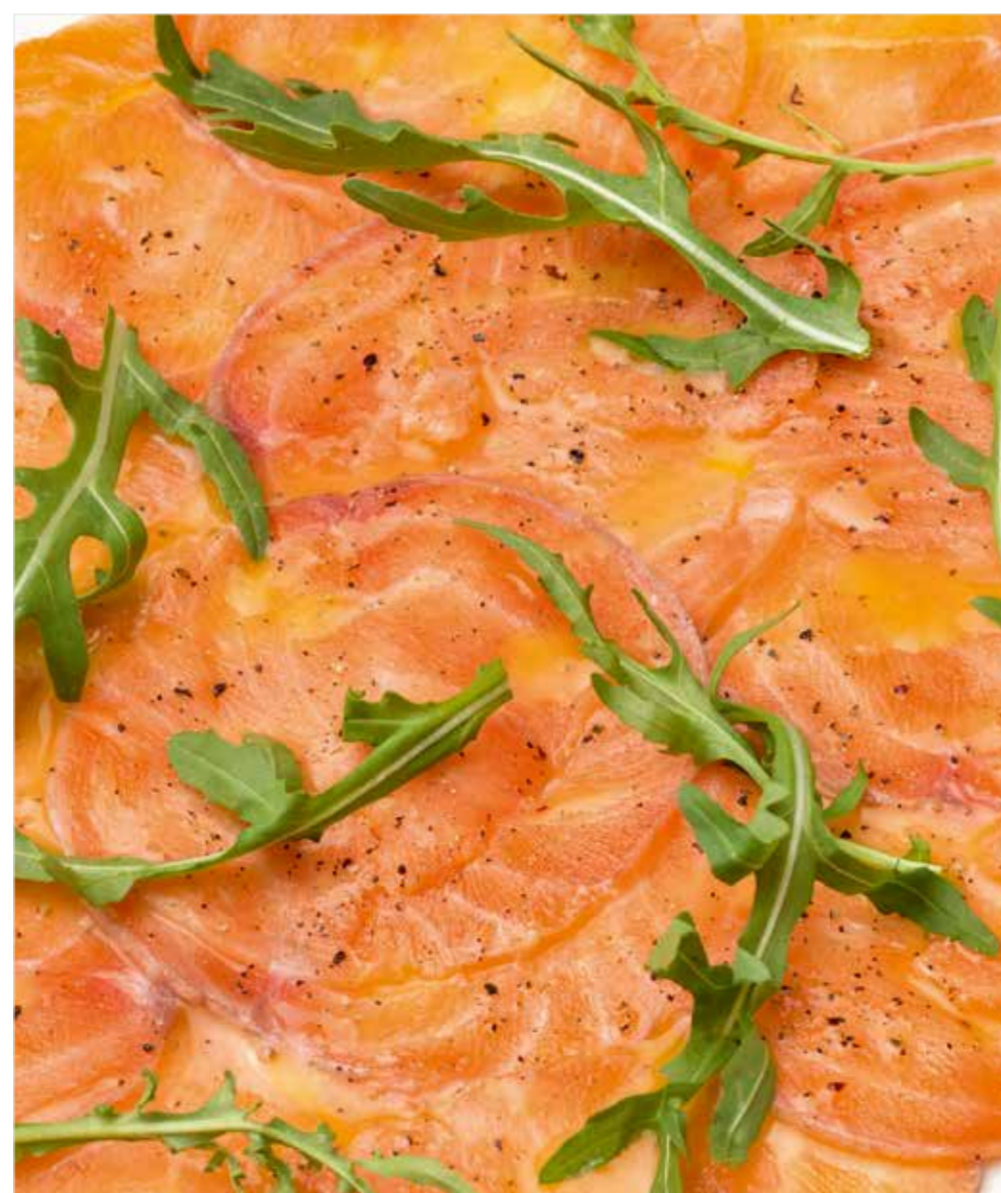
КАРПАЧО ИЗ ЛОСОСЯ Salmon carpaccio 三文鱼薄片