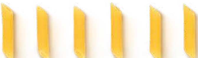
ПЕННЕ / PENNE / 直通粉