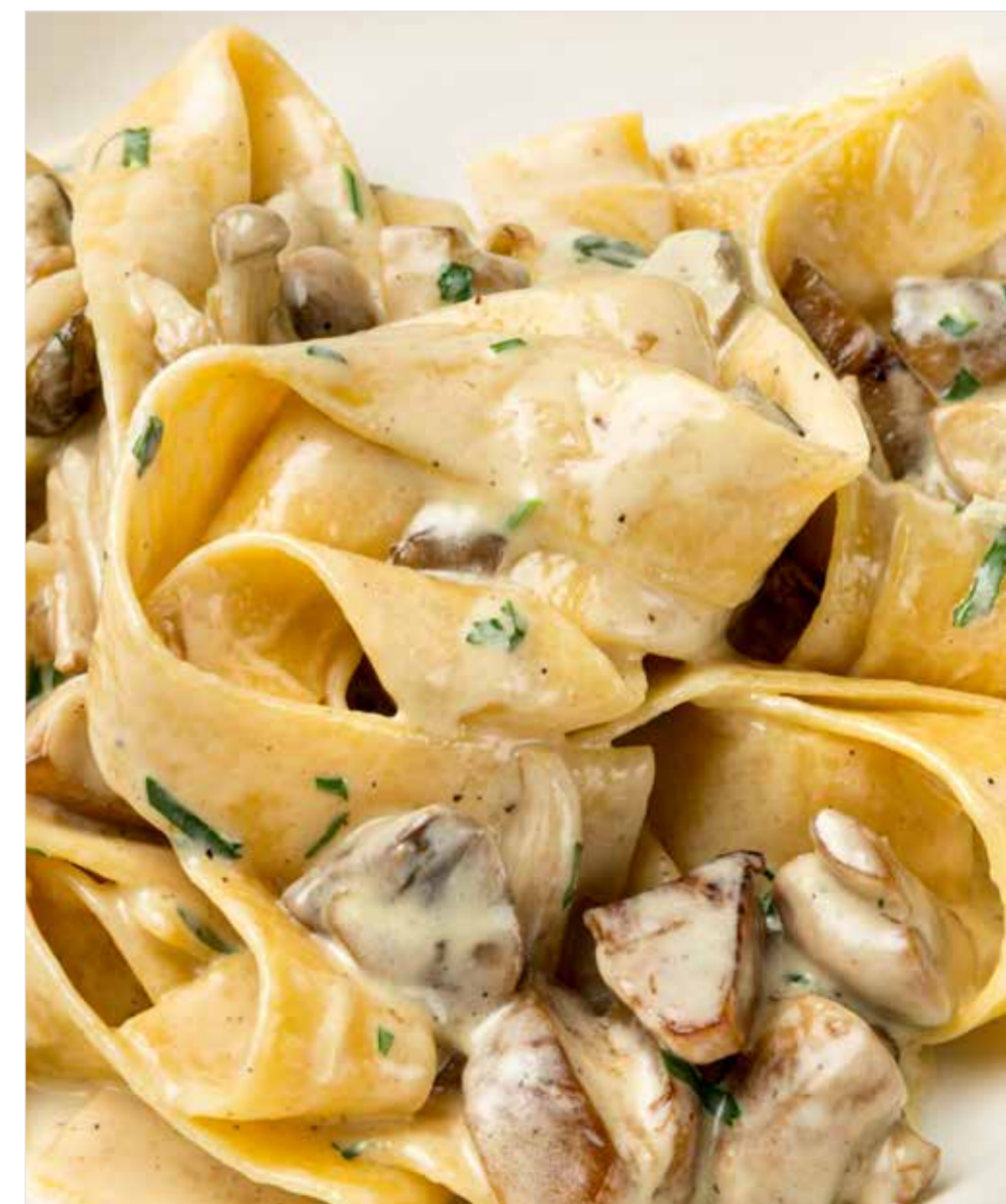
ПАППАРДЕЛЛЕ С ГРИБАМИ Pappardelle with mushrooms 蘑菇长通粉