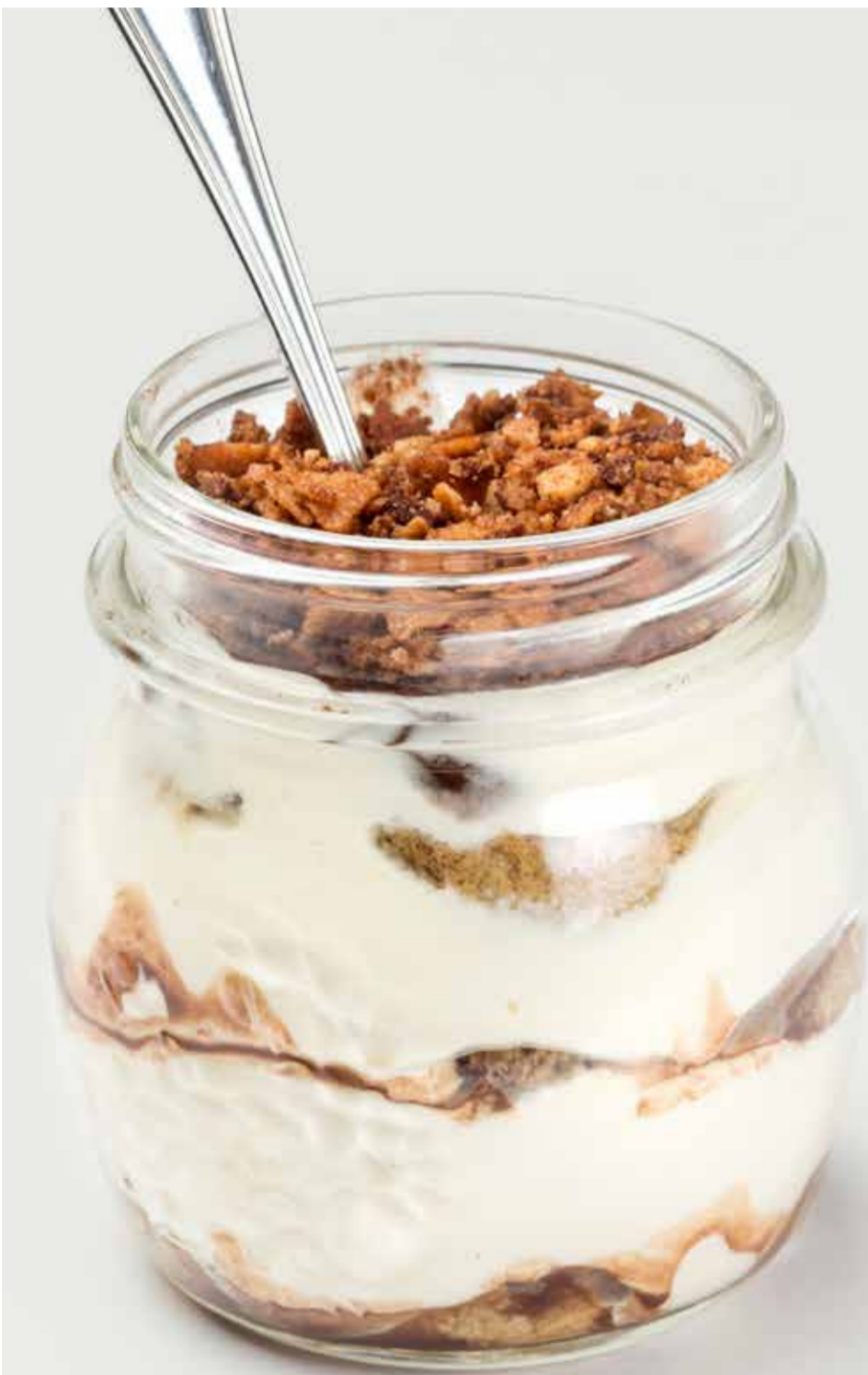
ТИРАМИСУ 460 Tiramisu 提拉米苏