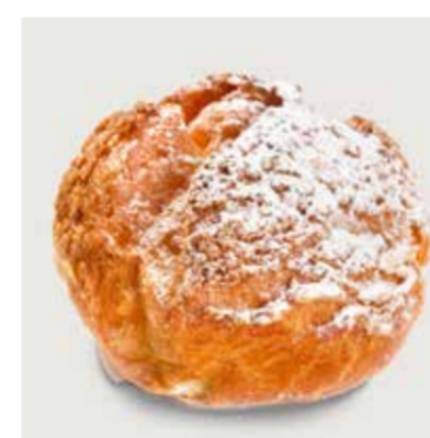
ЗАВАРНАЯ БУЛОЧКА С КРЕМОМ