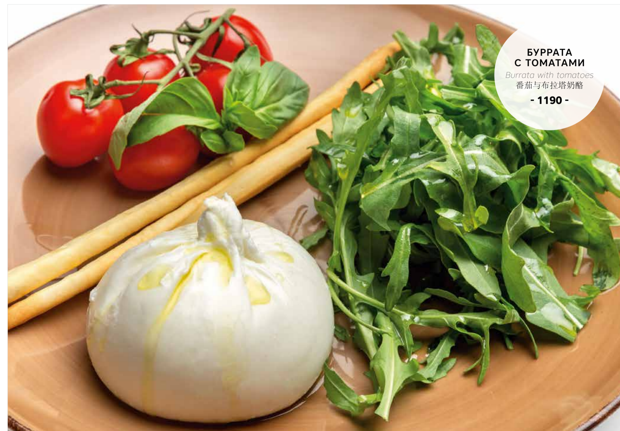
БУРРАТА С ТОМАТАМИ Burrata with tomatoes 番茄与布拉塔奶酪 - 1190 -