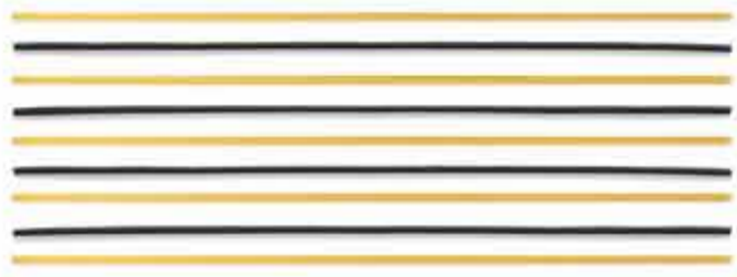
СПАГЕТТИ / SPAGHETTI / 长意粉