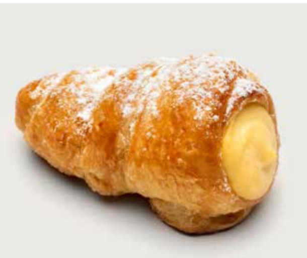
КАННОЛИ С ЗАВАРНЫМ КРЕМОМ ..... 110 Cannoli with custard 奶油甜馅酥皮卷