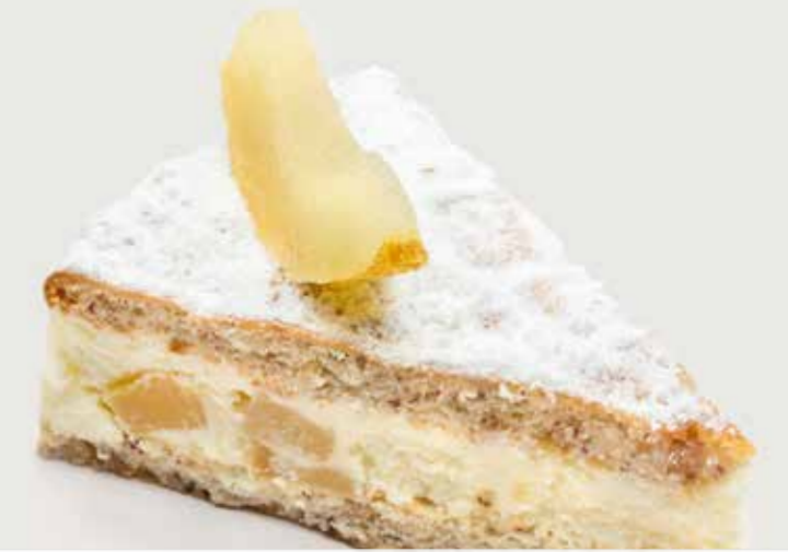
ТОРТ С РИКОТТОЙ И ГРУШЕЙ 360 Cake with ricotta and pear 利可塔奶酪梨蛋糕