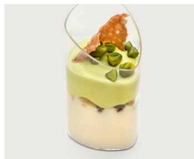
МАСКАРПОНЕ С КРЕМОМ ..... 190 Mascarpone with cream 马斯卡邦尼奶酪配奶油