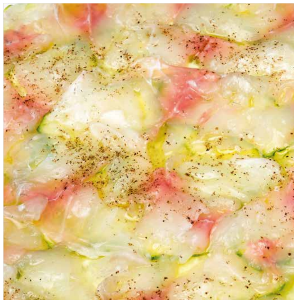
КАРПАЧО ИЗ ДОРАДО Dorado carpaccio 鲷鱼薄片