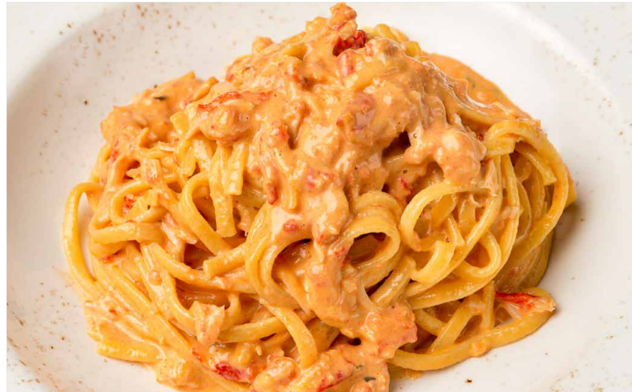
ТАЛЬОЛИНИ С КРАБОМ Tagliolini with crab 螃蟹意大利面