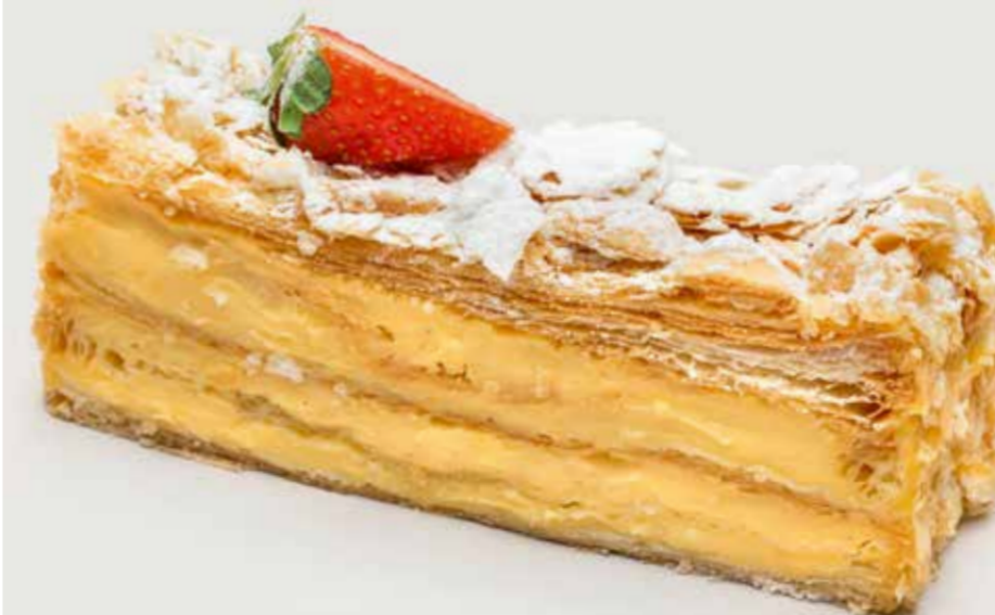
НАПОЛЕОН 390 Napoleon cake 拿破仑蛋糕