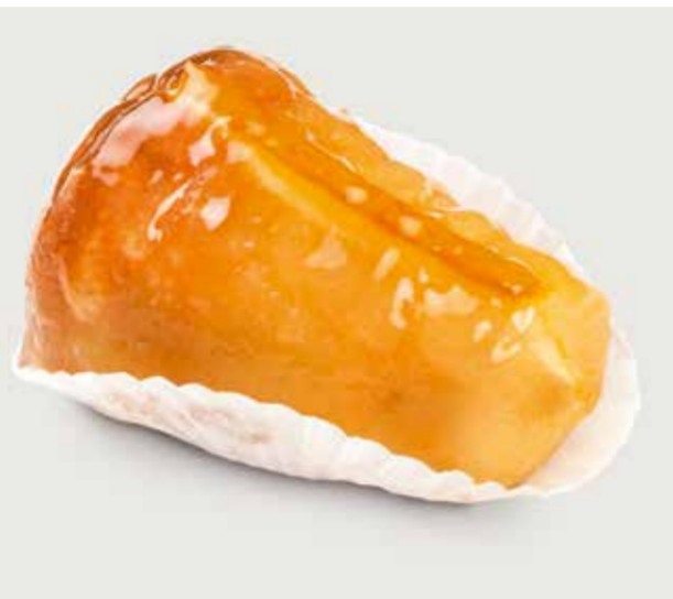
РОМОВАЯ БАБА ..... 120 Rum cake 朗姆酒蛋糕