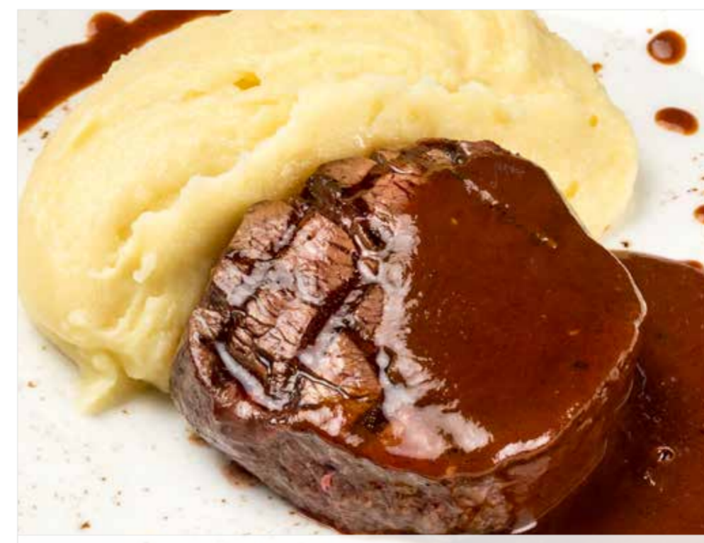
МЕДАЛЬОНЫ ИЗ ГОВЯДИНЫ С КАРТОФЕЛЬНЫМ ПЮРЕ И ТРЮФЕЛЬНЫМ СОУСОМ ..... 990 Beef medallions and mashed potatoes with truffle sauce 奖章牛排搭配土豆泥和松露酱