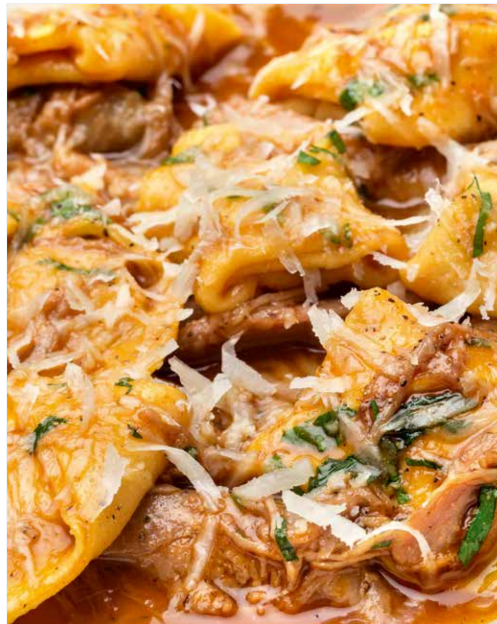
ТОРТЕЛЛИНИ С РАГУ ИЗ УТКИ И ТЫКВОЙ Tortellini with duck stew and pumpkin 鸭肉南瓜意大利馄饨