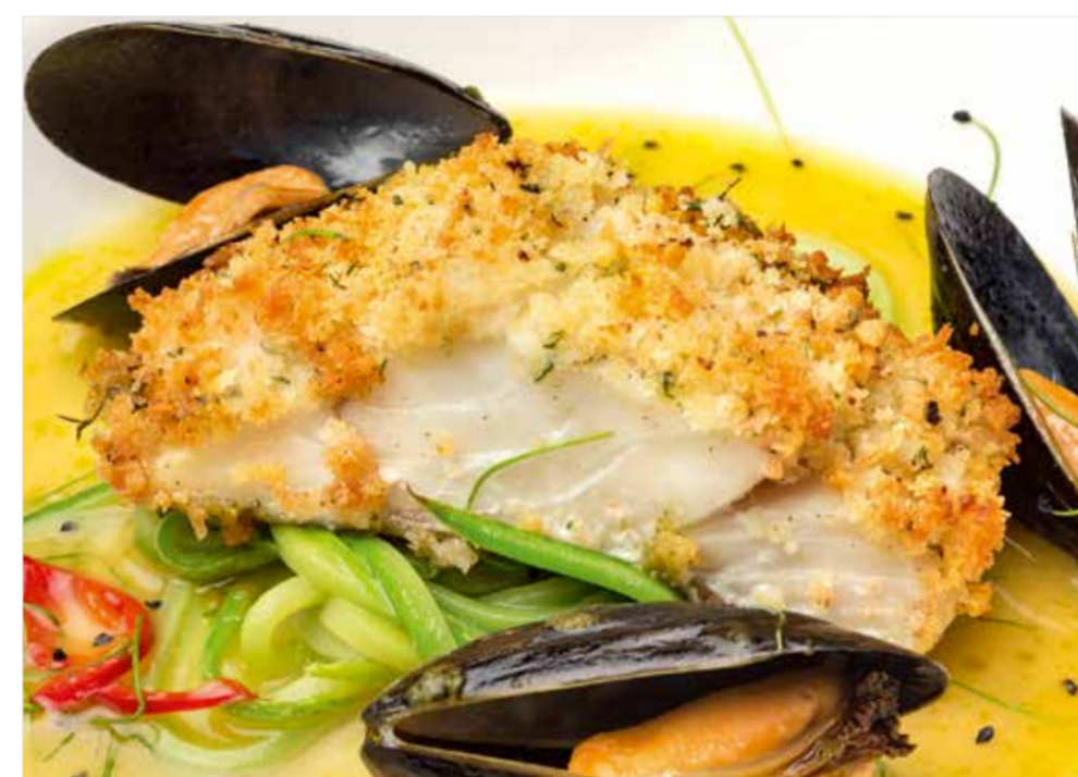
ЗАПЕЧЕННАЯ ТРЕСКА НА ПОДУШКЕ ИЗ ЦУККИНИ Baked cod on a bed of zucchini 意大利瓜烤鱼