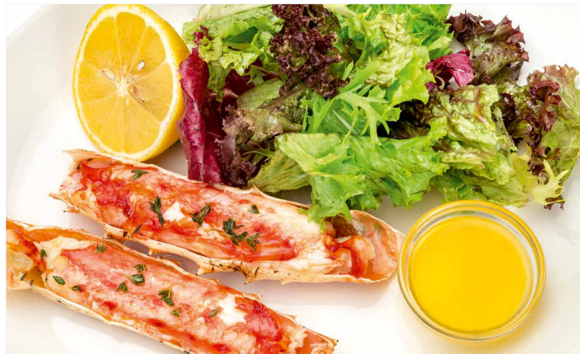
ЗАПЕЧЕННЫЕ ФАЛАНГИ КРАБА С ЛИСТОВЫМ САЛАТОМ (2 ШТ.) Baked crab phalanges with leaf lettuce (2 pcs) 烤蟹脚配莴苣叶 (2只)