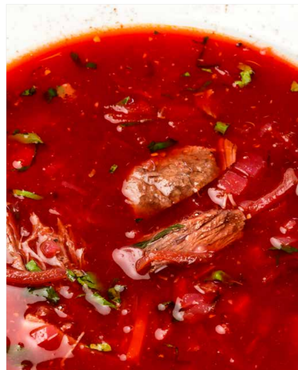
БОРЩ СО СМЕТАНОЙ Borscht with sour cream 红菜汤加酸奶油