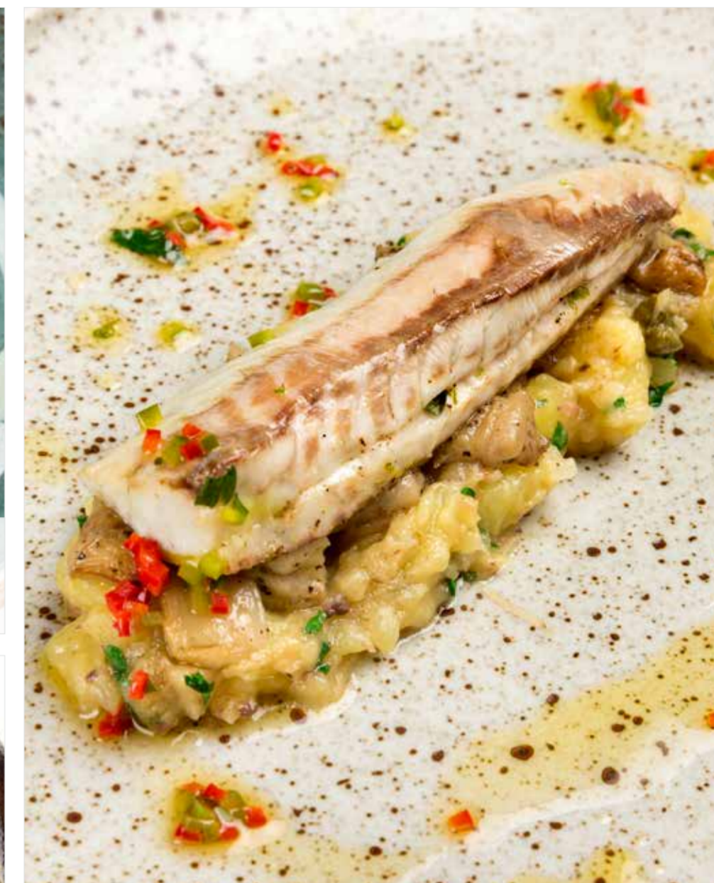
СИБАС С БАКЛАЖАНОМ И ПРЯНЫМ КАРТОФЕЛЕМ Sea bass with eggplant and spicy potatoes 欧洲鲈配茄子与香土豆