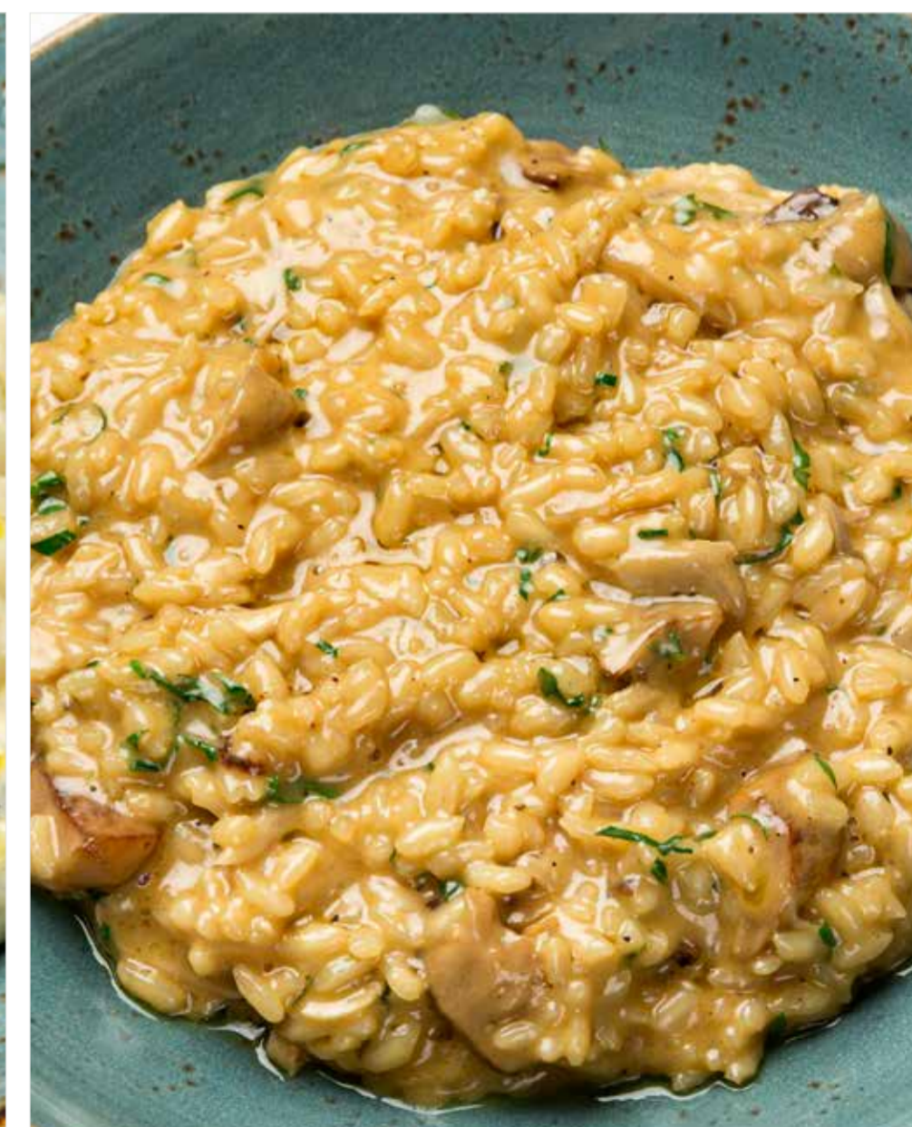
РИЗОТТО С ГРИБАМИ Risotto with mushrooms 蘑菇烩饭