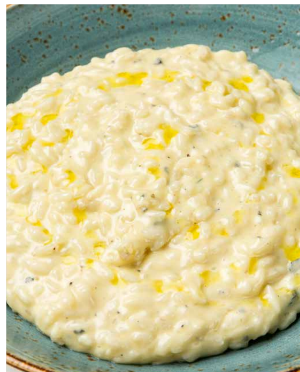
РИЗОТТО ЧЕТЫРЕ СЫРА Four cheese risotto 四种奶酪意大利米饭