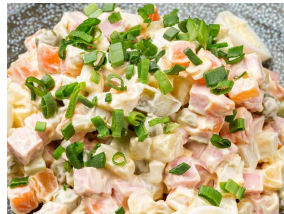
ОЛИВЬЕ ПО-ДОМАШНЕМУ С ЯЗЫКОМ / С КОЛБАСОЙ 390 Homemade Russian salad with beef tongue / with sausage 家常俄式沙拉加牛舌头 / 配香肠