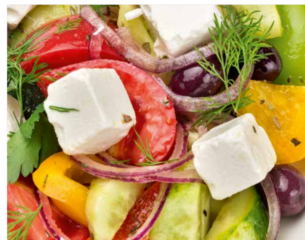
ГРЕЧЕСКИЙ 490 Greek salad 希腊沙律