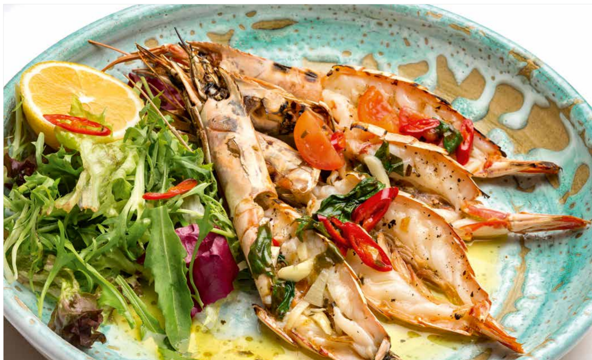
КРЕВЕТКИ ПО-КАТАЛОНСКИ Catalan style shrimps 加泰罗尼亚虾