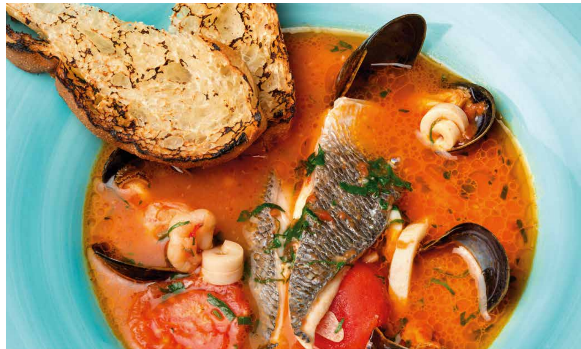
СУП С ДАРАМИ МОРЯ Seafood soup 海鲜汤