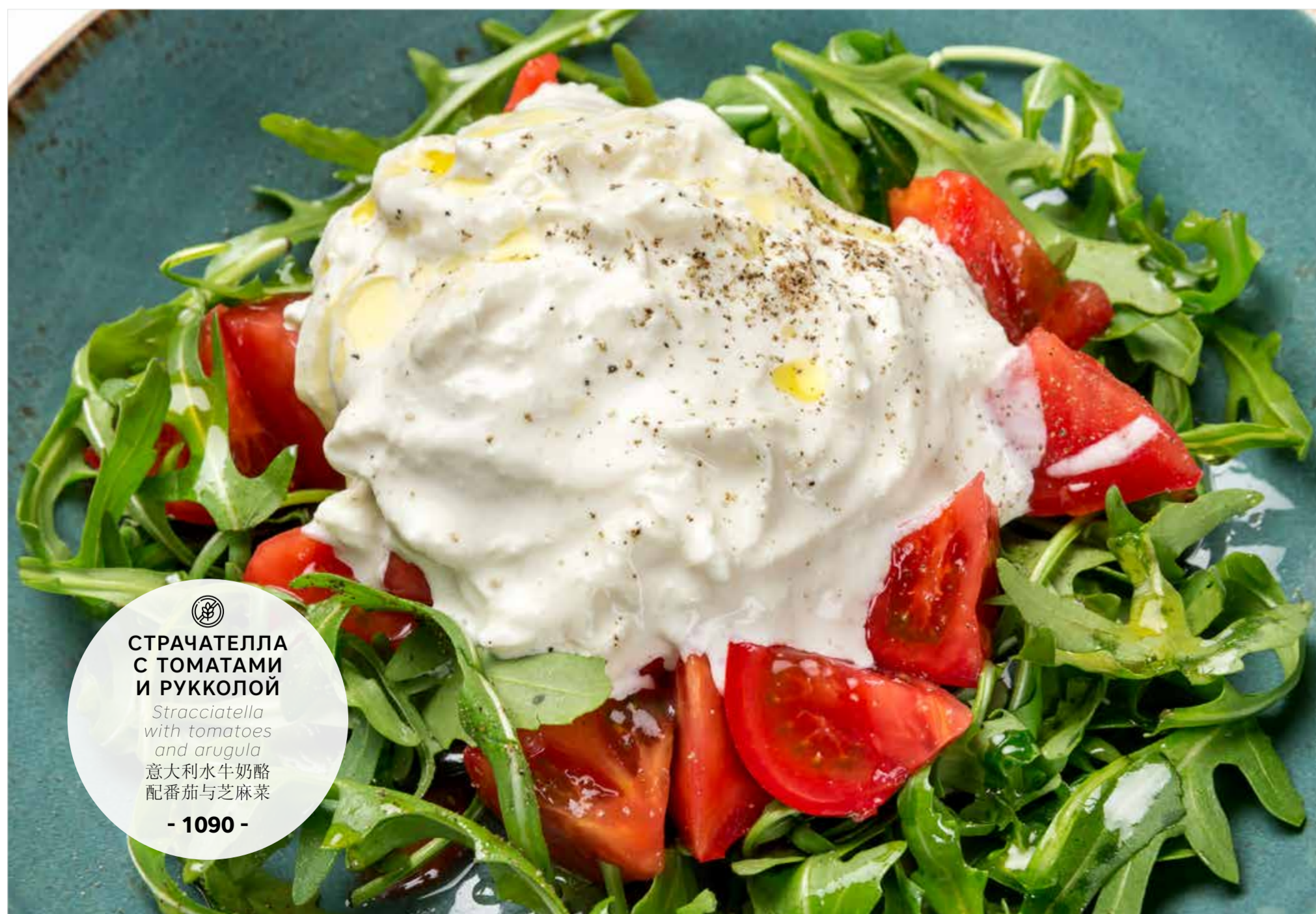
СТРАЧАТЕЛЛА С ТОМАТАМИ И РУККОЛОЙ Stracciatella with tomatoes and arugula 意大利水牛奶酪 配番茄与芝麻菜 - 1090 -