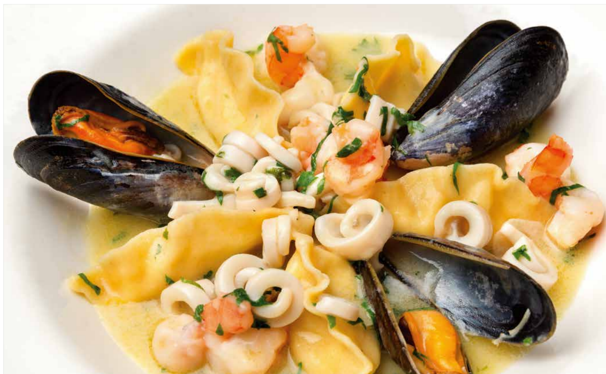
РАВИОЛИ С МОРЕПРОДУКТАМИ Ravioli with seafood 海鲜馄饨