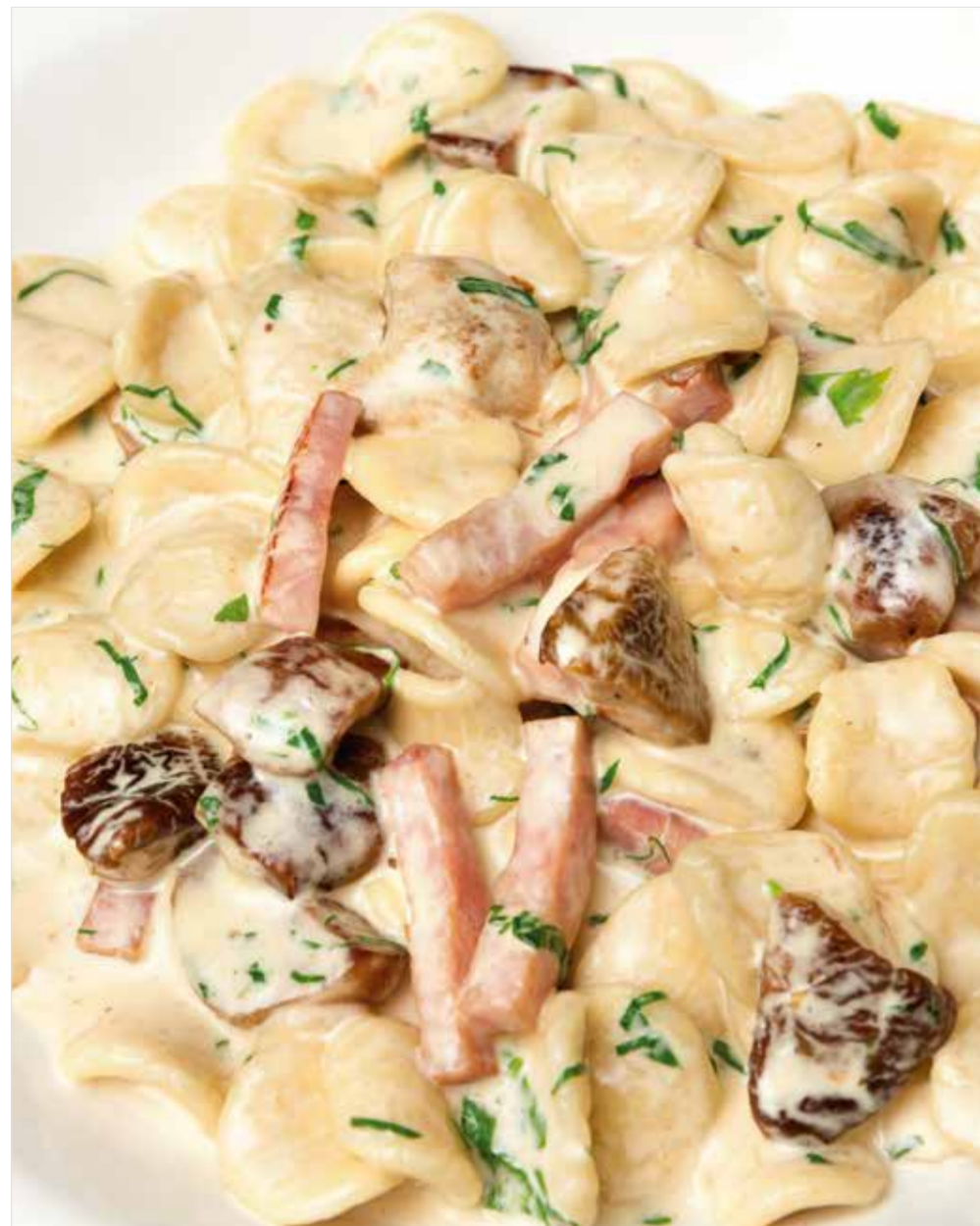
ОРЕКЬЕТТЕ С ВЕТЧИНОЙ И ГРИБАМИ Orecchiette with ham and mushrooms 火腿蘑菇蚧壳粉