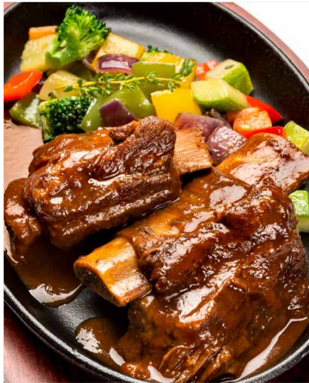
ГОВЯЖЬИ РЕБРА С ОВОЩНЫМ РАТАТУЕМ ..... 990 Beef ribs with vegetable ratatouille 普罗旺斯杂烩牛肋骨