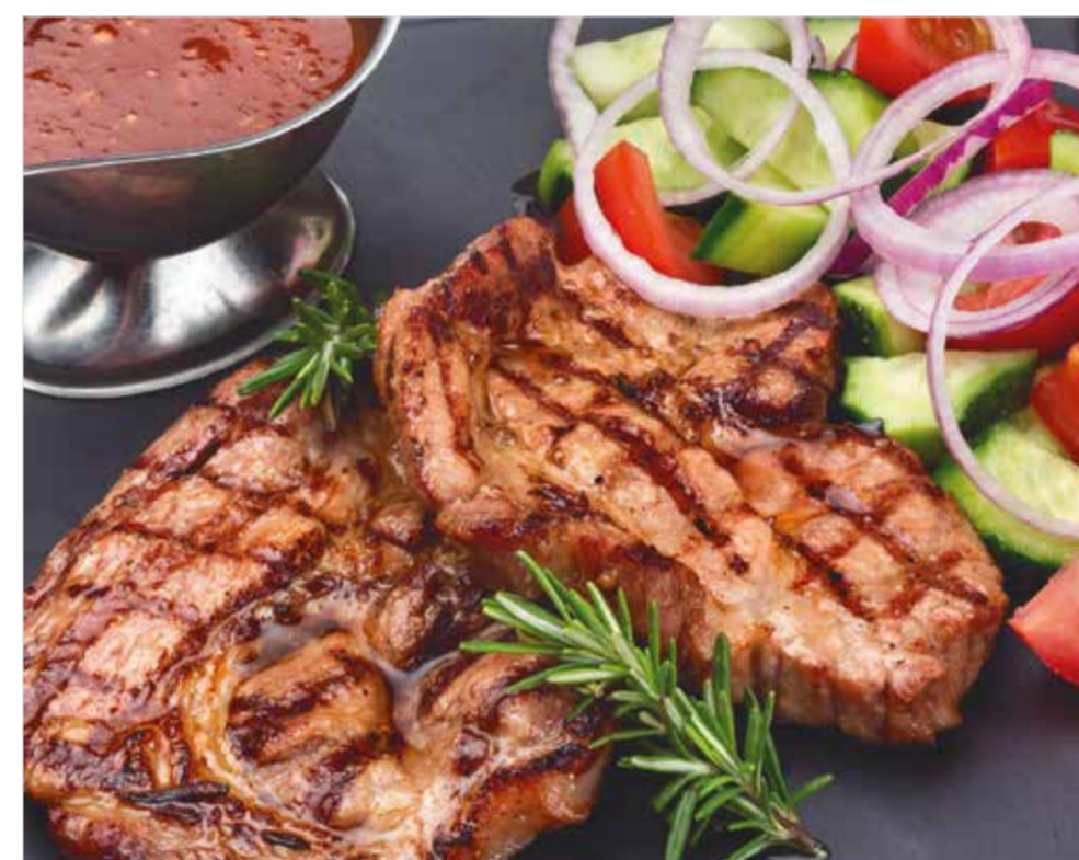
НЕЖНАЯ СВИНИНА, ПРИГОТОВЛЕННАЯ НА УГЛЯХ Charcoal roasted tender pork 炭烤嫩猪肉