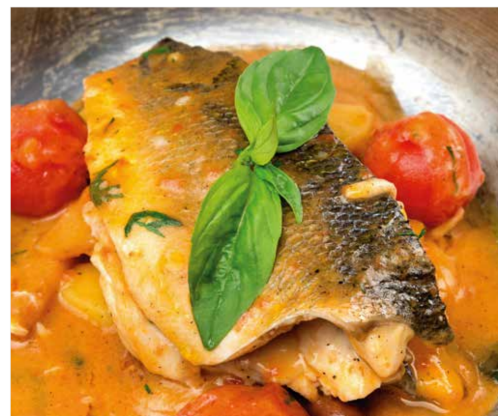
ФИЛЕ СИБАСА ПО-СИЦИЛИЙСКИ Sicilian style sea bass fillet 西西里黑鲈鱼扒