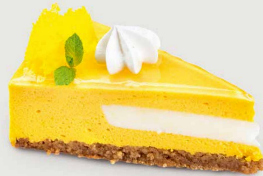
МАНГОВЫЙ МУСС 360 Mango mousse 芒果慕斯