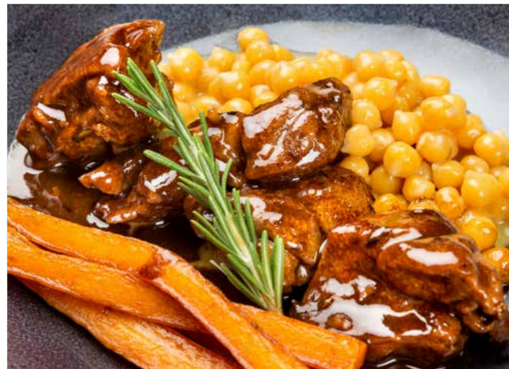
ЯГНЕНОК, ТОМЛЕННЫЙ С НУТОМ И МОРКОВЬЮ ..... 990 Lamb stew with chickpea and carrot 胡萝卜鹰嘴豆炖小羊肉