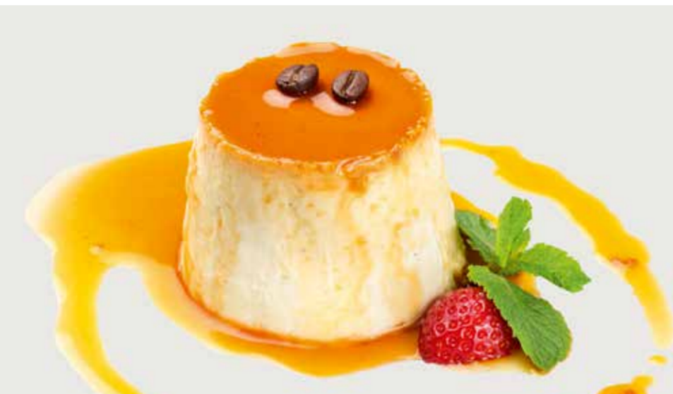
ПАННА КОТТА 290 Panna cotta 意式奶冻