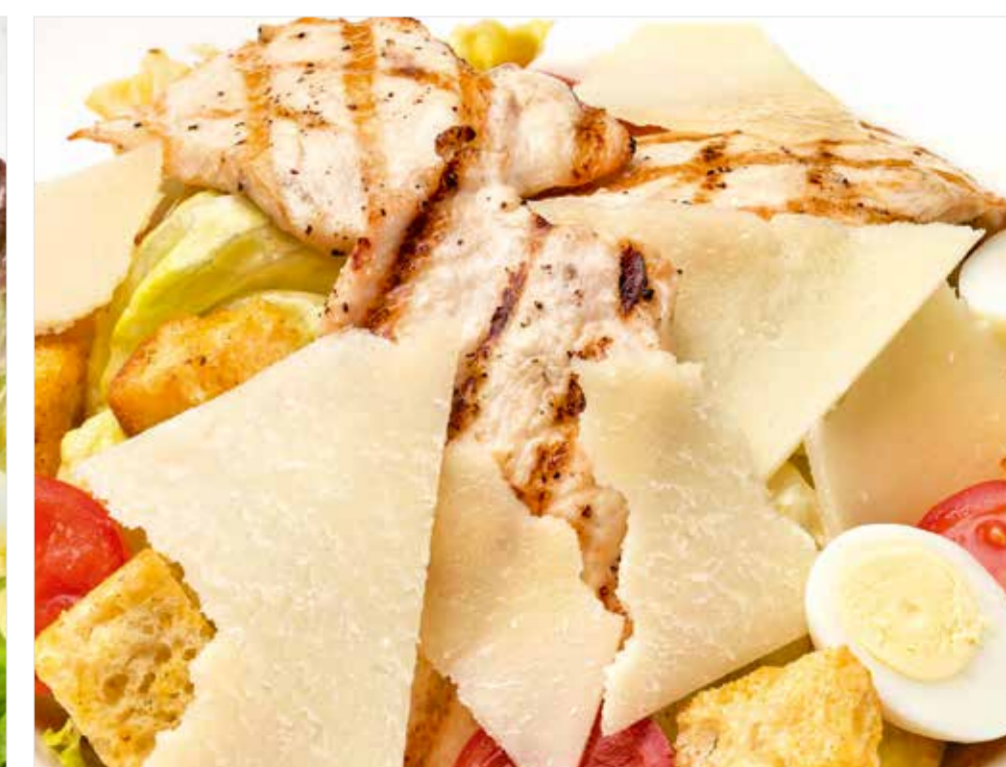
ЦЕЗАРЬ С КУРИЦЕЙ / С КРЕВЕТКАМИ 590 / 690 Caesar salad with chicken / with shrimps 鸡肉凯撒沙律 / 虾凯撒沙律