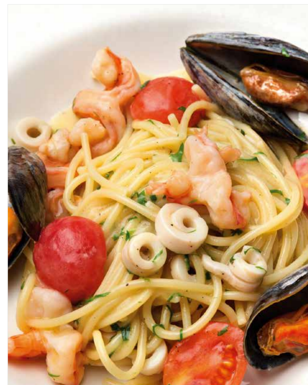
СПАГЕТТИ С МОРЕПРОДУКТАМИ Spaghetti with seafood 海鲜意大利粉