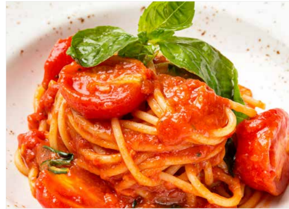
СПАГЕТТИ С ТОМАТАМИ ЧЕРРИ И БАЗИЛИКОМ Spaghetti with cherry tomatoes and basil 罗勒圣女果意面