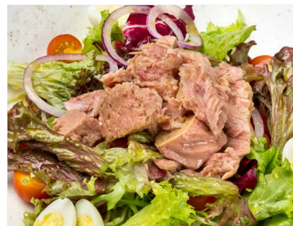
САЛАТ С ТУНЦОМ 560 Salad with tuna 罐头金枪鱼沙拉