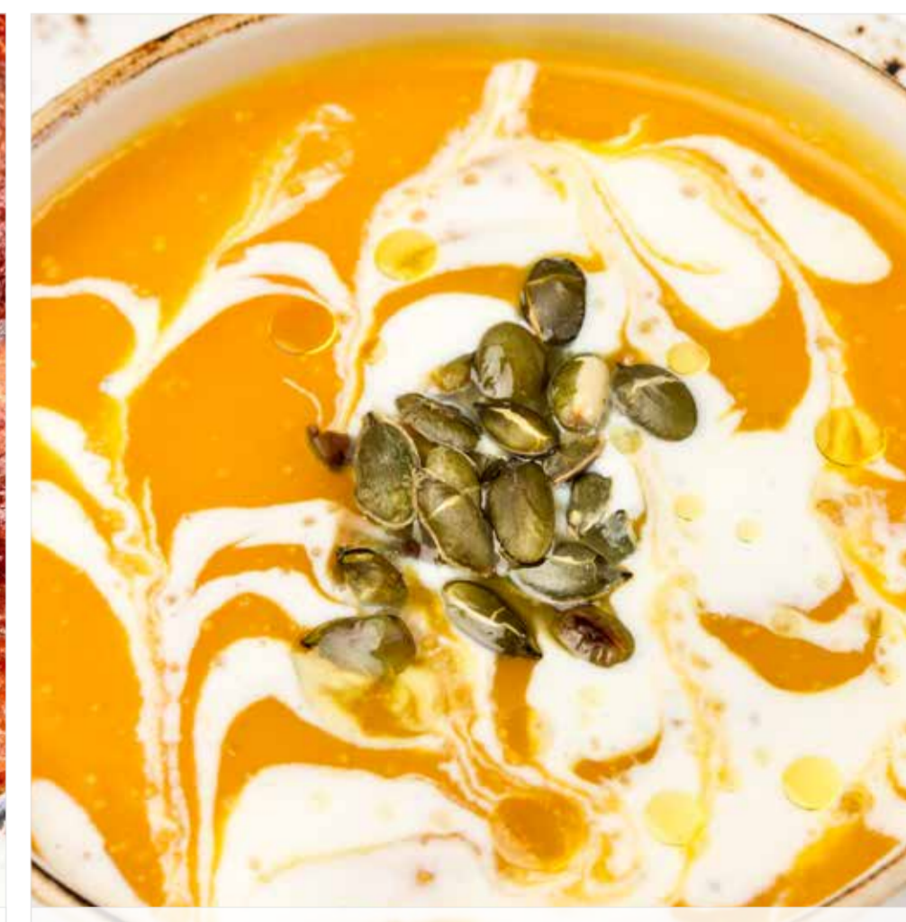
ТЫКВЕННЫЙ СУП С РИКОТТОЙ Pumpkin soup with ricotta 利可塔奶酪