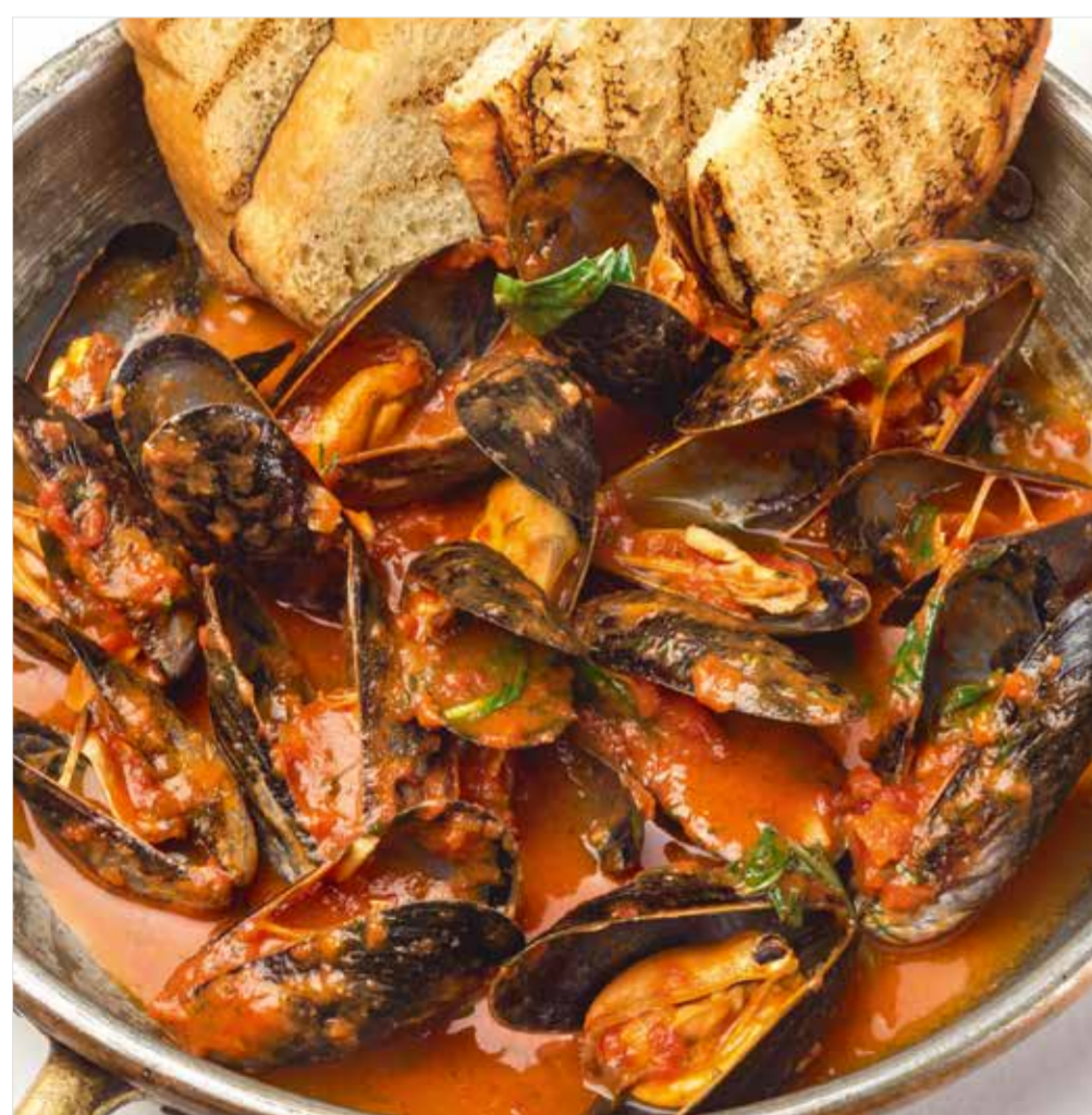
СОТЕ ИЗ МИДИЙ В ТОМАТНОМ СОУСЕ / БЕЛОМ ВИНЕ : 890 Sautéed mussels in tomato sauce / white wine 番茄酱烧蚝 / 白葡萄酒烧蚝