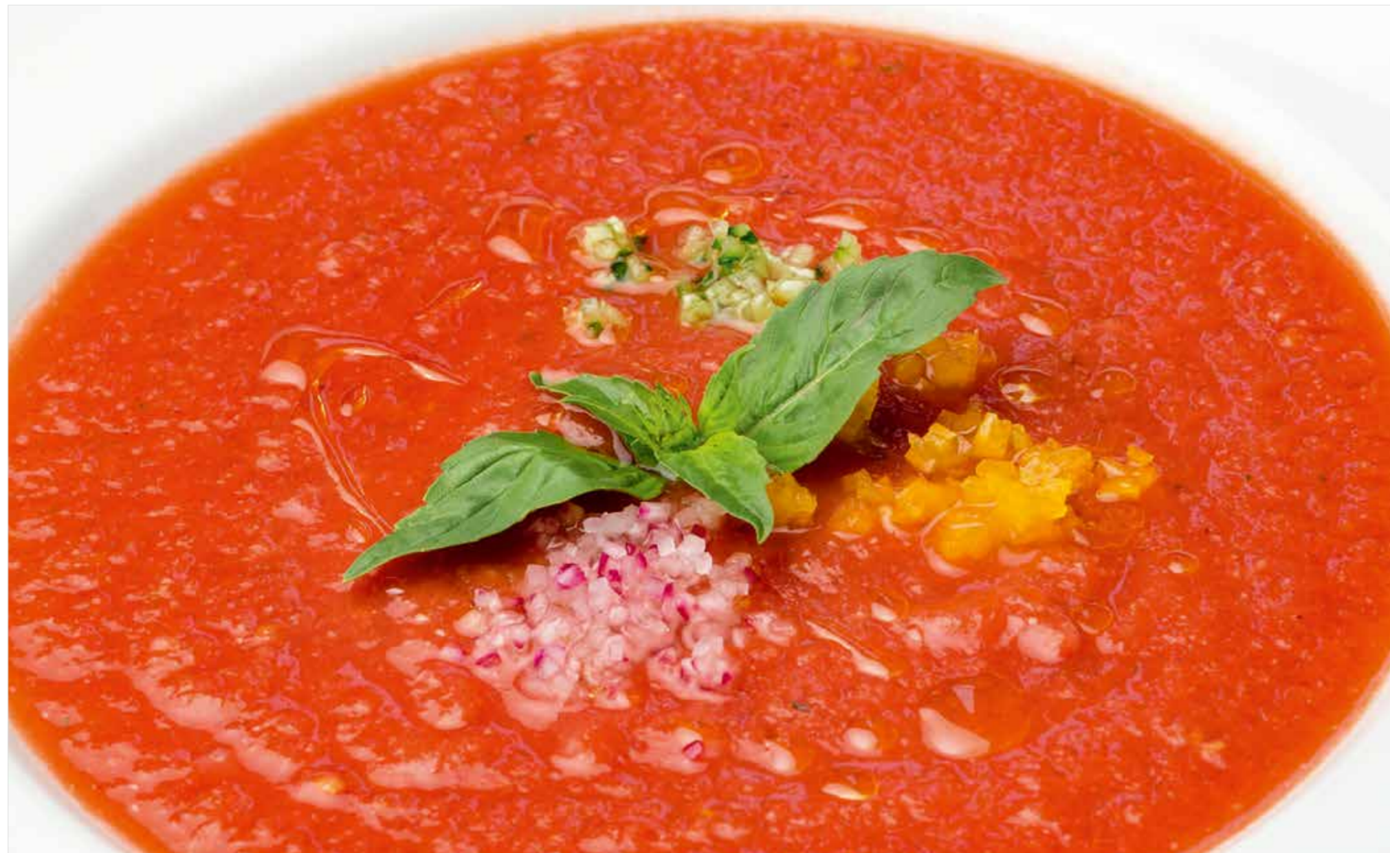
ГАСПАЧО Gazpacho 西班牙冻汤