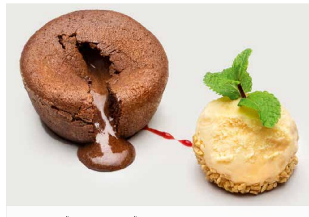
ГОРЯЧИЙ ШОКОЛАДНЫЙ КЕКС