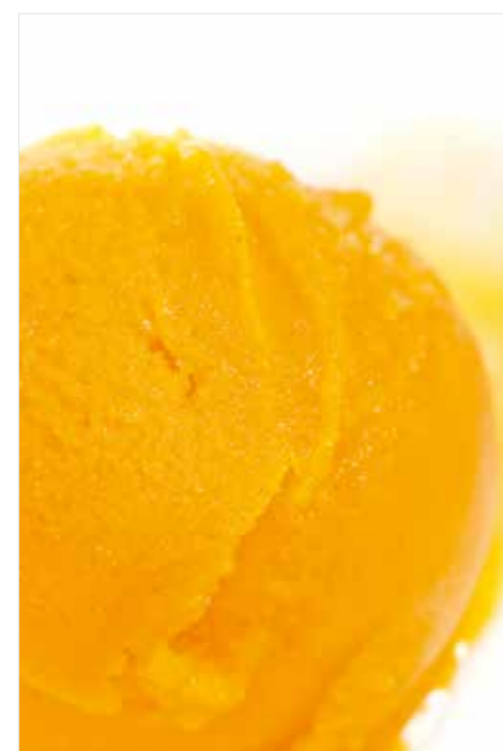
СОРБЕТ В АССОРТИМЕНТЕ