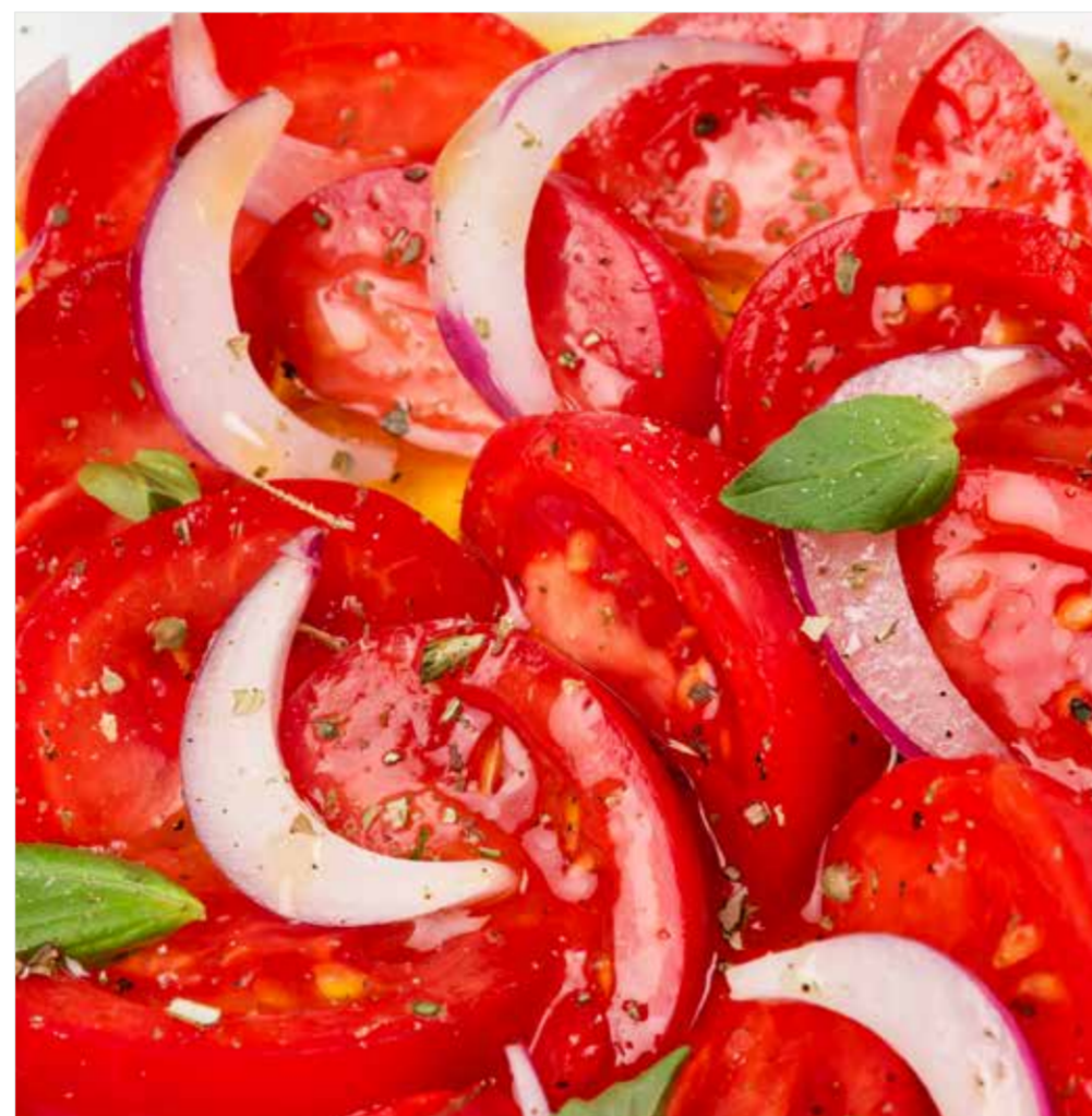
КАРПАЧО ИЗ ПОМИДОРОВ Tomato carpaccio 番茄薄片