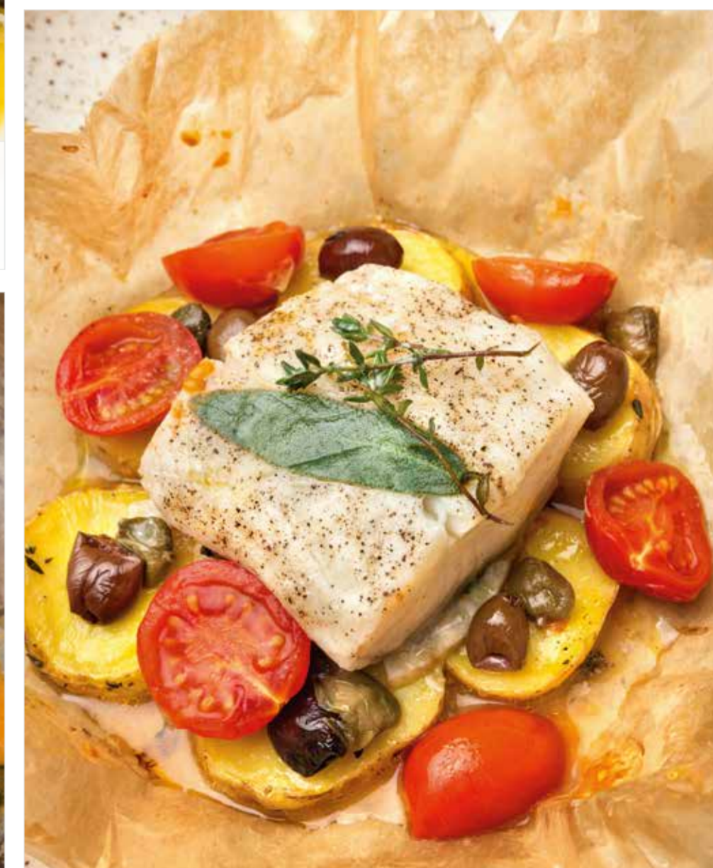
ФИЛЕ ПАЛТУСА, ЗАПЕЧЕННОЕ В ПЕРГАМЕНТЕ Parchment-baked halibut fillet 羊皮纸烤庸鲈扒