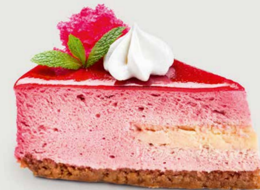
МАЛИНОВЫЙ МУСС 370 Raspberry mousse 覆盆子慕斯