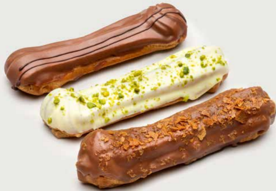
ЭКЛЕР ВАНИЛЬНЫЙ / ФИСТАШКОВЫЙ / ФУНДУЧНЫЙ 250 Eclairs vanilla / pistachio / hazelnut 香草奶油松饼 / 开心果奶油松饼 / 榛子奶油松饼