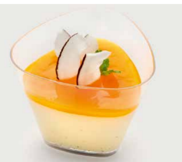
ПАННА КОТТА ЭКЗОТИК ..... 260 Panna cotta exotic 异国奶冻