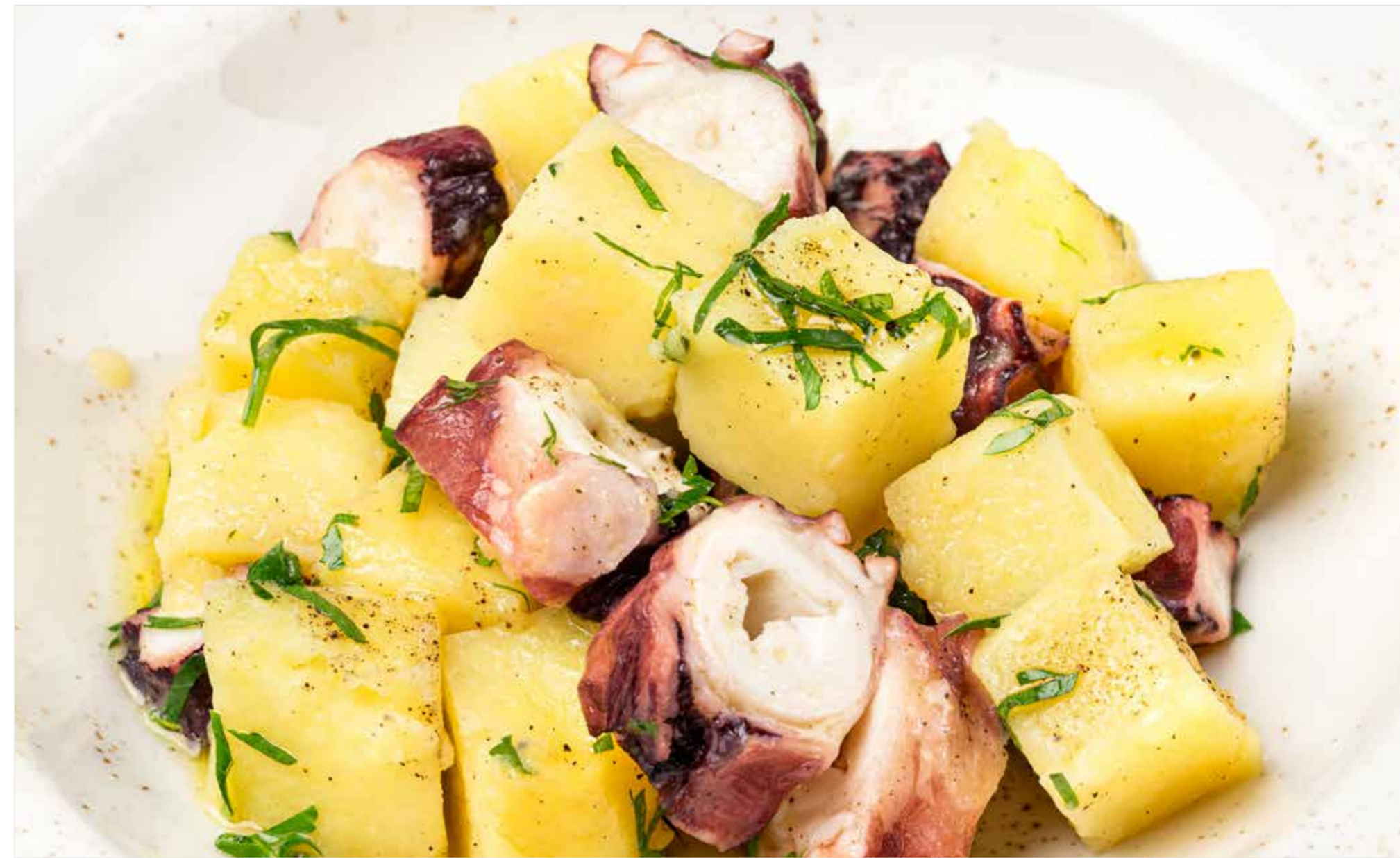
ОСЬМИНОГ С КАРТОФЕЛЕМ Octopus with potatoes 章鱼配土豆