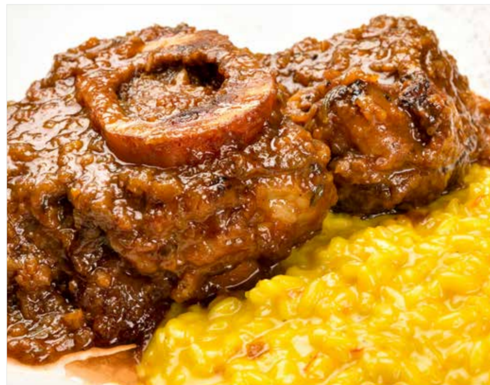
ОССОБУКО ПО-МИЛАНСКИ ..... 1190 Ossobuco Milanese style 普罗旺斯杂烩牛肋骨