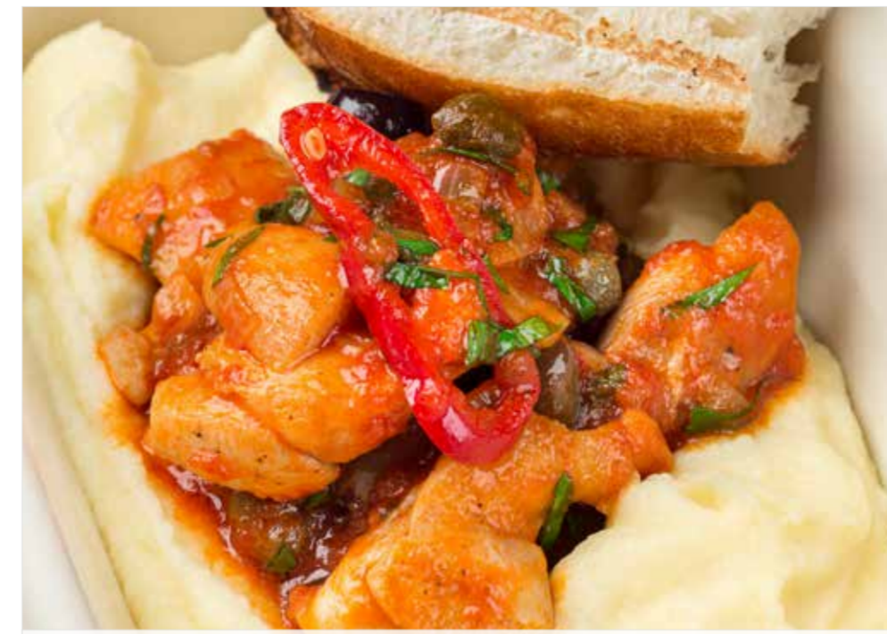
БЕДРО ЦЫПЛЕНКА, ТУШЕННОЕ С ОЛИВКАМИ И ТОМАТАМИ ..... 540 Chicken thigh stewed with olives and tomatoes 橄榄番茄炖鸡腿