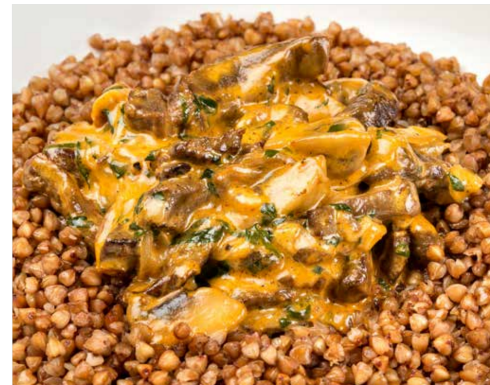
БЕФСТРОГАНОВ С ГРЕЧЕЙ ..... 590 Beef stroganoff with buckwheat 俄式炒牛肉和荞麦粥