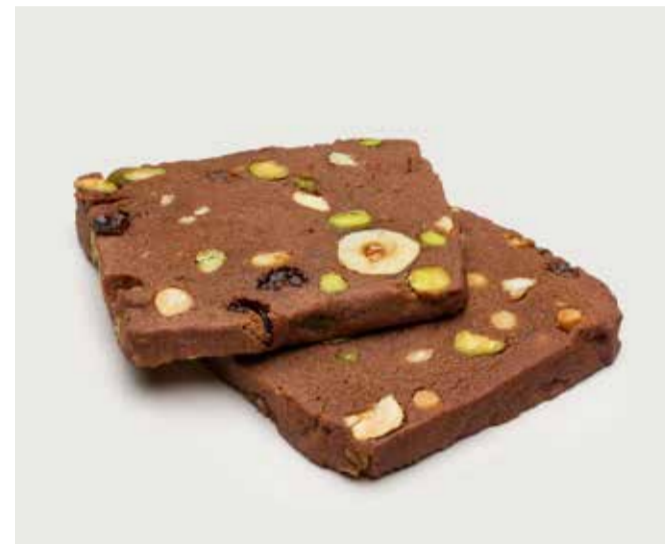
ПЕЧЕНЬЕ С СУХОФРУКТАМИ И ОРЕХАМИ ..... 110 Cookie with dried fruits and nuts 巧克力饼干