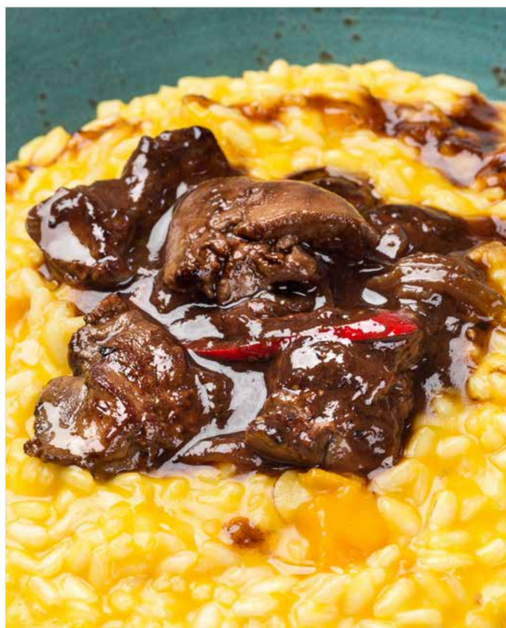
РИЗОТТО С ТЫКВОЙ И ПЕЧЕНЬЮ КРОЛИКА Risotto with pumpkin and rabbit liver 兔子肝南瓜意大利炖饭