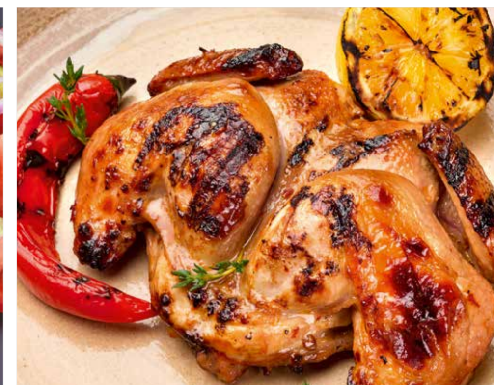
ЦЫПЛЕНОК НА ГРИЛЕ Grilled chicken 烧烤鸡雏