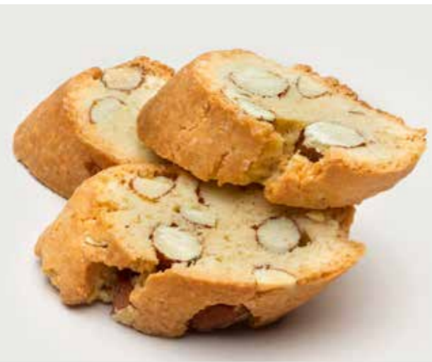
ПЕЧЕНЬЕ КАНТУЧЧИ ..... 90 Cantucci cookie 杏仁长饼