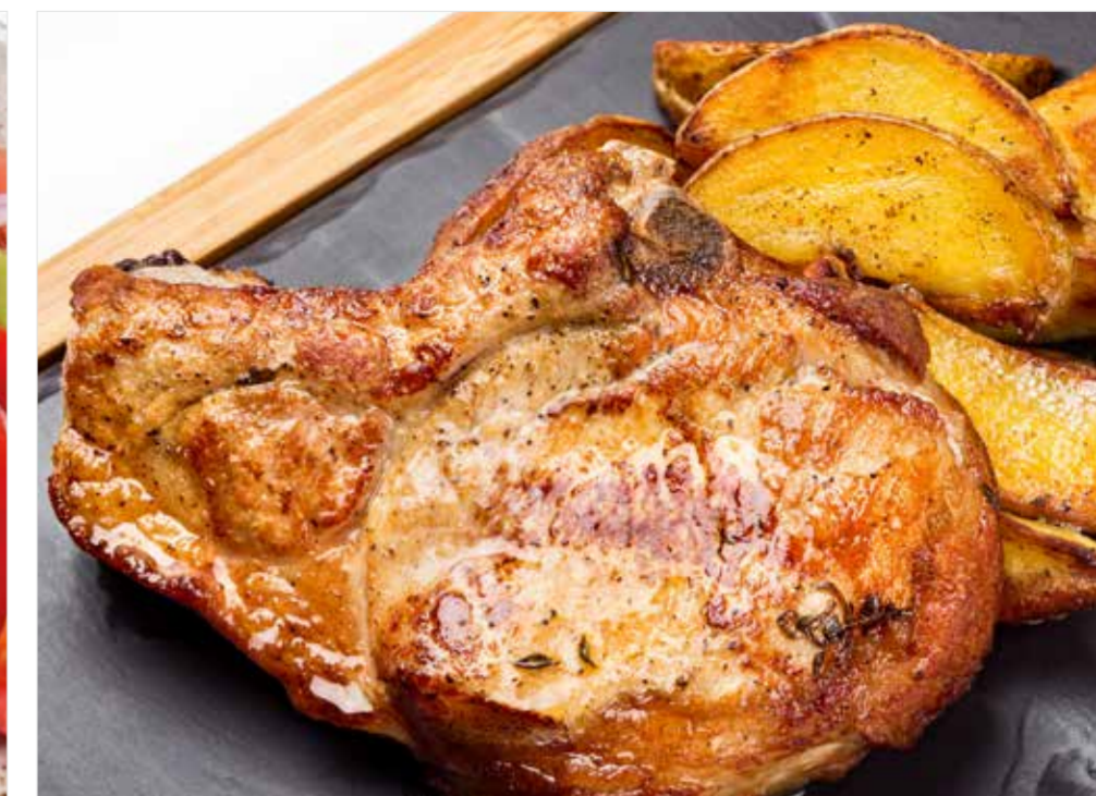
КОРЕЙКА СВИНАЯ С ЗАПЕЧЕННЫМ КАРТОФЕЛЕМ Pork loin with baked potatoes 猪肉里脊配烤土豆