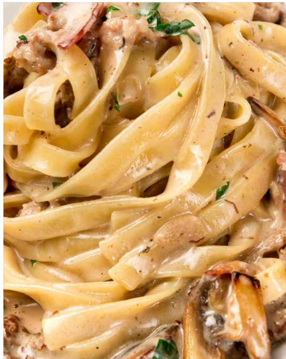
ТАЛЬЯТЕЛЛЕ С РАГУ ИЗ ГОВЯДИНЫ Tagliatelle with stewed beef 炖牛肉意大利面