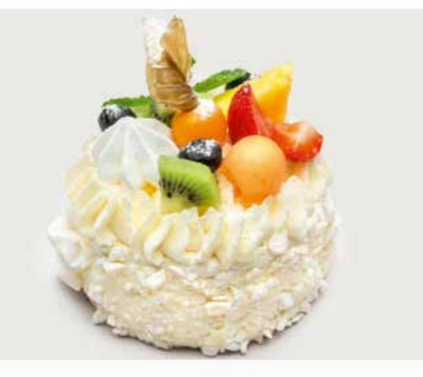
МЕРЕНГАТА С ФРУКТАМИ ..... 280 Meringata with fruits 蛋白霜蛋糕