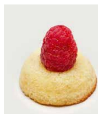
ТАРТАЛЕТКА С МАЛИНОЙ