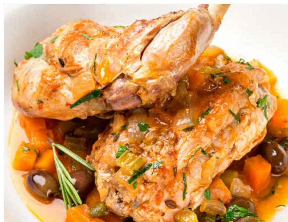
КРОЛИК КАЧЧИАТОРЕ ..... 1190 Rabbit cacciatore 意大利式猎人炖兔肉