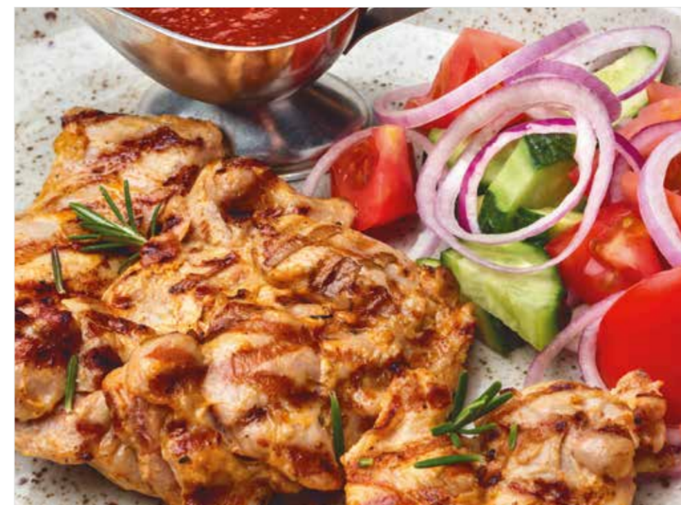
НЕЖНЫЕ КУСОЧКИ КУРИЦЫ, ПРИГОТОВЛЕННЫЕ НА УГЛЯХ Tender chicken pieces cooked on charcoal 炭火烤嫩鸡肉块