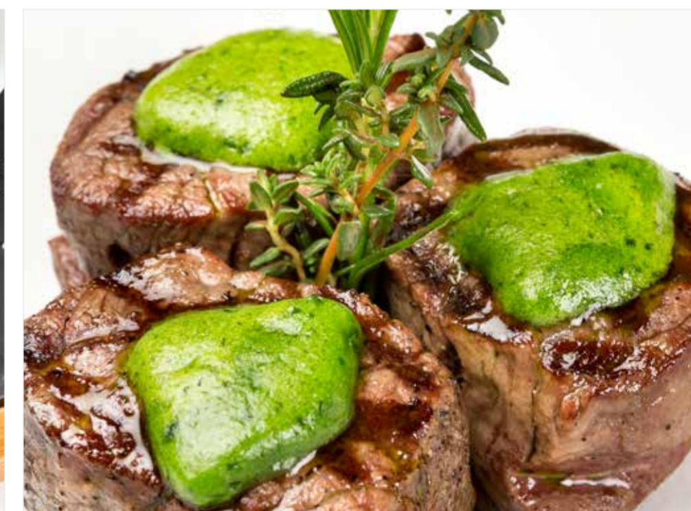
ФИЛЕ-МИНЬОН ИЗ МРАМОРНОЙ ГОВЯДИНЫ С МАСЛОМ ПЕТРУШКИ Marbled beef fillet mignon with parsley oil 免翁牛柳配欧芹油