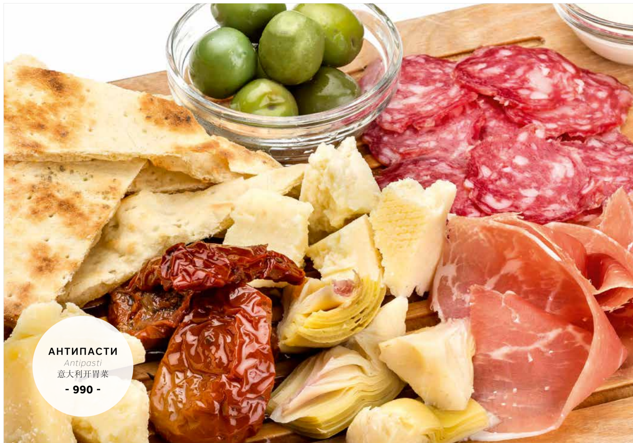
АНТИПАСТИ Antipasti 意大利开胃菜 - 990 -