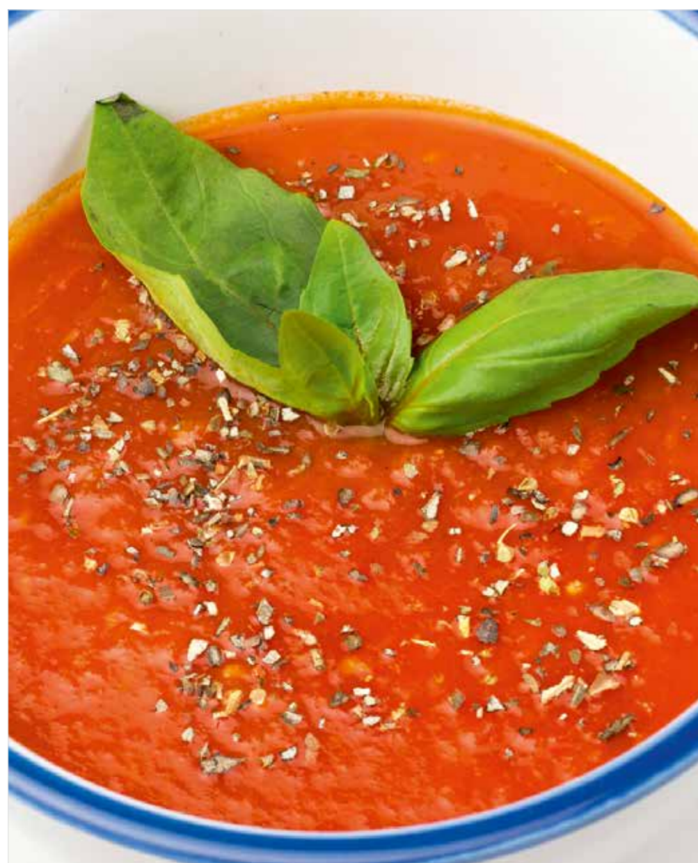
ТОМАТНЫЙ СУП Tomato soup 番茄汤