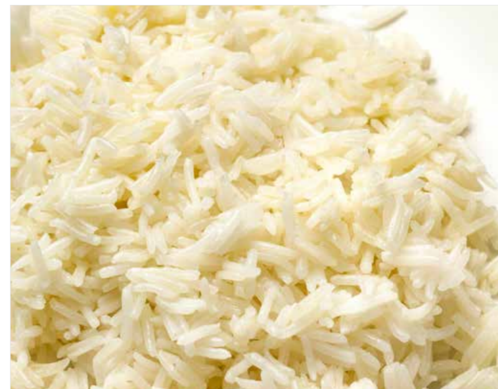
РИС БАСМАТИ Basmati rice 印度香米