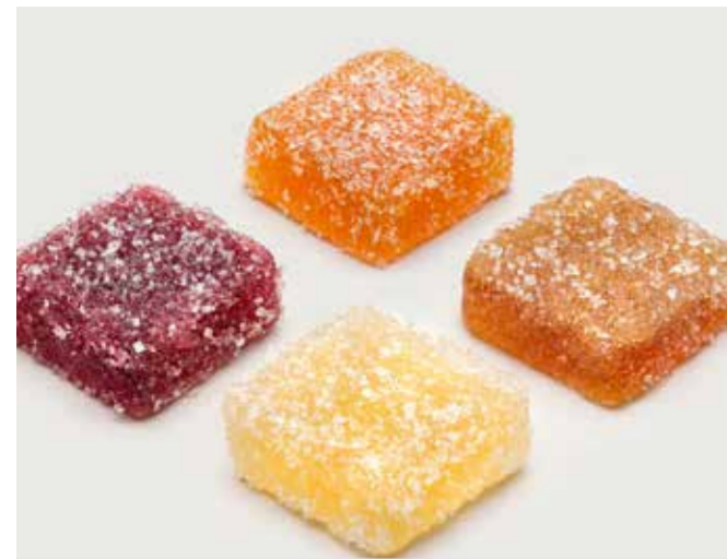
МАРМЕЛАД в ассортименте ..... 80 Marmalade in assortment 多种口味的水果软糖