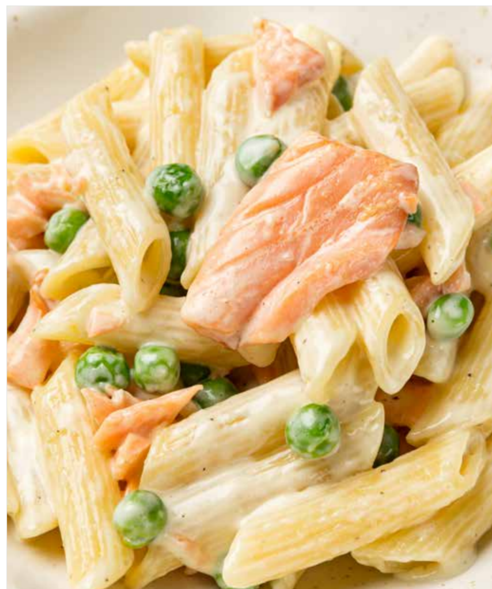
ПЕННЕ С КОПЧЕНЫМ ЛОСОСЕМ Penne with smoked salmon 熏三文鱼直通粉