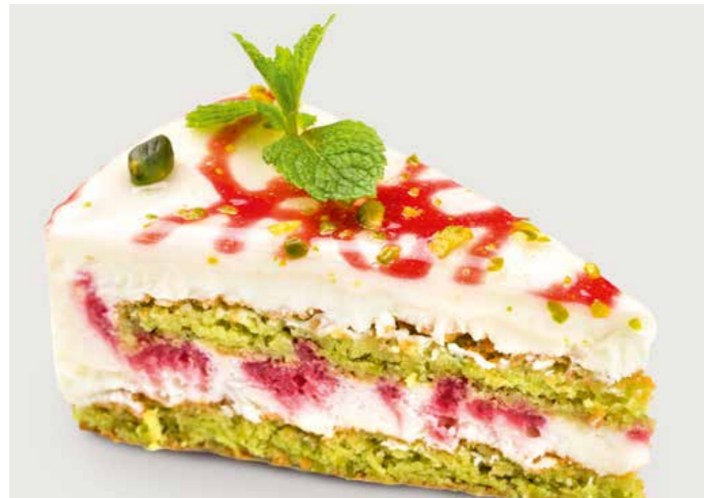
ЙОГУРТОВЫЙ ТОРТ С МАЛИНОЙ И ФИСТАШКОВЫМ БИСКВИТОМ

Yoghurt cake with raspberry and pistachio sponge-cake 覆盆子开心果酸奶松糕