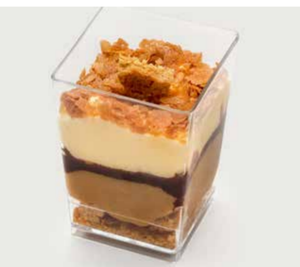
ФУНДУЧНОЕ ПРАЛИНЕ ..... 190 Hazelnut praline 果仁糖