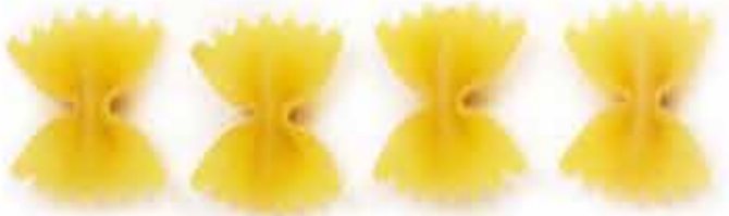
ФАРФАЛЛЕ / FARFALLE / 蝴蝶粉