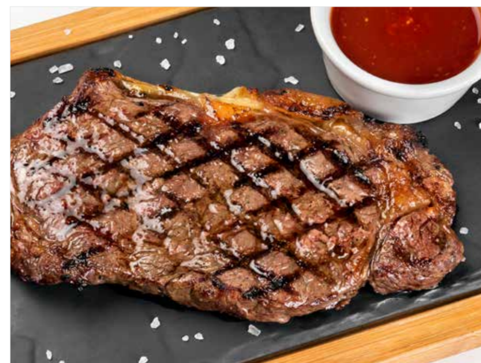
СТЕЙК СТРИПЛОЙН Strip steak 纽约客牛排