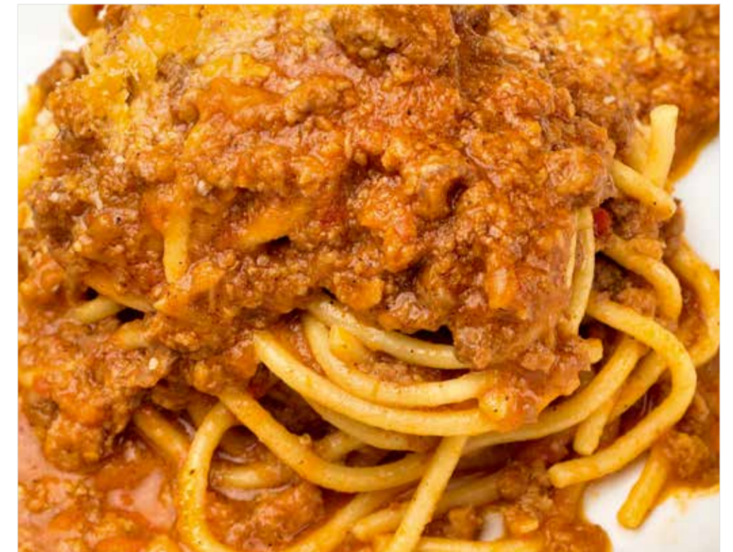
БОЛОНЬЕЗЕ Bolognese 番茄肉酱意大利面条