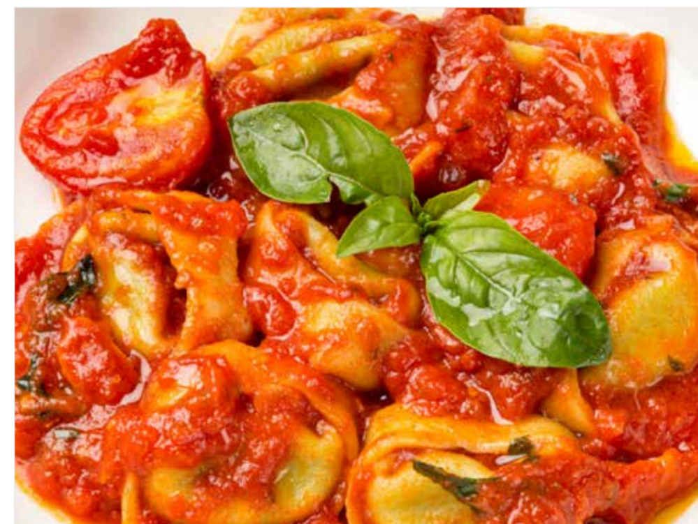
ТОРТЕЛЛИ С РИКОТТОЙ И ШПИНАТОМ В ТОМАТНОМ СОУСЕ Tortelli with ricotta and spinach in tomato sauce 利可塔奶酪与菠菜意大利饺子加番茄酱