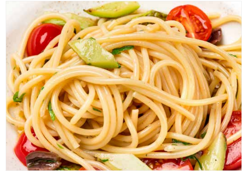
СПАГЕТТИ С ЦУКИНИ, ОЛИВКАМИ И ТОМАТАМИ ЧЕРРИ Spaghetti with zucchini, olives and cherry tomatoes 意大利面配西葫芦, 橄榄和樱桃番茄