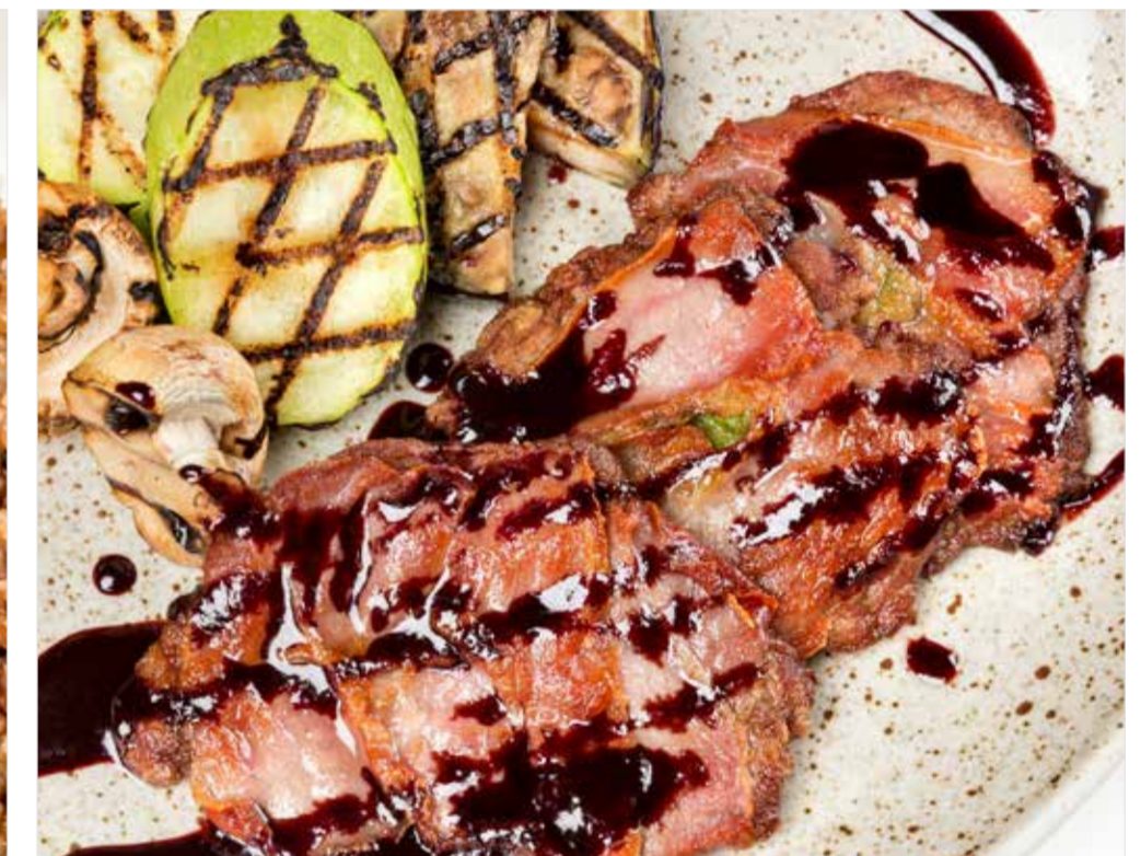
САЛЬТИМБОККА ПО-РИМСКИ С ОВОЩАМИ ГРИЛЬ ..... 890 Saltimbocca "alla romana" with grilled vegetables 罗马式煎小牛肉火腿卷