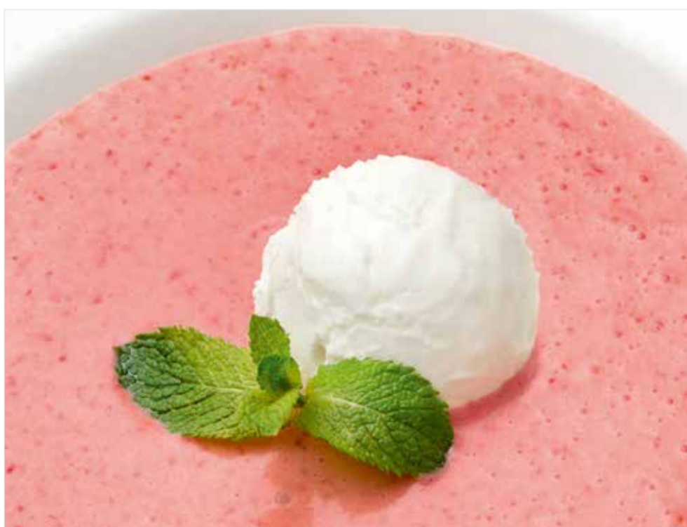
КЛУБНИЧНЫЙ СУП С ВАНИЛЬНЫМ МОРОЖЕНЫМ

Strawberry soup with vanilla ice-cream 草莓汤配香草雪糕