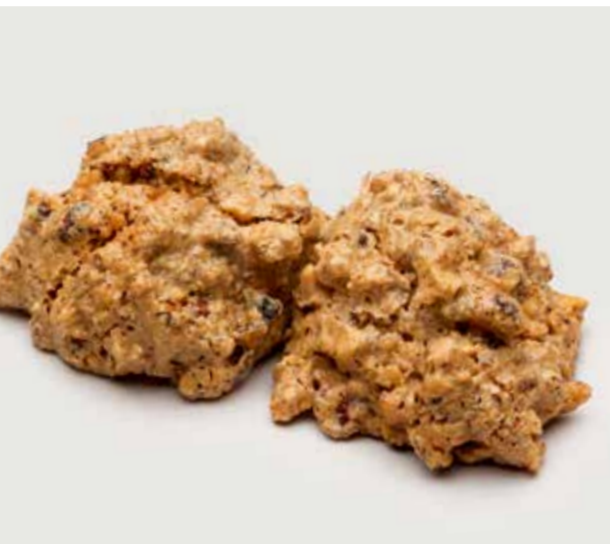
МЕРЕНГА ФУНДУЧНАЯ ..... 120 Hazelnut meringue 榛子蛋白脆饼