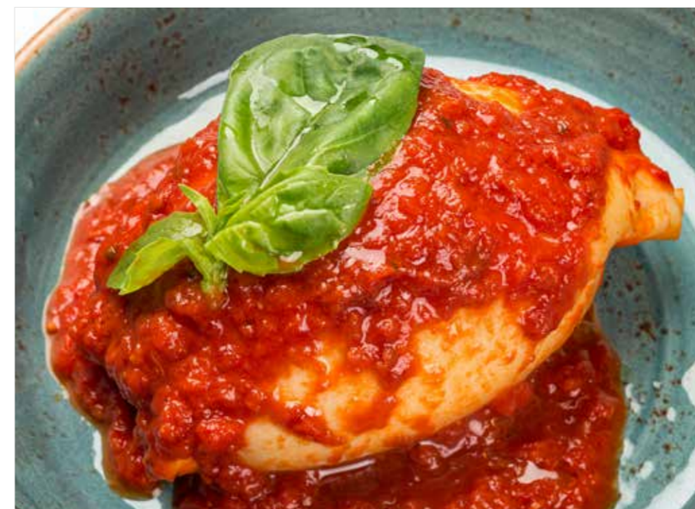
ФАРШИРОВАННЫЙ КАЛЬМАР Stuffed squid 填馅鱿鱼