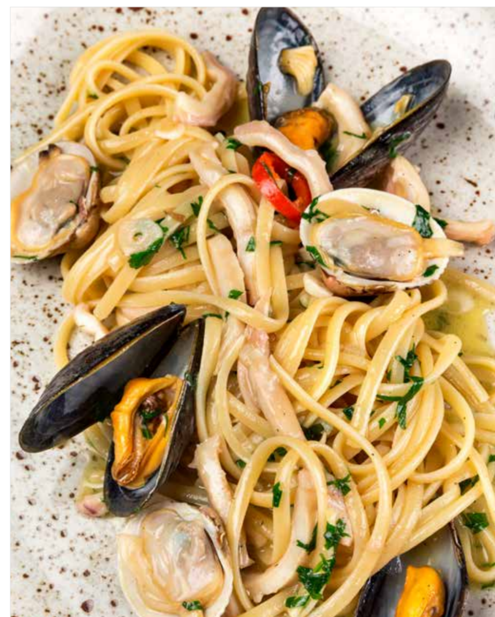
ЛИНГВИННИ С МОЛЛЮСКАМИ, КАЛЬМАРОМ И КРЕВЕТКАМИ Linguine with clams, squid and shrimps | 蛤蜊鱿鱼鲜虾中细面