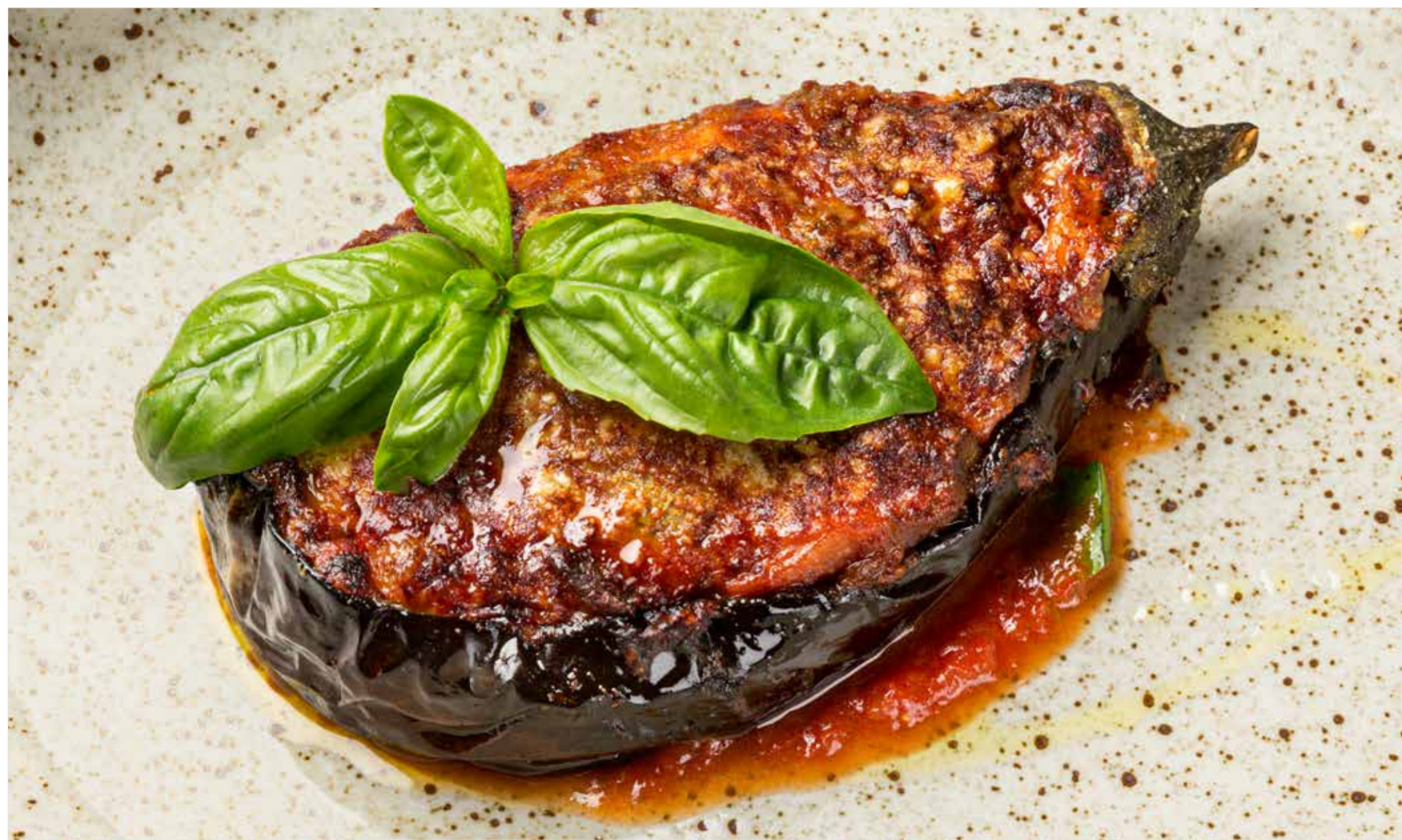
БАКЛАЖАН ПАРМИДЖАНО Eggplant parmigiano 帕尔马茄子