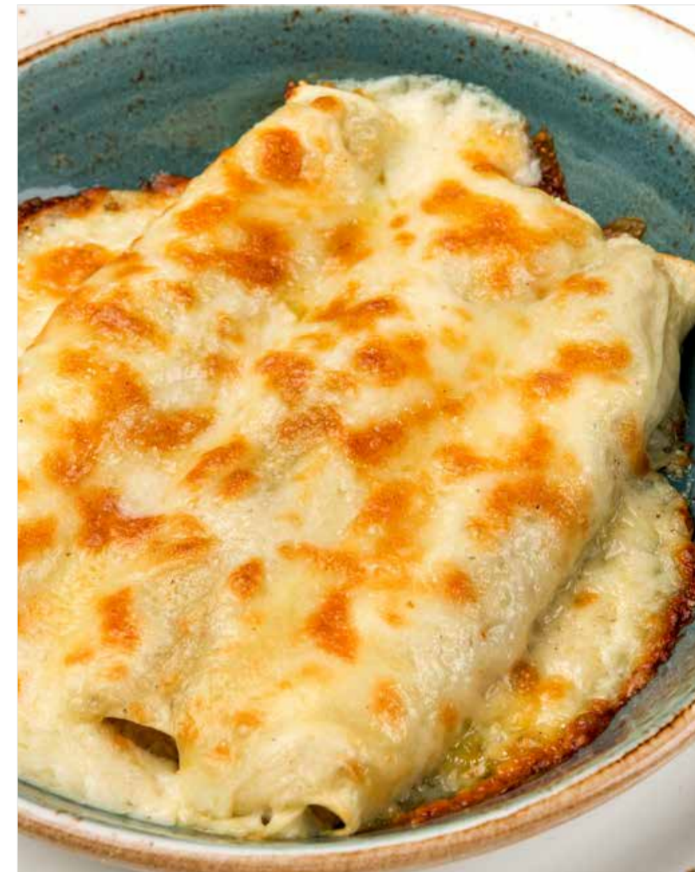
КАННЕЛЛОНИ, ФАРШИРОВАННЫЕ УТКОЙ Cannelloni stuffed with duck 意大利鸭肉馅卷