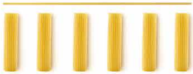
РИГАТОНИ / RIGATONI / 长通粉

МЫ МОЖЕМ ЗАМЕНИТЬ НА ПАСТУ БЕЗ ГЛЮТЕНА WE CAN ALSO REPLACE IT WITH GLUTEN-FREE PASTA 此外, 我们还可使用无麸质意面代替