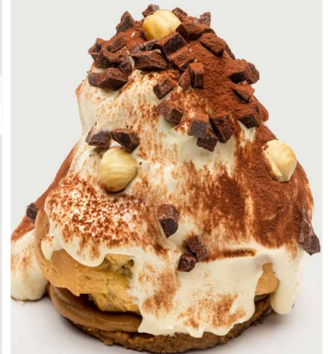
ПРОФИТРОЛИ С ЛЕСНЫМ ОРЕХОМ 420 Profiteroles with hazelnut 榛子泡芙