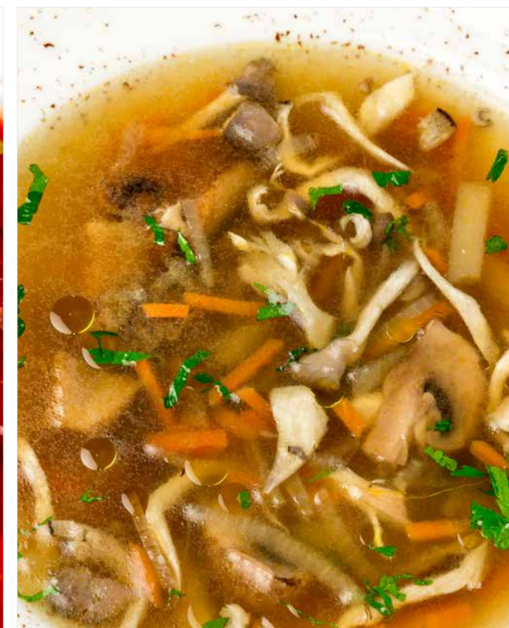
ГРИБНОЙ СУП СО СМЕТАНОЙ Sour cream mushroom soup 蘑菇汤与酸奶油