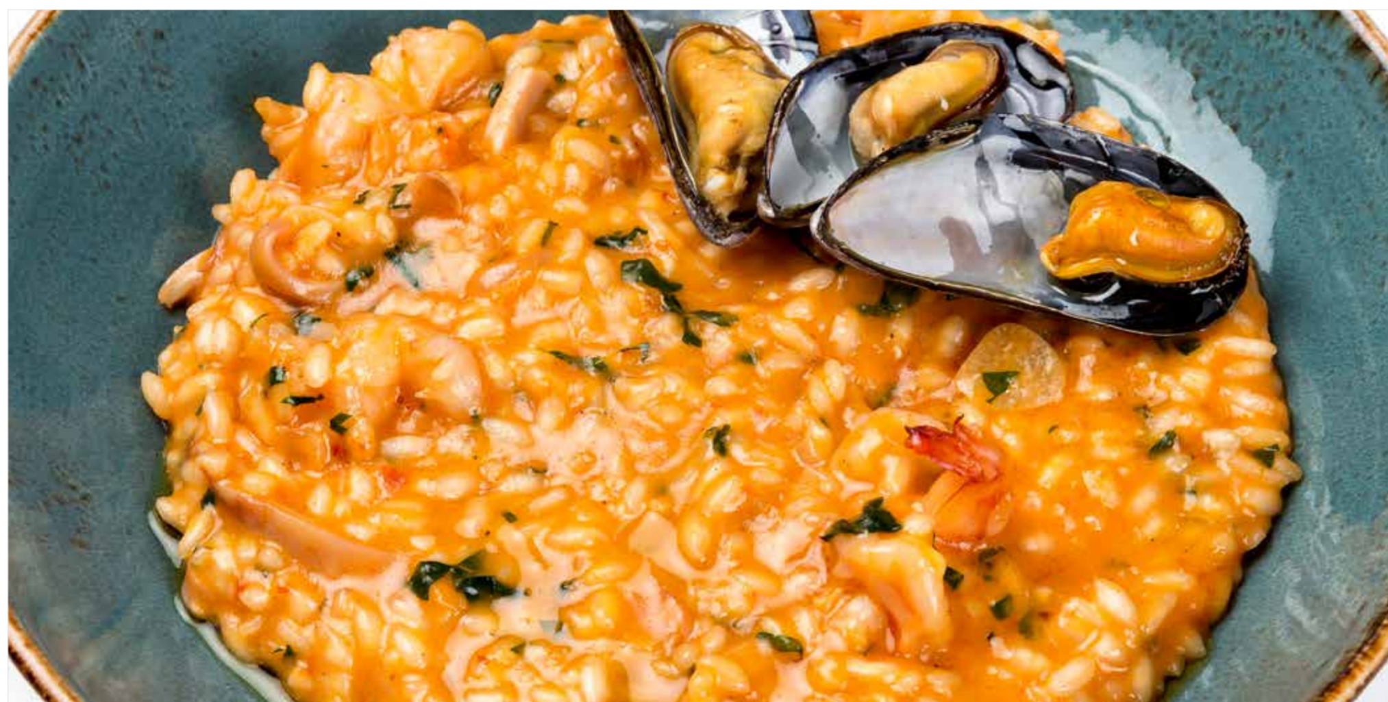
РИЗОТТО С МОРЕПРОДУКТАМИ Risotto with seafood 海鲜贻贝意大利米饭