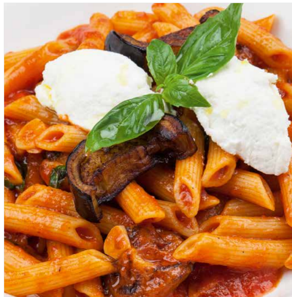
ПЕННЕ С БАКЛАЖАНОМ И РИКОТТОЙ Penne with eggplant and ricotta 直通粉, 茄子, 里科塔奶酪