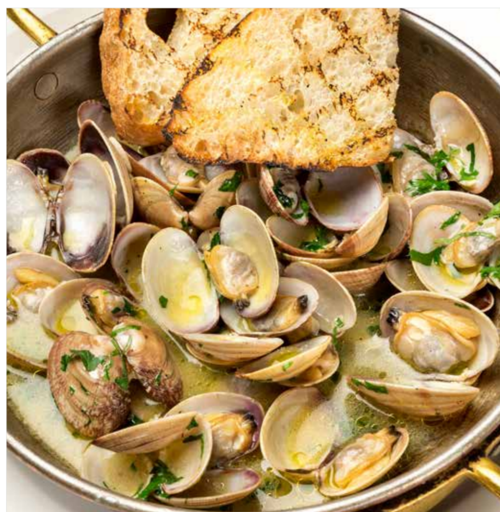
СОТЕ ИЗ ВОНГОЛЕ Sautéed clam 嫩煎蛤蜊