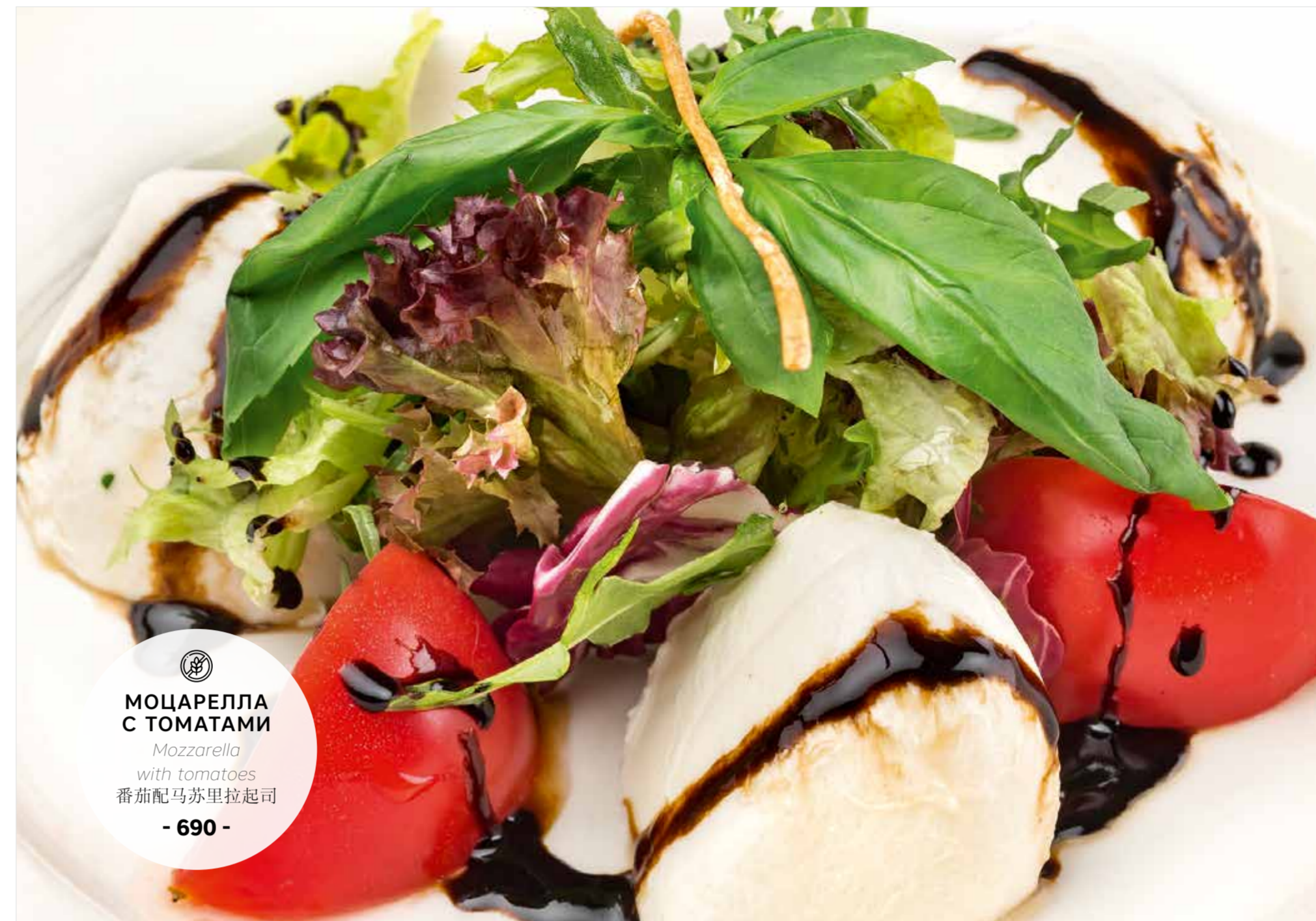
МОЦАРЕЛЛА С ТОМАТАМИ Mozzarella with tomatoes 番茄配马苏里拉起司 - 690 -