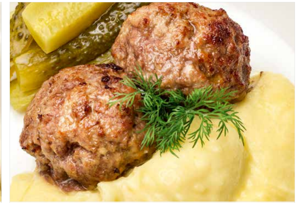
ДОМАШНИЕ КОТЛЕТЫ / КОТЛЕТЫ ИЗ ИНДЕЙКИ С КАРТОФЕЛЬНЫМ ПЮРЕ ..... 560/690 Homemade patties with mashed potatoes / turkey patties with mashed potatoes 家常肉饼搭配土豆泥 / 火鸡肉饼搭配土豆泥