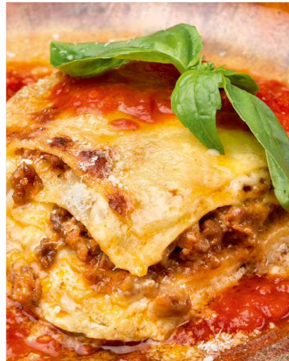
ЛАЗАНЬЯ Lasagna 千层面