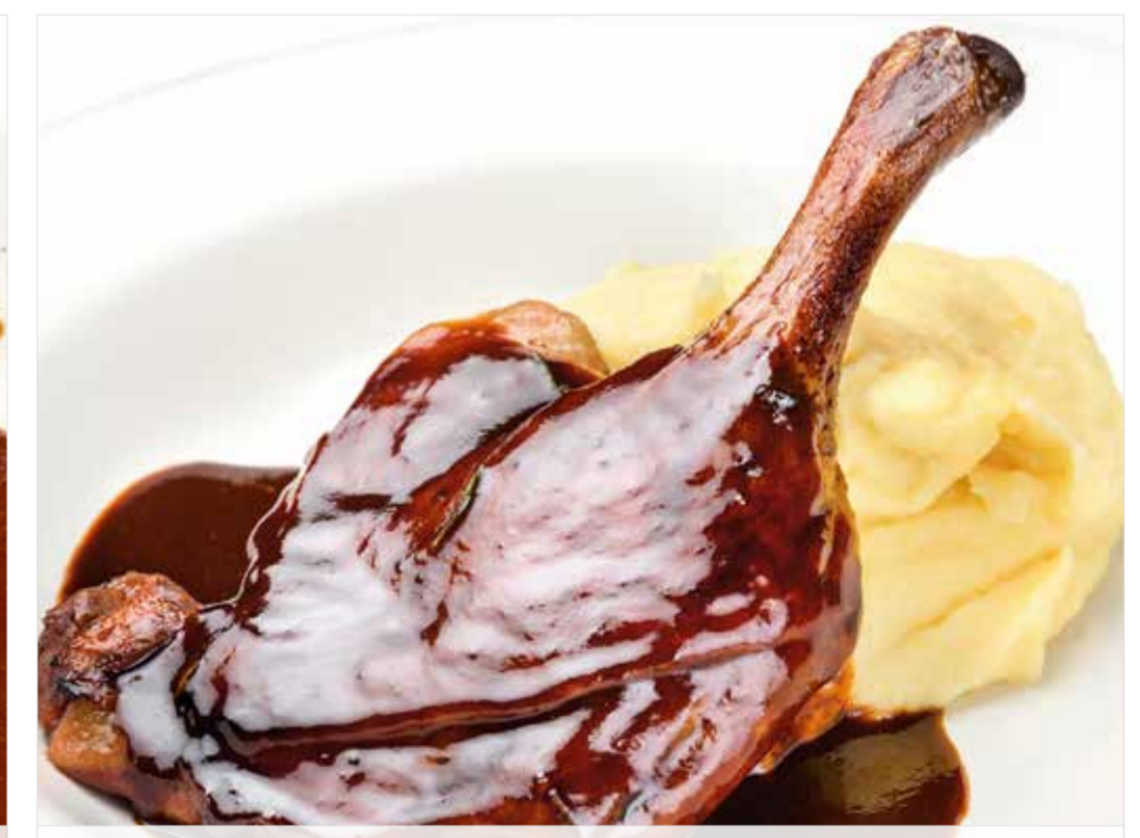
УТИНАЯ НОЖКА КОНФИ С КАРТОФЕЛЬНЫМ ПЮРЕ ..... 980 Confit duck leg with mashed potatoes 油封鸭腿配土豆泥