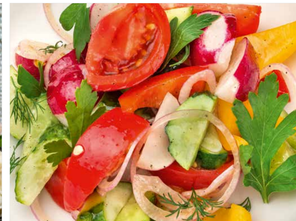
ОВОЩНОЙ САЛАТ 390 Vegetable salad 蔬菜沙拉