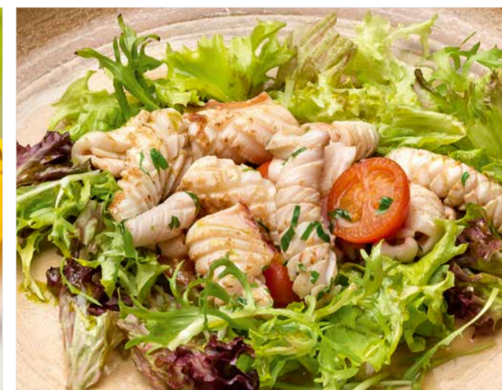
КАЛЬМАРЫ С МИКС-САЛАТОМ И ТОМАТАМИ ЧЕРРИ 560 Squid with mixed salad and cherry tomatoes 鱿鱼混合沙拉配圣女果