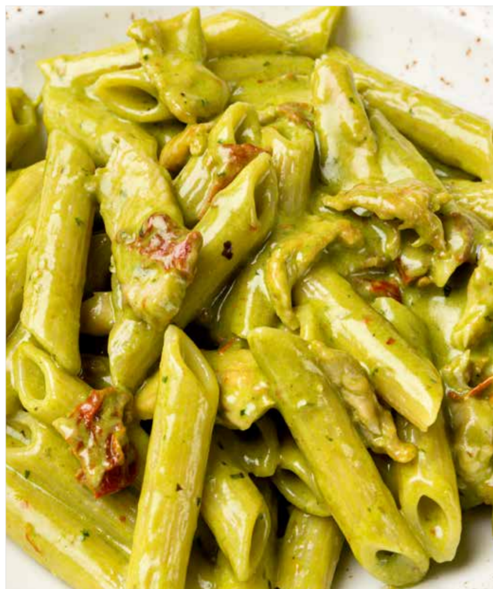
ПЕННЕ С КУРИНОЙ ГРУДКОЙ И ВЯЛЕНЫМИ ТОМАТАМИ И СОУСОМ ПЕСТО Penne with chicken breast and sun-dried tomatoes 直通粉配鸡胸肉和熏西红柿