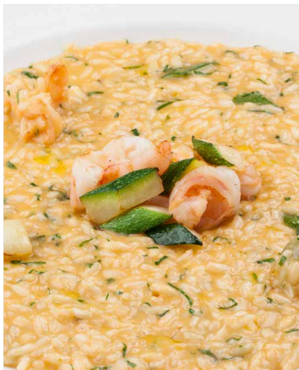
РИЗОТТО С ЦУКИНИ И КРЕВЕТКАМИ Risotto with zucchini and shrimps 意大利南瓜鲜烩饭