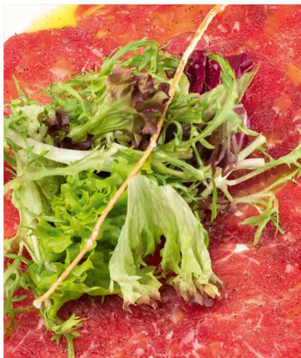
КАРПАЧО ИЗ ГОВЯДИНЫ / С ТРЮФЕЛЬНЫМ КРЕМОМ Beef carpaccio / with truffle cream 牛肉薄片 / 松露奶油