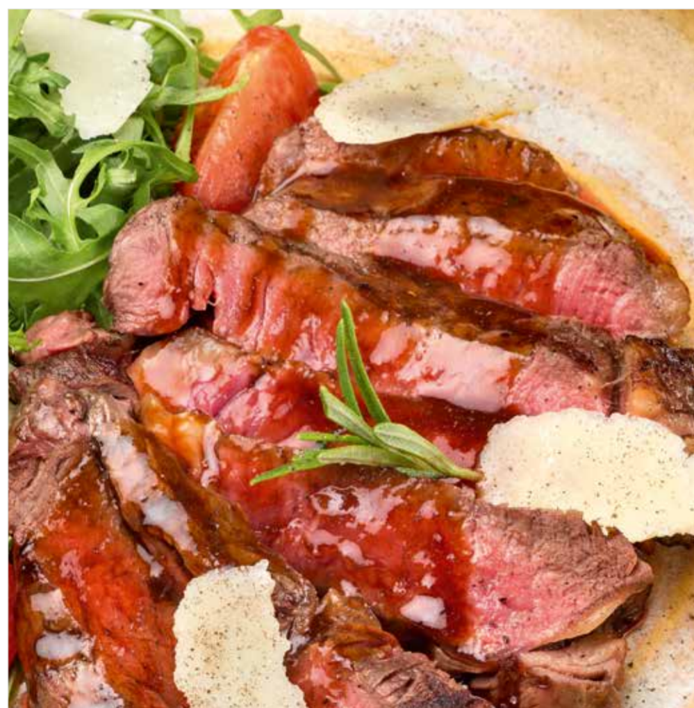
ТАЛБЯТА ИЗ ГОВЯДИНЫ ..... 2290 Beef tagliata 牛肉薄片