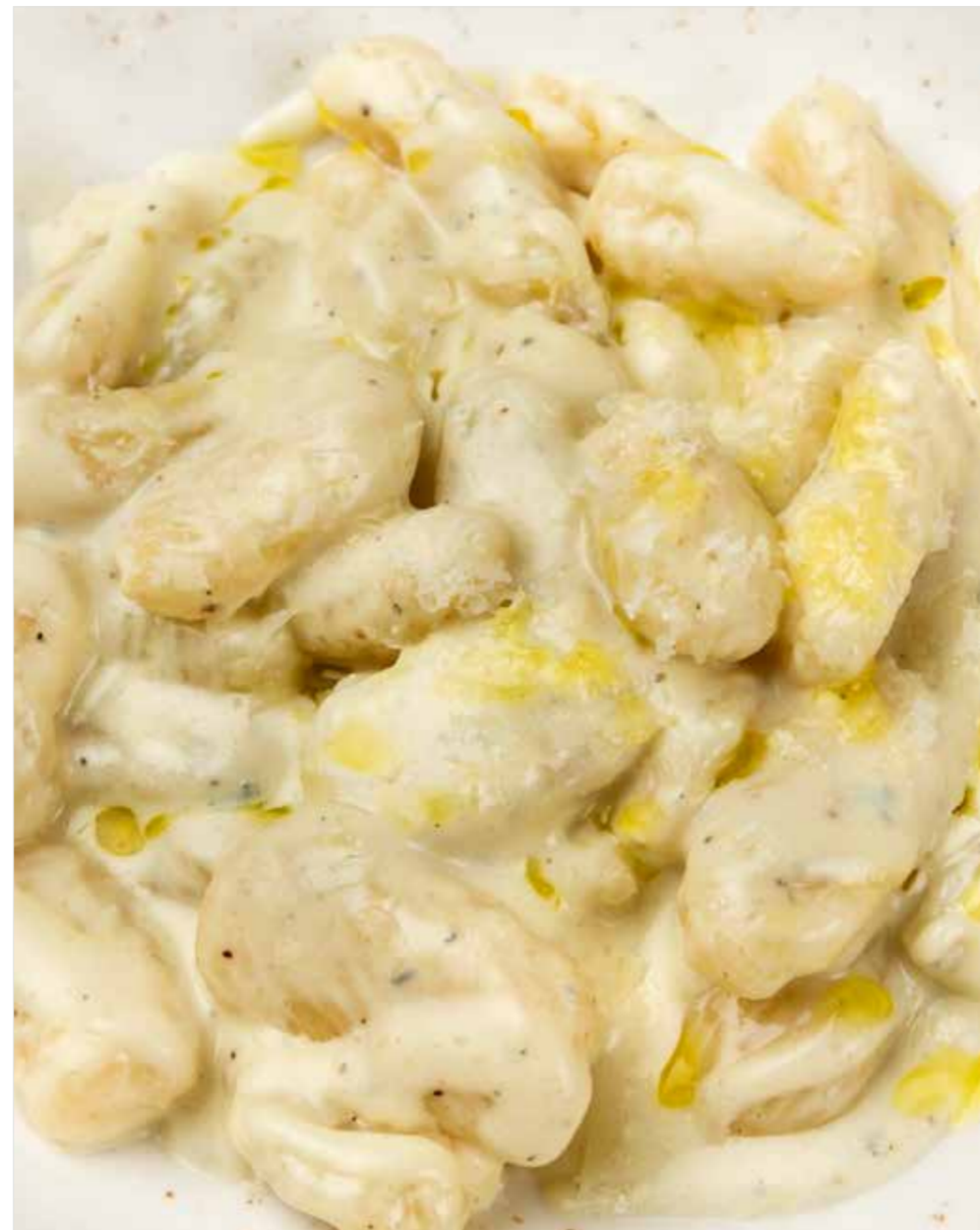
НЬОККИ ЧЕТЫРЕ СЫРА Gnocchi Four cheese “四种奶酪”玉棋