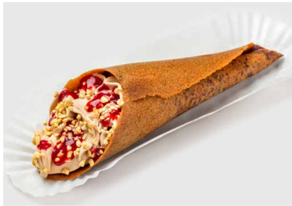
ВАФЕЛЬНЫЙ РОЖОК С КРЕМОМ НУГАТИН И ВИШНЕВЫМ СОУСОМ

Waffle cone with nougatine cream and cherry sauce 蛋筒壳配焦糖榛实和樱桃酱