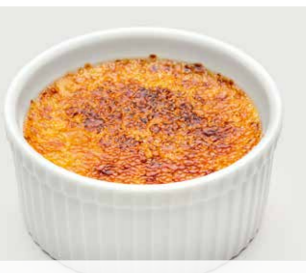
КРЕМА КАТАЛАНА ..... 280 Catalana cream 卡塔隆奶油饼