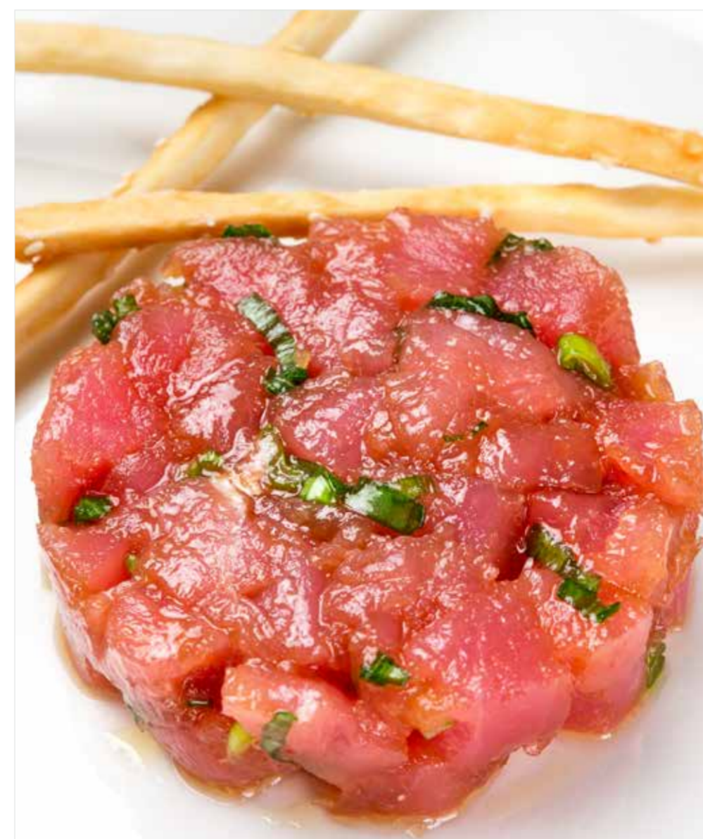
ТАРТАР ИЗ ТУНЦА Tuna tartare 吞拿鱼塔塔