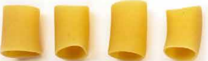
ПАККЕРИ / PACCHERI / 特大水管通心粉