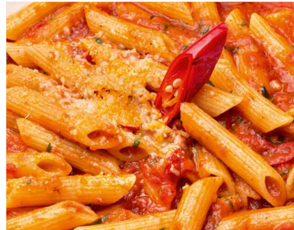
ПЕННЕ С ТОМАТНЫМ СОУСОМ И ЧИЛИ ПЕРЦЕМ Penne with tomato sauce and chili pepper 直通粉, 番茄酱, 椒