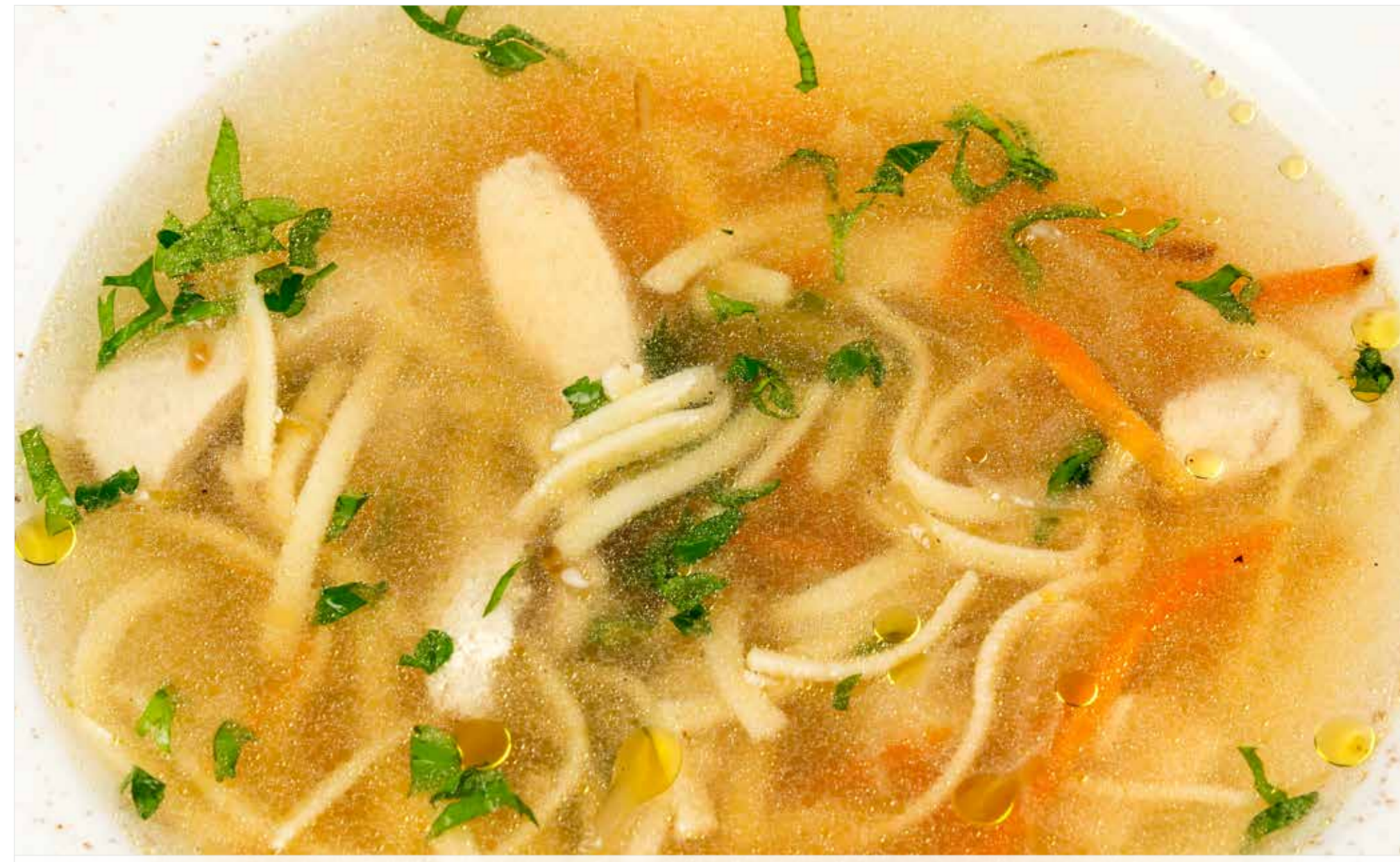
ДОМАШНИЙ КУРИНЫЙ СУП Homemade chicken soup 家常鸡肉汤