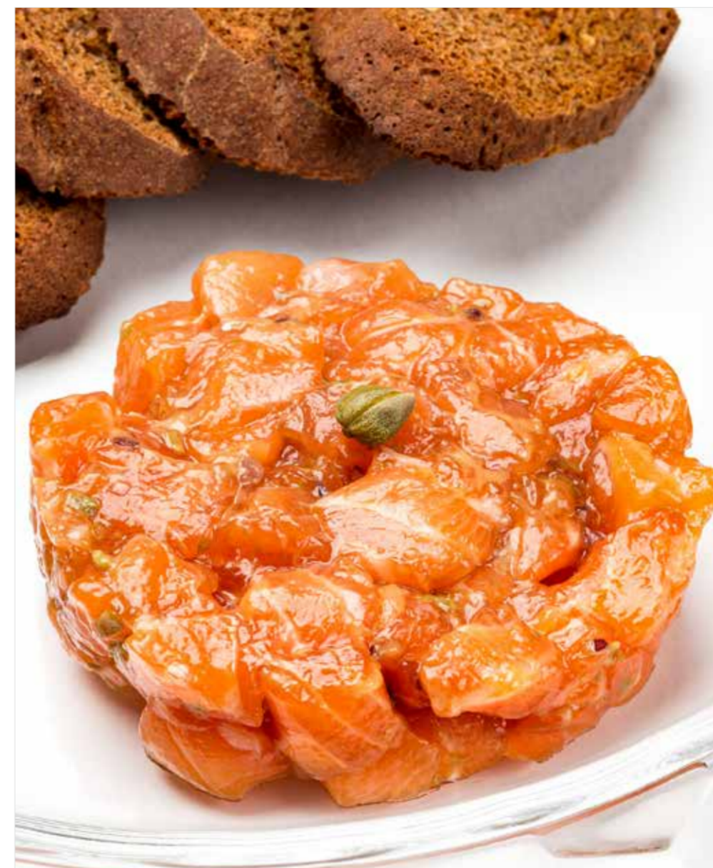
ТАРТАР ИЗ ЛОСОСЯ Salmon tartare 三文鱼塔塔