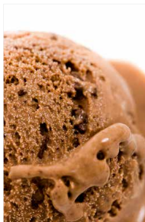
МОРОЖЕНОЕ В АССОРТИМЕНТЕ