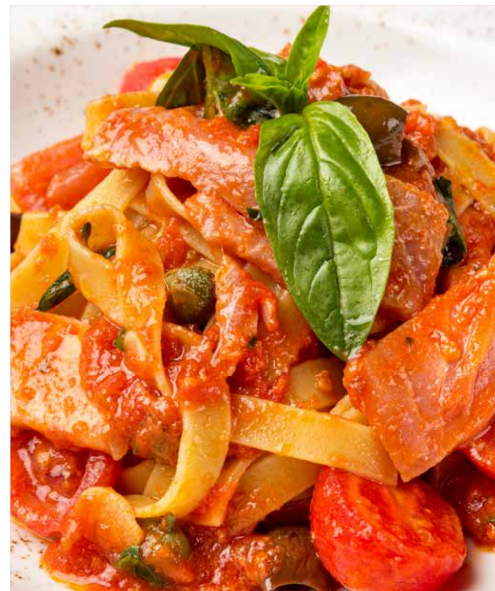
ТАЛЬЯТЕЛЛЕ С ТУНЦОМ Tagliatelle with tuna 金枪鱼意大利干面条