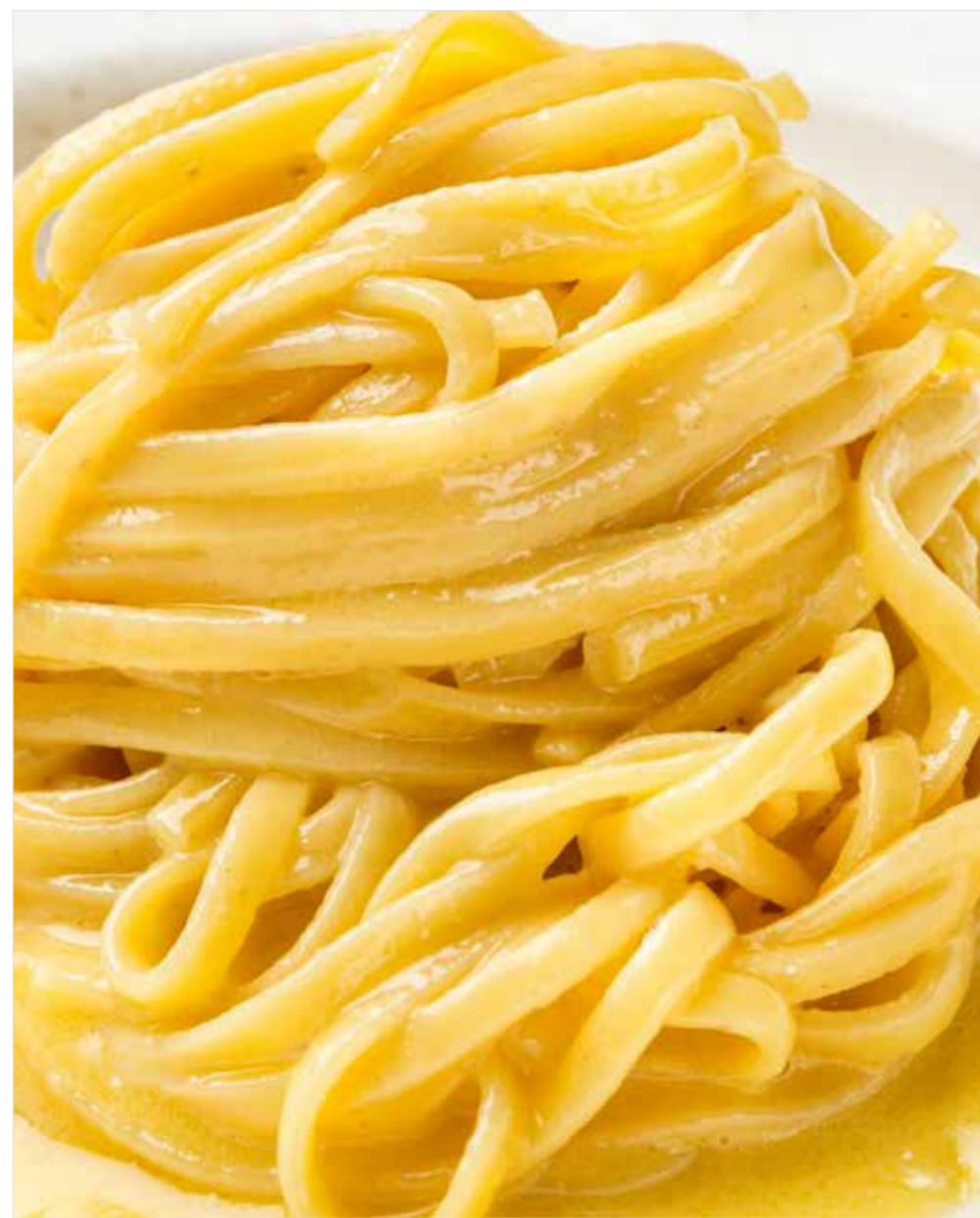
ДОМАШНИЕ ТАЛЬОЛИНИ С ПАРМЕЗАНОМ Homemade tagliolini with parmesan 家常意式干面加帕马森奶酪