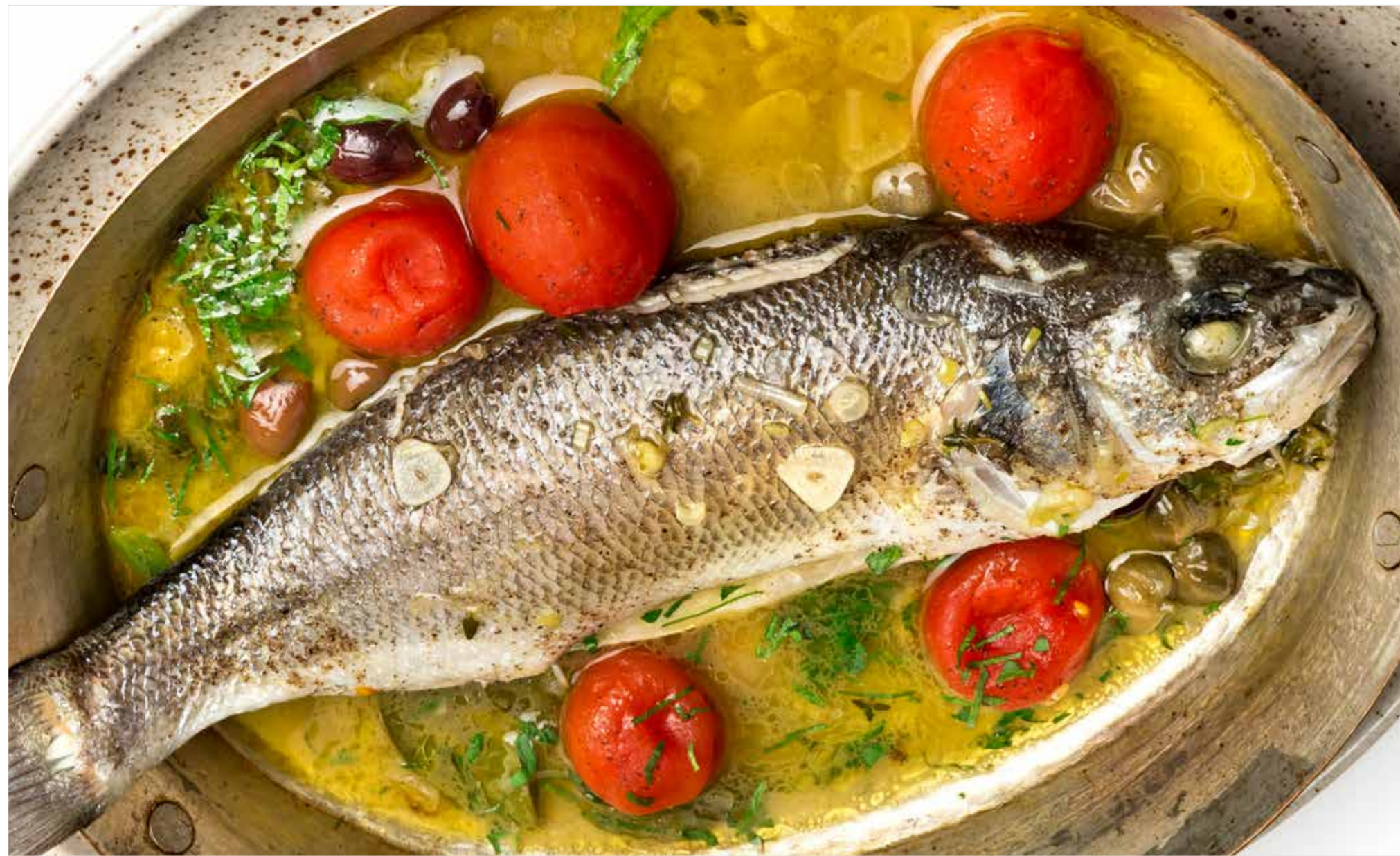
СИБАС / ДОРАДО АКВА ПАЦЦА Sea bass / dorado "acqua pazza" 意大利式煮欧洲鲈/鲷鱼