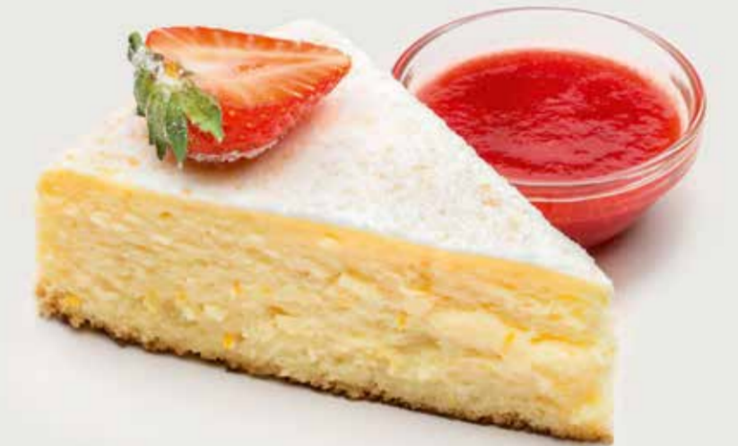
ЧИЗКЕЙК КЛАССИЧЕСКИЙ 390 Classic cheese cake 原味奶酪蛋糕