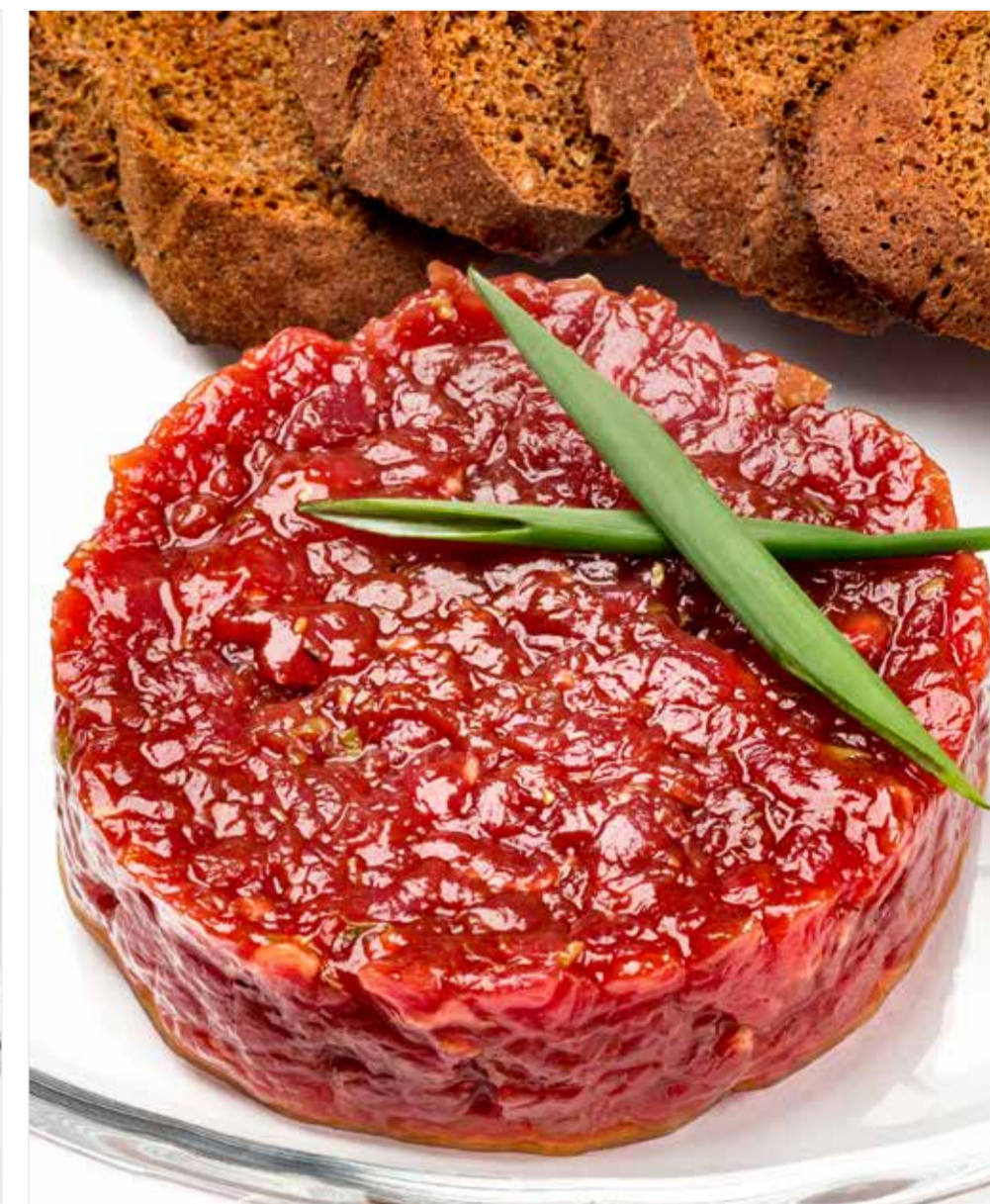
ТАРТАР ИЗ ГОВЯДИНЫ / С ТРЮФЕЛЬНОЙ ЗАПРАВКОЙ Beef tartare / with truffle seasoning 牛肉塔塔 / 松露酱