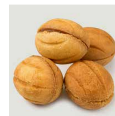
ОРЕШКИ СО СГУЩЕНКОЙ (4 шт.)

Walnut shaped cookies with caramel (4 pcs) 炼奶坚果形饼干 (4个)