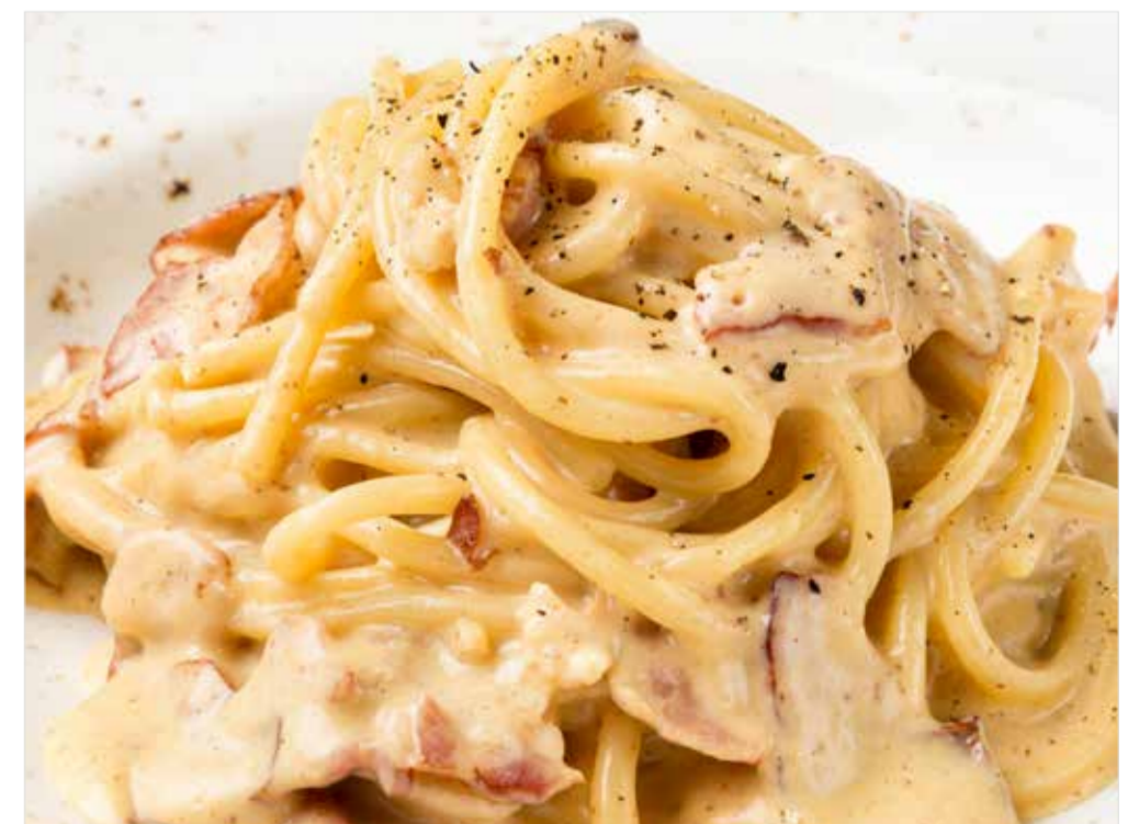
КАРБОНАРА Carbonara 培根蛋面