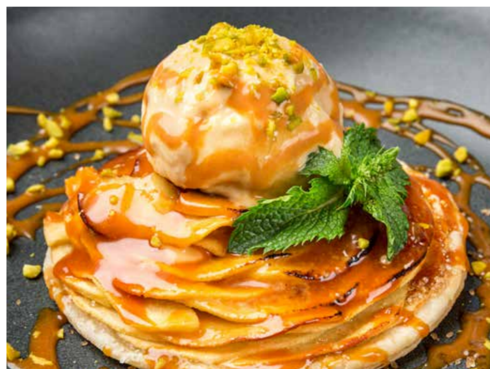
ЯБЛОЧНЫЙ ПИРОГ С ОРЕХАМИ, КАРАМЕЛЬНЫМ СОУСОМ И МОРОЖЕНЫМ 490 Apple pie with nuts, caramel sauce and ice-cream 苹果派与坚果, 焦糖酱和冰淇淋