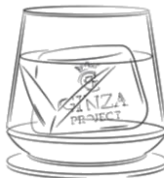
THE MACALLAN NEGRONI 1700 THE MACALLAN TRIPLE CASK 12 Y.O.,