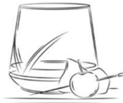
THE MACALLAN FOODPAIRING 2600 ₺

THE MACALLAN TRIPLE CASK 12 Y.O., PEDRO XIMENEZ, LEMON JUICE, CANDY SYRUP, EGG WHITE