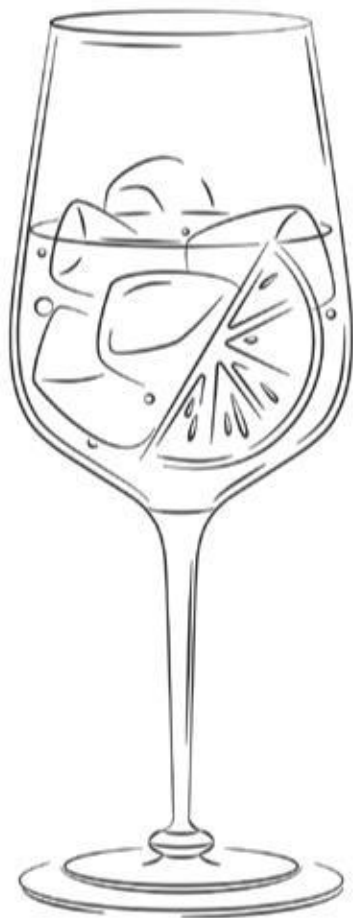
THE MACALLAN SPRITZ 1700 ₺

THE MACALLAN TRIPLE CASK 12 Y.O., PEDRO XIMENEZ, TONIC