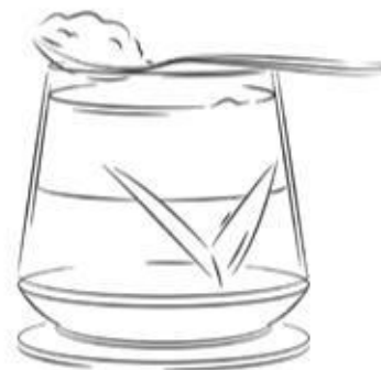
THE MACALLAN SOUR 1700 ₺

THE MACALLAN TRIPLE CASK 12 Y.O., PEDRO XIMENEZ, TONIC