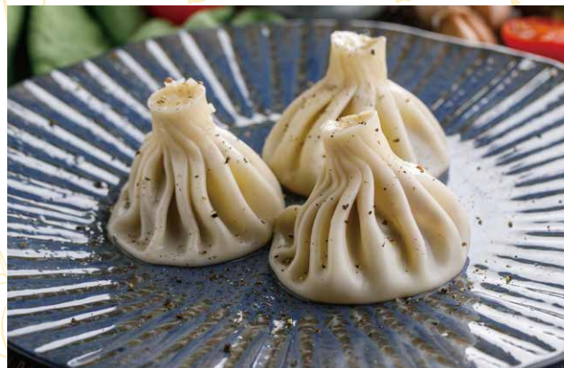
ХИНКАЛИ С ГРИБАМИ / МАНТЫ С ЧЕЧЕВИЦЕЙ 100 / 350 Р 80 гр. / 210/30 гр.