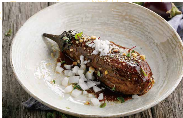
ПЕЧЕННЫЙ БАКЛАЖАН С ОВОЩНЫМ ДЕМИГЛЯСОМ 590 Р 240 / 60 / 20 гр.